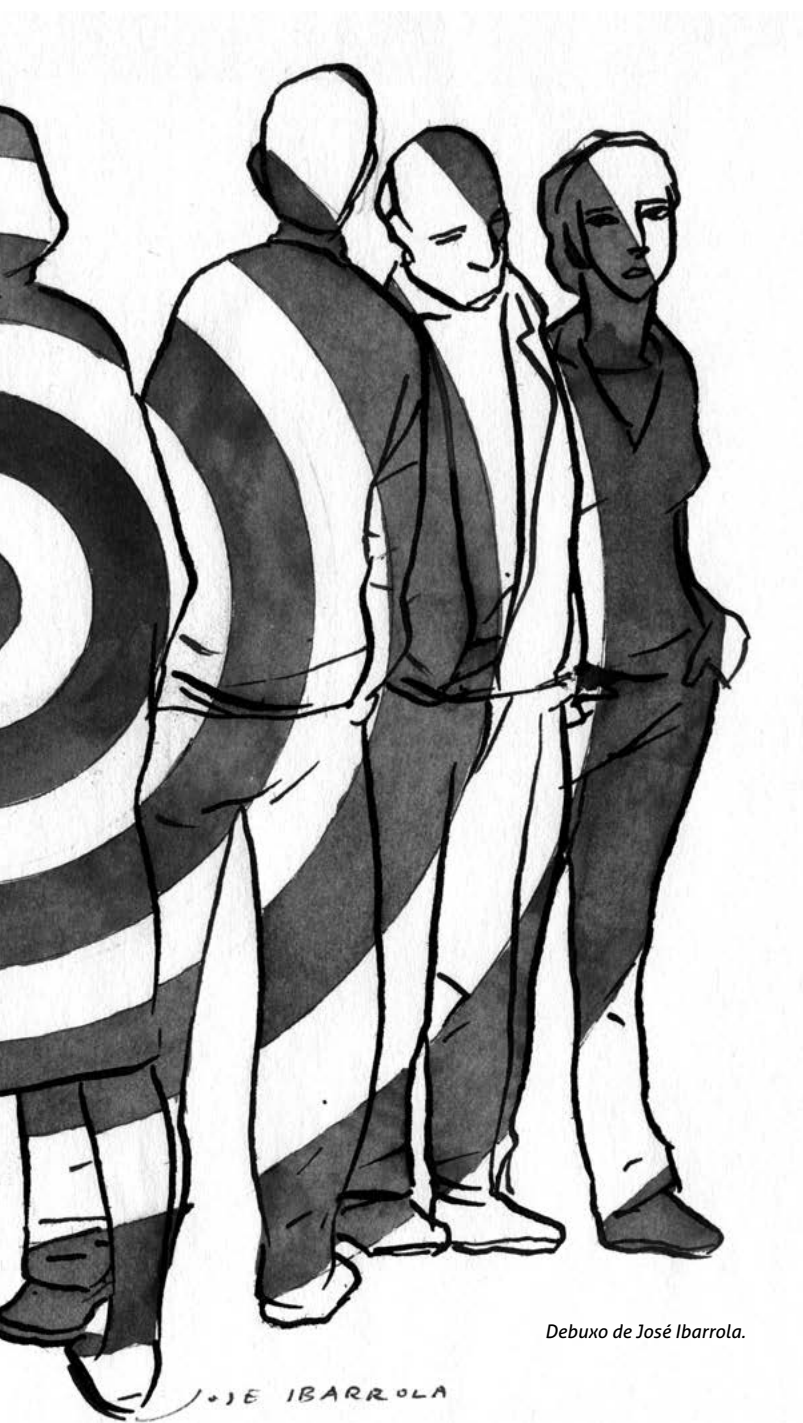
Debuxo de José Ibarrola.

Son moi importantes os coñecementos adquiridos, a análise das túas emocións e sentimentos, a reflexión sobre o que facemos ante as vítimas de violacións de dereitos humanos (en concreto do terrorismo), así como a súa petición de memoria, xustiza, verdade e reparación.