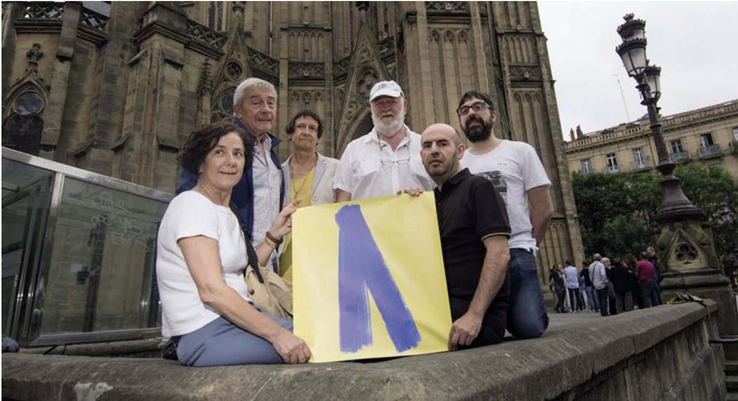
Imaxe da reportaxe El secuestro que desató el lazo azul (O secuestro que desatou o lazo azul) .