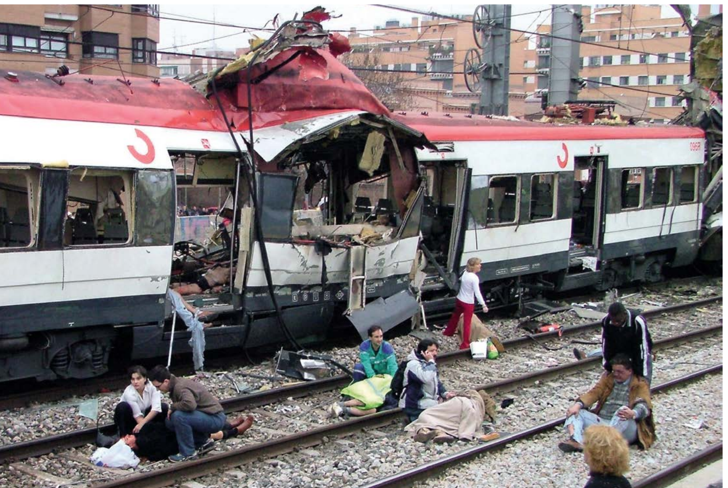
Vítimas do atentado do 11-M de 2004 recibindo axuda.