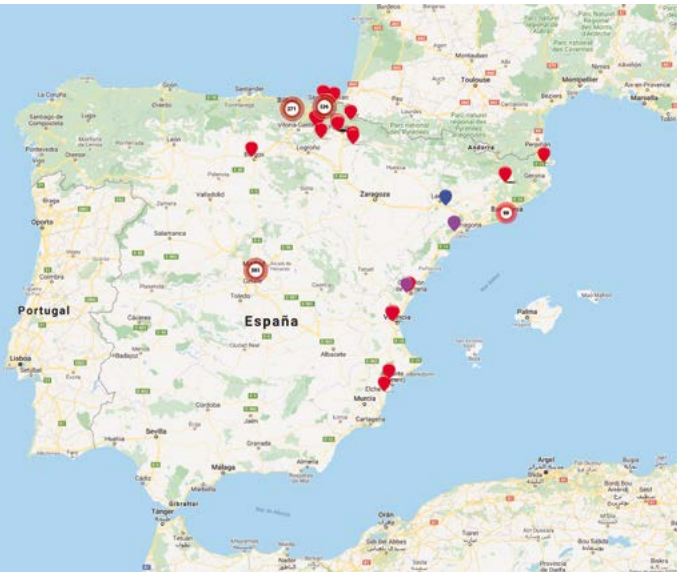
Mapa do terror de Covite: https://mapadelterror.com

Lamentablemente esta vulneración dos dereitos humanos ocorre en boa parte do mundo e tamén moi preto de ti. Hai un dato arrepiante: só en España, case 1.500 persoas perderon a vida como consecuencia de actos terroristas desde 1960.