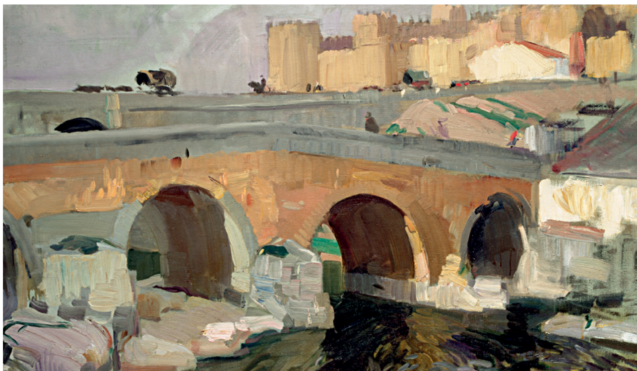
Joaquín Sorolla Bastida (1923). El Puente Viejo de Ávila. Museo Sorolla, Madrid