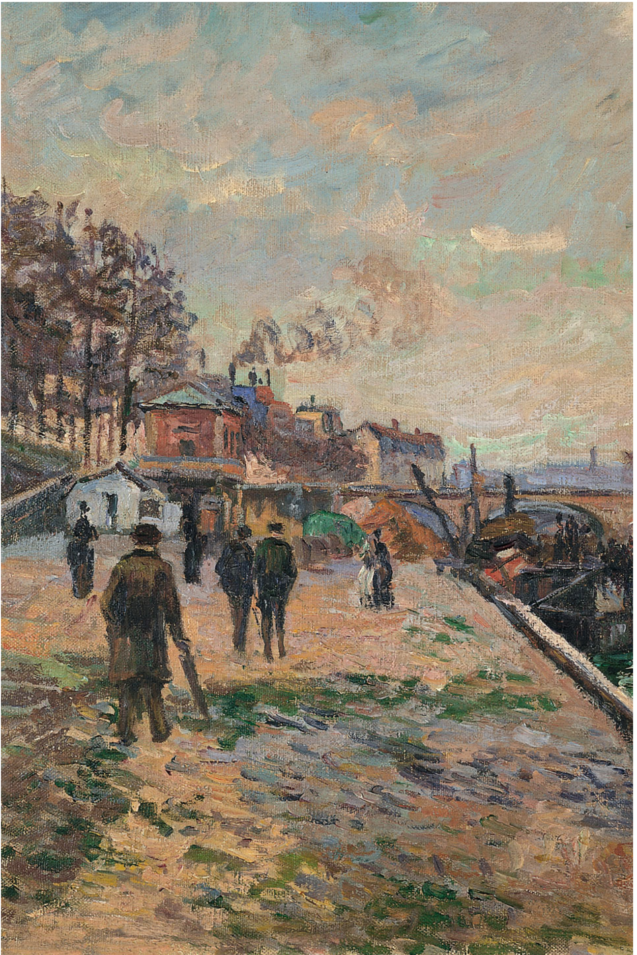
Armand Guillaumin (1880). El puente del Arzobispado y el ábside de Notre-Dame, París (detalle).