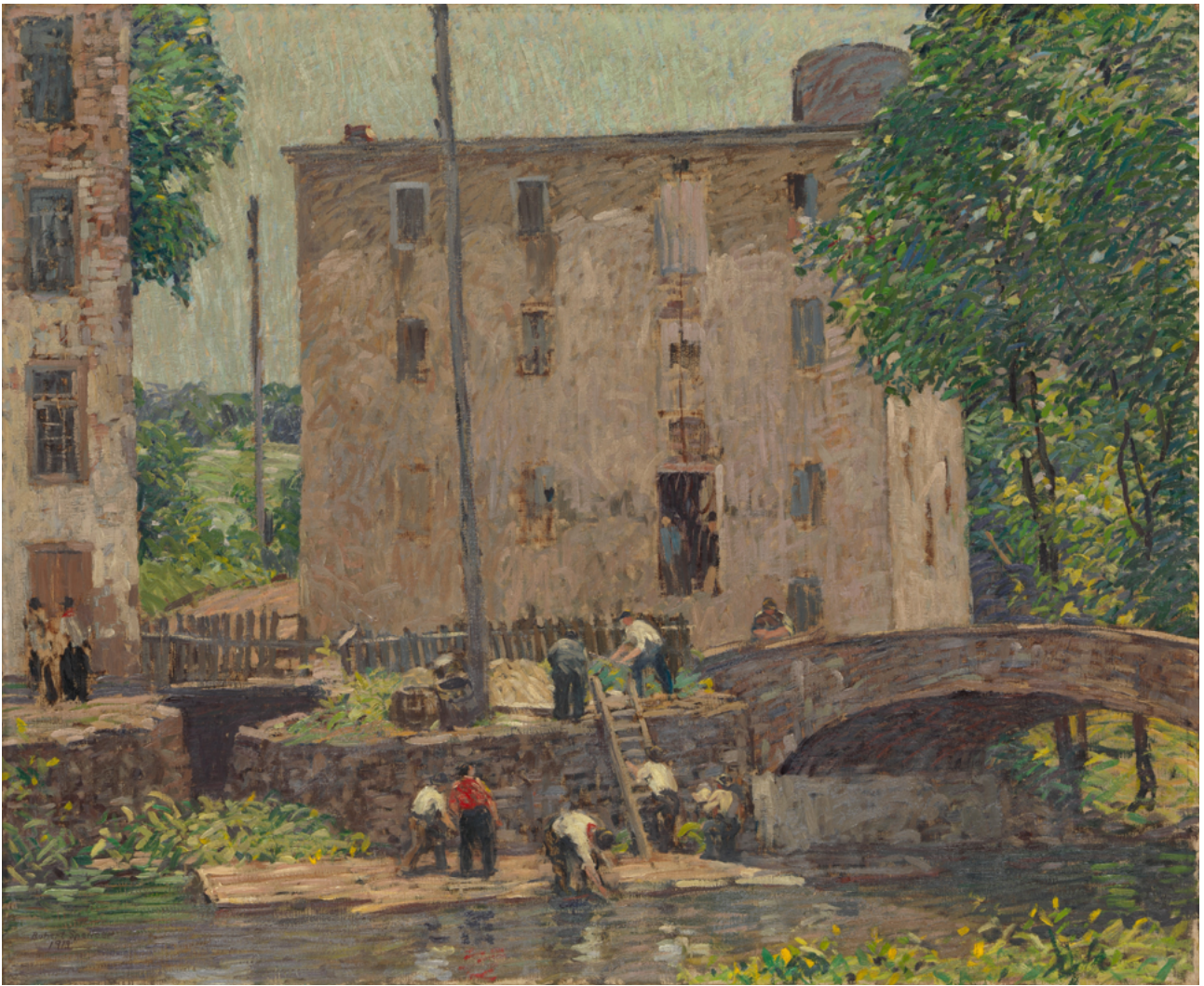
Robert Spencer (1913). Repairing the Bridge (detalle). The Metropolitan Museum of Art, New York ( www.metmuseum.org ).

(Programa de Prelectura y Escritura) en las etapas iniciales de la escolaridad.