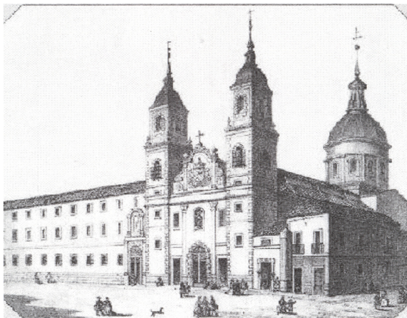
CONVENTO DE LOS JESUITAS

Hasta mediados de siglo no se inicia la construcción del nuevo edificio del Noviciado. Se construye adosado a la iglesia en dirección a la calle Reyes, pero sin llegar al final porque allí estaba la casa que no se compró hasta años después, y que probablemente la tenían en alquiler.