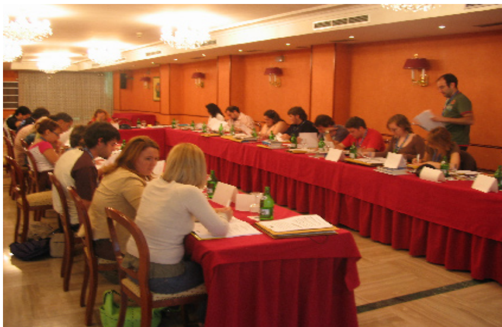
Comisión de Participación y Promoción Asociativa del CJE

* La educación para la participación, a través de las escuelas de debate y formación, pero también en cada uno de los programas,