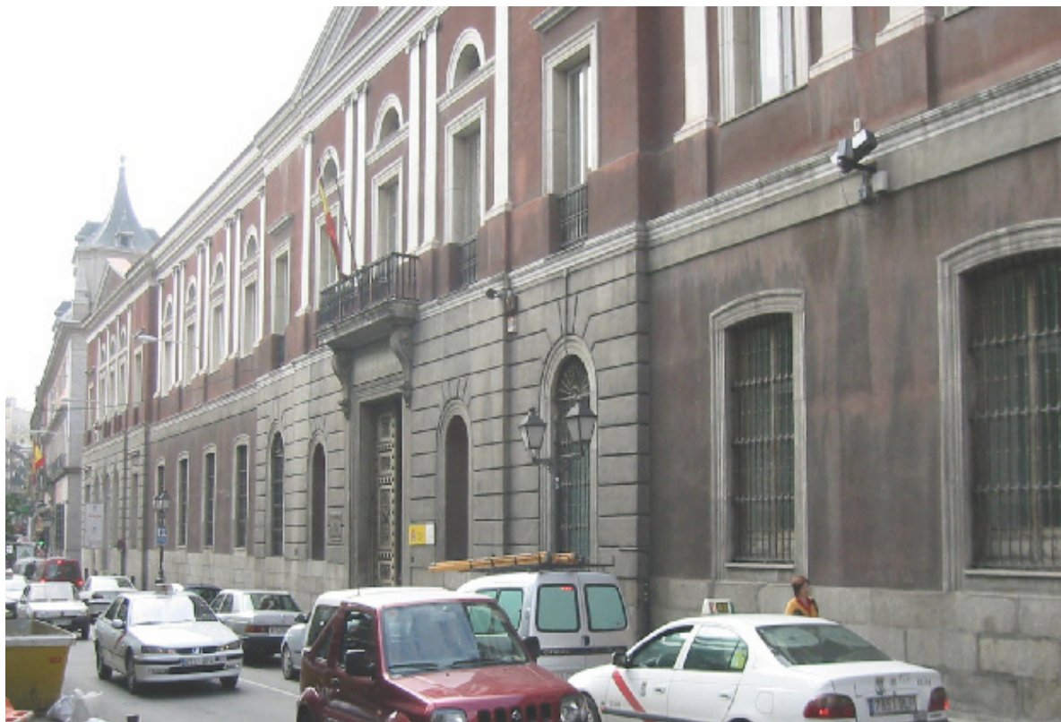
Entrada y fachada principal del CEE. antigua Universidad Central en San Bernardo 49 (Madrid)