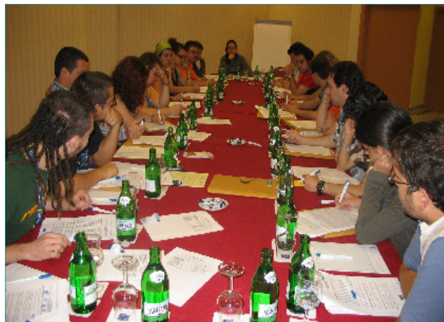
Comisión de Educación Integral del CJE

Así, el Consejo de la Juventud de España entiende la participación como un proceso y un enfoque transversal que recorre toda su acción, insertándose dentro de un contexto social y político de amplio alcance, y que responde a criterios políticos, democráticos y