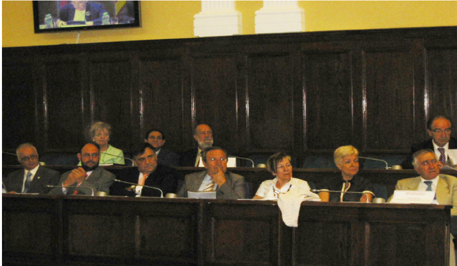
Los presidentes de los Consejos Escolares Autonómicos asistieron invitados a la reunión informal del Pleno del CEE.