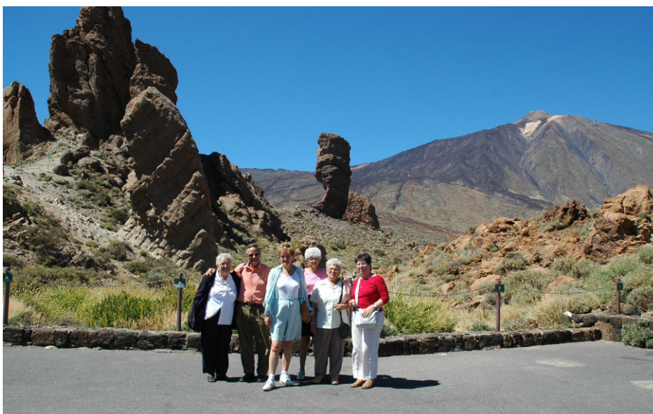
Recuerdos de viaje

misma base, logró convencer en 1983 al ministro Maravall para organizar un Congreso de Movimientos de Renovación Pedagógica que tan importante papel jugaron en la actualización y modernización del sistema educativo desde los finales de la Dictadura y sobre todo en los primeros años del periodo democrático. Hoy también vemos con rasgos de normalidad que las administraciones educativas se preocupen de la formación permanente del profesorado y que fomenten la innovación educativa ofreciendo convocatorias y creando premios. Pero este es un logro de esos movimientos en los que Marta militó como una de las principales impulsoras.