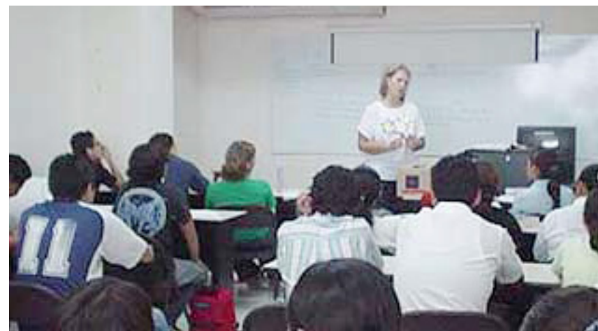
Aula de la UGR

y en el que resulta evidente la imposición externa de unos intereses que no son los propios de la persona, sino de los dirigentes sociales que pretenden ciudadanos disciplinados antes que con capacidad crítica para intervenir en la cosa pública.