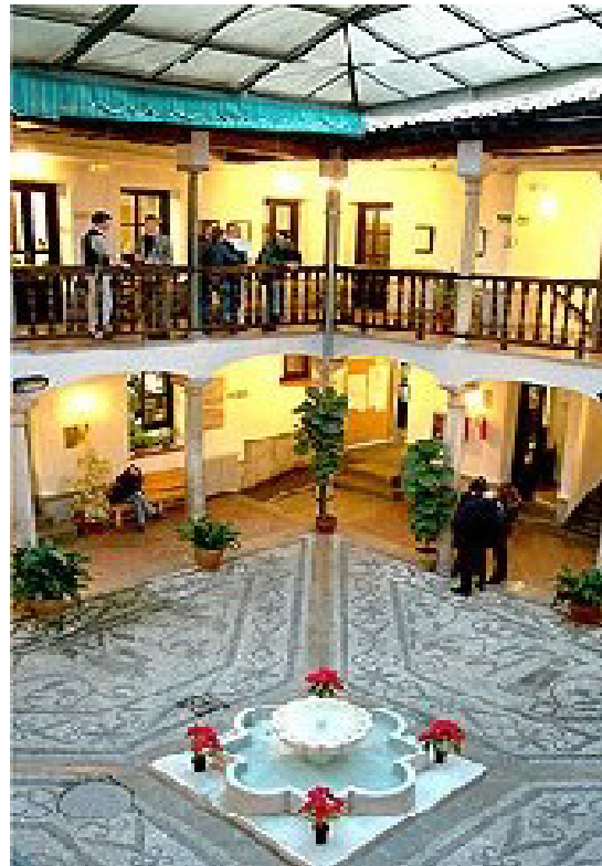
Centro de Lenguas Modernas de la UGR

Para mí el problema no está en que el proceso educativo tenga un valor extrínseco, sino en el predominio agraute que uno tiene sobre el otro, y que induce al alumnado a intentar hacer lo mínimo de trabajo para conseguir la máxima nota, de modo que en vez de preocuparse por aprender, se preocupa por tener el mejor expediente posible. Y si para eso hay que mentir y decir que no se les mandó un trabajo (por poner un ejemplo de nuestros estudios de caso), o que no recuerdan lo que se les explicó en la clase anterior, se miente. Y si hay que copiarse en un examen o pedirle ayuda a un colega para aprobar un examen, se copia y se le pide ayuda. Y si para evitarlo hay que ejercer un control coercitivo sobre el alumnado, tratando al conjunto como presuntos infractores, se ejerce. Y si se puede evitar porque quien imparte la clase no es el profesor titular (por tratarse de un sustituto o un estudiante en prácticas), sin que se le reconozca por tanto la capacidad de control, aunque sí la de enseñante, se evita