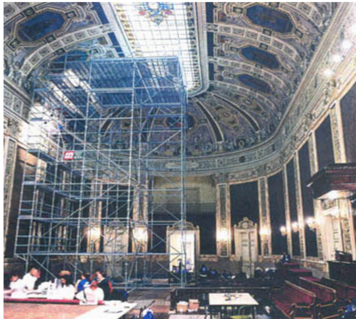
Restauración del Parinifo de la U. Complutense

Se hace una fachada neoclásica de dos plantas que unifica todo el frente, con tres cuerpos ligeramente adelantados y rematados con un frontón para romper la monotonía del alero y darle ritmo visual con pilastras jónicas, y una sucesión de ventanas adinteladas, encima de la cuales se colocan arcos de medio punto, en contraposición con la fachada renacentista de la Universidad de Alcalá de Henares.