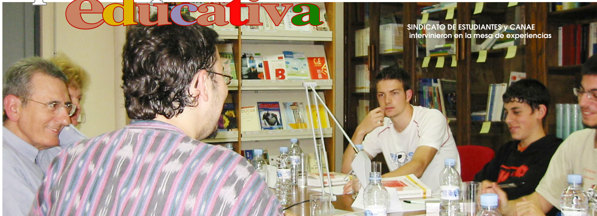
SINDICATO DE ESTUDIANTES y CANAE intervinieron en la mesa de experiencias