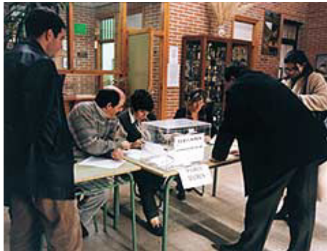
Elecciones a representantes de los Consejos Escolares

El asociacionismo de alumnos y la Ley Orgánica 1/2002, de 22 de marzo, que aprueba las normas reguladoras del derecho de asociación