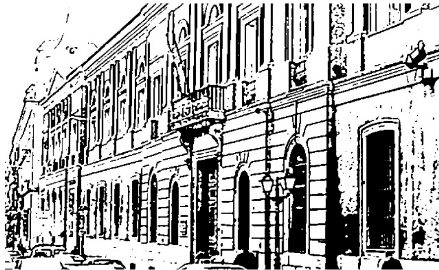
Entrada y fachada principal del CESE antigua Universidad Central en San Bernardo 49 (Madrid)

De la evolución anterior cabe extraer algunas conclusiones generales. La representación del alumnado en los Consejos Escolares ha estado siempre ligada a la representación de los padres, ya que la suma de los dos sectores no podía ser inferior al tercio del total de