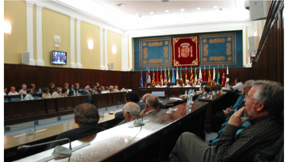
Panorámica de la reunión informal del Pleno del 18 de mayo

Sirva esta mi primera intervención como Ministra en este órgano colegiado si no les resulta inconveniente para plantear de entrada toda la panorámica de trabajo que abordamos hoy. Quiero anticipar, quiero poner en su conocimiento, los contenidos de lo que va a ser nuestra agenda en las próximas semanas. Como informe de esta Ministra quiero decirles sras. y sres. Consejeros que dentro del desarrollo normativo de la LOE someteremos inmediatamente a su consideración la adaptación del Consejo Escolar del Estado a la realidad de la España del estado