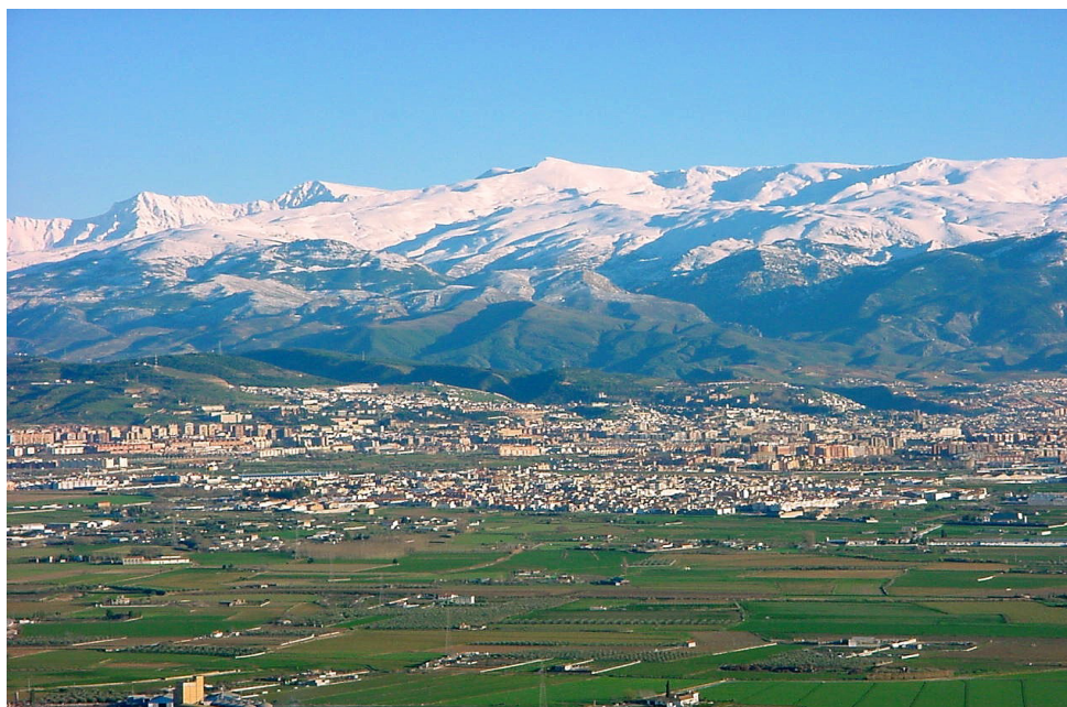
Vista General de Granada

Por supuesto la situación ha cambiado desde hace doscientos años hasta nuestros días, si bien la estructura escolar básica es básicamente la misma, y tan cierto es decir que la Ilustración supuso un avance como afirmar que fue una rémora para el sistema educativo. La consecuencia desde los mismos inicios de la escuela moderna ha sido la discriminación del alumnado por el hecho de serlo, y el modo de conseguirlo es aplicando una doble moral: la