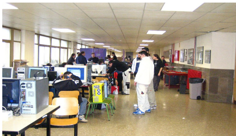
Bitsparty celebrado en la Universidad de Granada