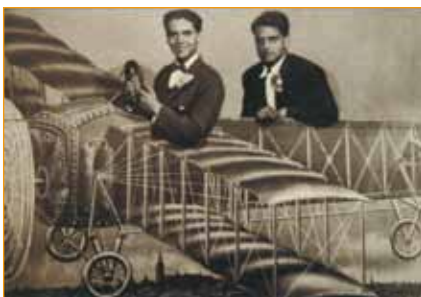
Federico con Luís Buñuel.