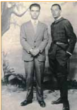
Federico con Salvador Dalí.