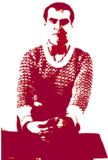
Federico García Lorca.