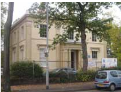
Casa de Elizabeth Gaskell en Manchester.

La casa-museo de la escritora Elizabeth Gaskell está en el sur de Manchester. Es una casa del siglo XVIII, de dos plantas con grandes ventanas y un jardín. La escritora vivió allí con su familia y escribió sus obras allí. La casa necesita restauración pero hay una sociedad que recoge dinero para arreglarla. Esta abierta al público el primer domingo de cada mes y la sociedad Gaskell organiza lecturas y conferencias. También se puede tomar té o café con pasteles y se pueden comprar libros en la biblioteca.