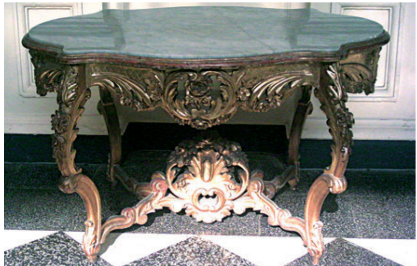
Figura 10. Mesa auxiliar. Madera tallada y dorada, mármol tallado y pulido. Siglo XVIII. 82 x 115,5 x 70 cm. Colección MALI (código: 2.3/84/V).