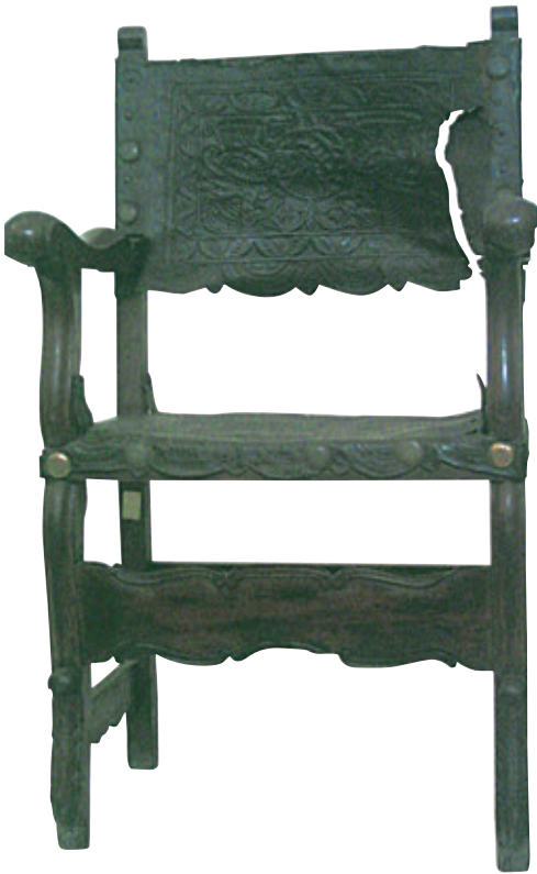
Figura 1. Sillón frailer. Madera tallada y barnizada, cuero repujado. Siglo xviii. 105 x 57,2 x 50 cm. Colección MALI (código: 2.3/115/V).