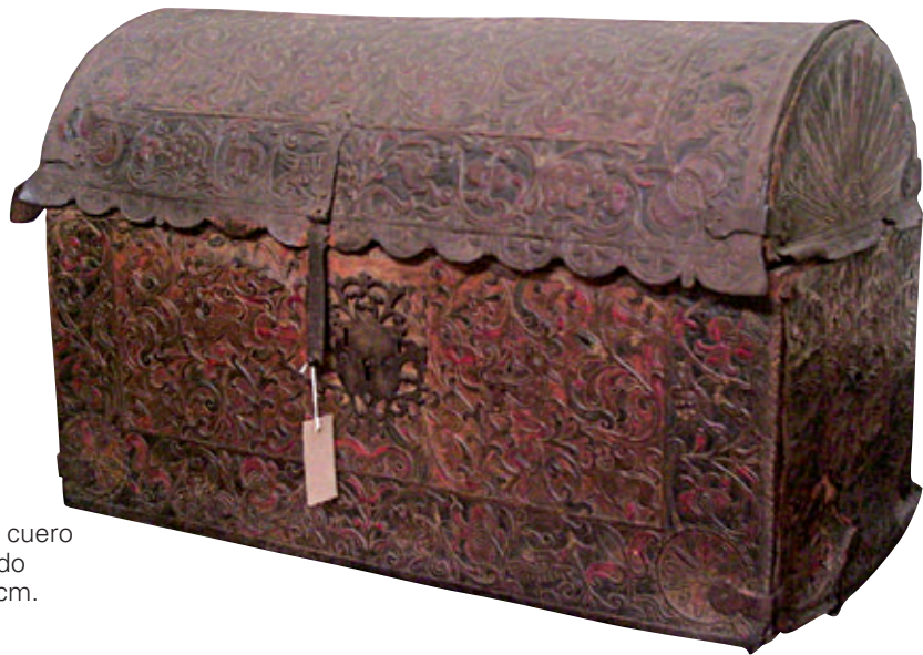
Figura 16. Baúl. Madera revestida con cuero repujado y policromado, hierro martillado y cincelado. Siglo XVIII. 68 x 92 x 42,5 cm. Colección MALI (código: 2.3/99/V).