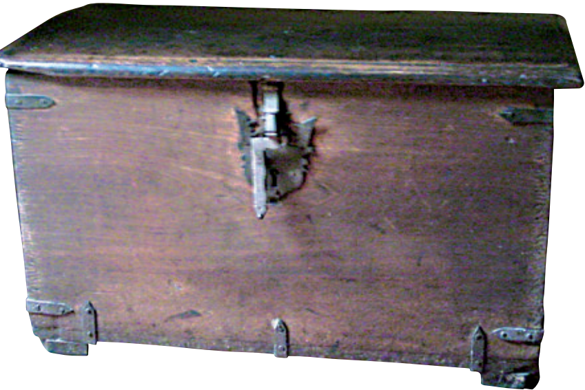
Figura 15. Baúl. Madera ensamblada decorada con incisiones. Siglo XVIII. 125 x 132 x 45,5 cm. Colección Casa Goyeneche - Banco de Crédito del Perú.