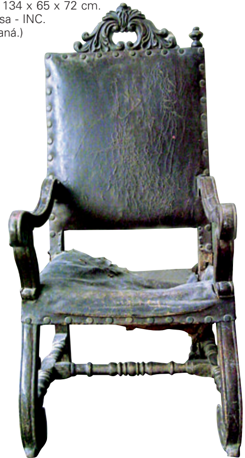
Figura 3. Sillón. Madera y tapizada con cuero. Siglo xviii. 134 x 65 x 72 cm. Colección Quinta Presa - INC.