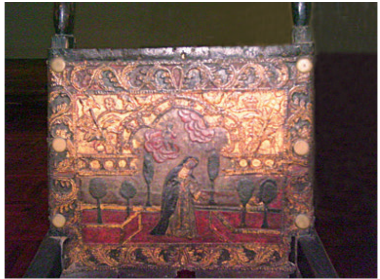
Figura 2. Sillón frailer (detalle). Madera tallada y barnizada, cuero repujado, policromado y dorado. Siglo xvii. 114 x 55 x 51 cm. Colección MALI (código: 2.3/100/V).