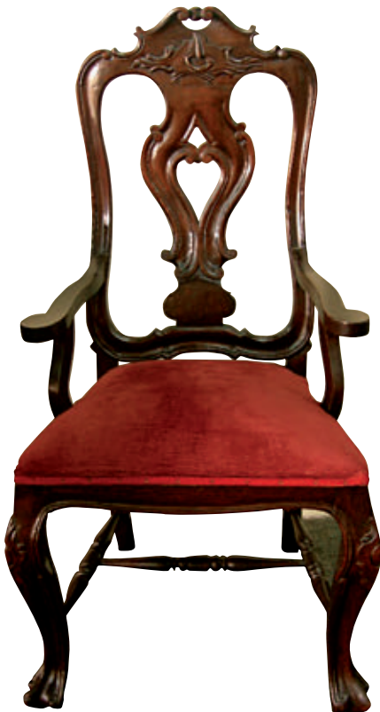
Figura 4. Silla. Madera tallada, barnizada y tapizada con tela. Siglo xviii. 118 x 64 x 57,5 cm. Colección Quinta Presa - INC.