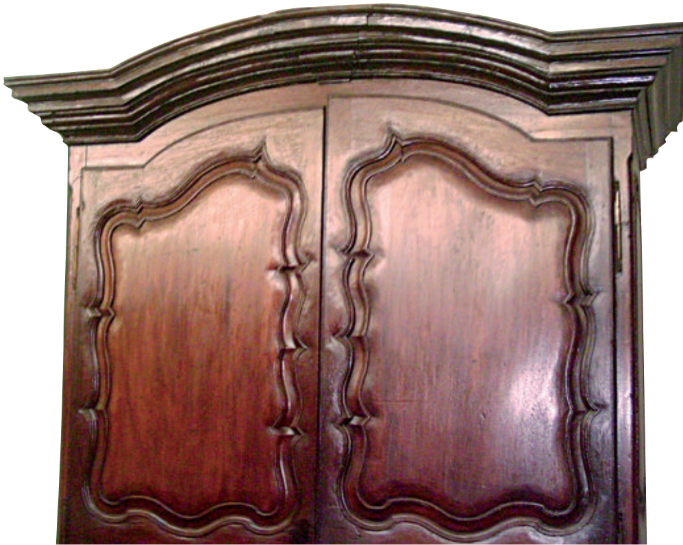
Figura 17. Armario (detalle). Madera tallada y barnizada. Siglo XVIII. 241 x 140 x 70 cm. Colección MNAAHP (código: 1966-692).

trata de los estantes. En el inventario de Castelladosrius encontramos dos, uno de ellos, el único que se describe, muy ricamente decorado con una coronación de bronce y con pie y mesa; en el de don Pedro Carrillo y Albornoz hay cuatro barnizados para libros; y en el del conde de Fuente González hay tres en los que sólo se especifica su función, uno para papeles y otro para libros.