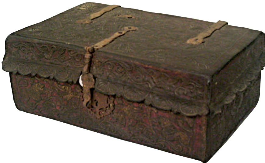
Figura 19. Cofre. Madera recubierta con cuero repujado y policromado, hierro forjado. Siglo XVIII. 22 x 54,3 x 33 cm. Colección MALI (código: 2.3/116/V).

bles ubicados por lo general en los cuartos de dormir y que, si bien su función era la de guardar la ropa de cama y de vestir, eran usadas más bien como decoración –como objeto de ostentación–, suposición basada en los ricos materiales en los que estaban realizadas varias de ellas y en que nunca se indica que contuvieran algún tipo de objeto. Se trata de muebles que tuvieron gran auge en Europa en el siglo XVIII, especialmente en Francia, y al parecer empiezan a usarse en Lima a fines de este siglo. Entre las cómodas ubicadas en los inventarios revisados destaca una cómoda francesa con su piedra de jaspe encima, dos cómodas inglesas embutidas con tiradores de metal, dos cómodas embutidas con herrajes de latón y tres cómodas de caoba.