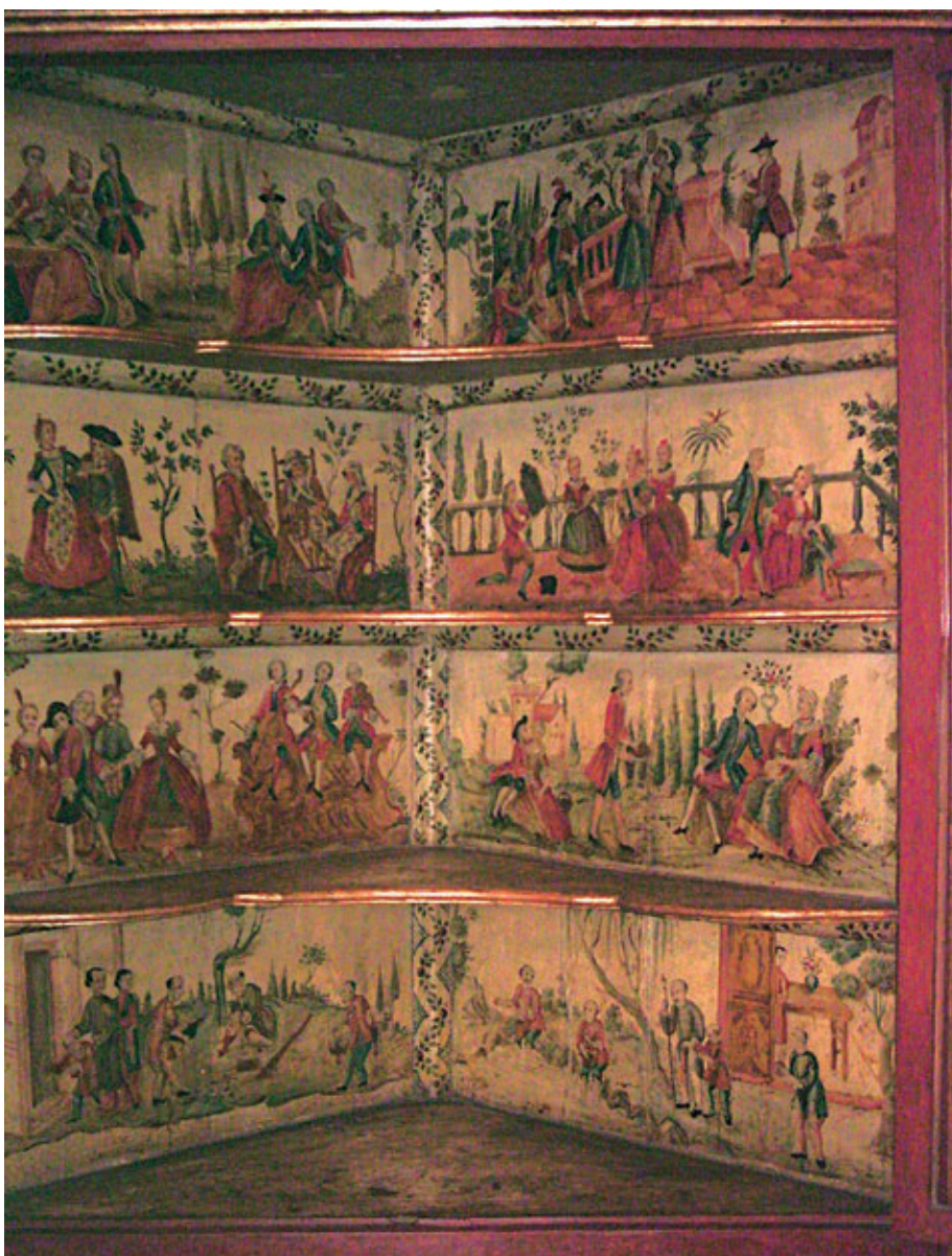
Figura 20. Rinconera (detalle). Madera tallada, pintada y dorada. Siglo XVIII. 254 x 123 x 64 cm. Colección Casa Goyeneche - Banco de Crédito del Perú.

En cuanto al armario de la colección Cabrera Ganoza, es un mueble particular, ya que no fue una forma tan común de mueble esquinero. Se trata de un ejemplar sencillo en el que se ha dejado la madera a la vista y que está decorado únicamente con cuarterones en su frente.