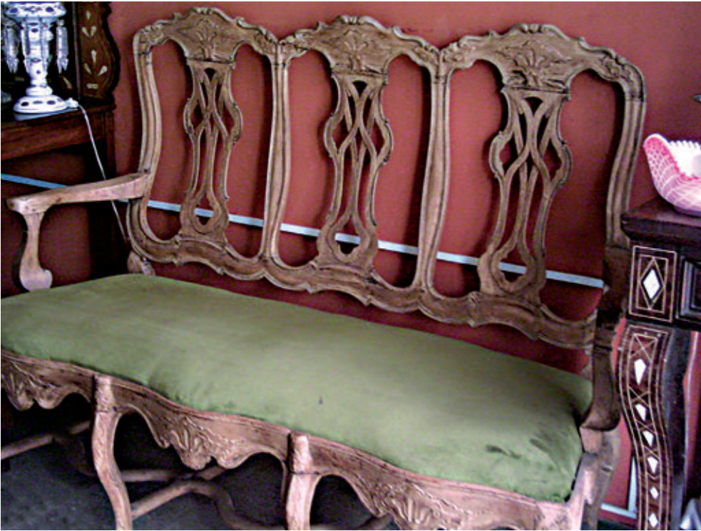
Figura 5. Canapé. Madera tallada, calada y tapizada con tela. Siglo XVIII. 160 x 122 x 60 cm. Colección Alfonso Cabrera Ganoza.