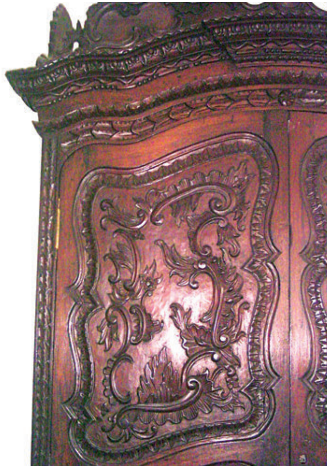
Figura 18. Armario (detalle). Madera tallada y barnizada. Siglo XVIII. 320 x 134 x 65 cm. Colección MALI (código: 2.3/122/V).