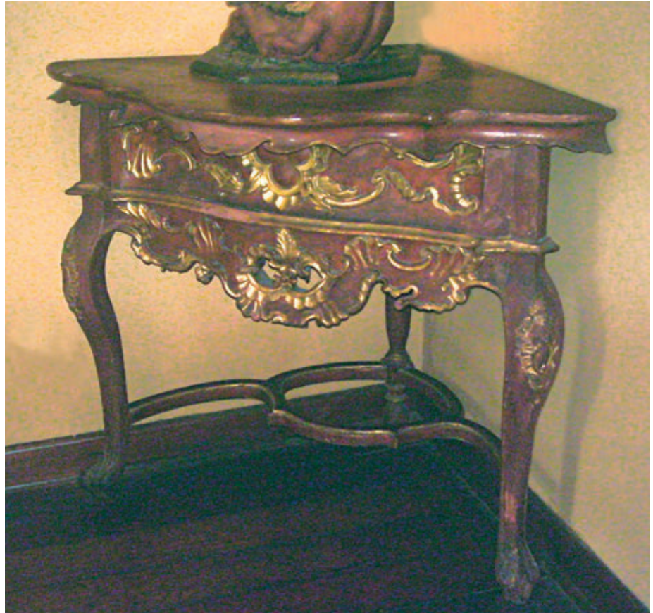
Figura 21. Mesita rinconera. Madera tallada, pintada y dorada. Siglo XVIII. 89 x 109 x 85 cm. Colección Casa Goyeneche - Banco de Crédito del Perú.

18 Gusto que se extiende, además, debido al comercio ilegal de productos que llegaron a América en barcos franceses desde fines del siglo XVII. Como explica Deustua, es sobre todo a inicios del siglo XVIII, con la guerra de Sucesión, que este comercio se acrecienta. El conflicto armado «[...] interrumpe las normales relaciones de comercio. [...] Frente a la circunstancia difícil de la guerra, las Indias no se encuentran incomunicadas, ni mucho menos. La conyuntura francesa hará que los comerciantes galos y Luis XIV sean muy importantes beneficiarios del comercio americano a través de la furtiva presencia de barcos franceses que, cargados de mercancías, so pretexto de arribada forzosa o de otro artilugio, conseguían que se les permitiera entrar a los puertos americanos. El contrabando, fenómeno secular con el que se acostumbró a vivir el comercio legítimo, se acrecienta en los comienzos de este siglo. Es desde Saint Maló en Francia [...] que se organiza y multiplica este comercio intélope que va a inundar de productos al mercado colonial americano» (Deustua, 1993: 308).