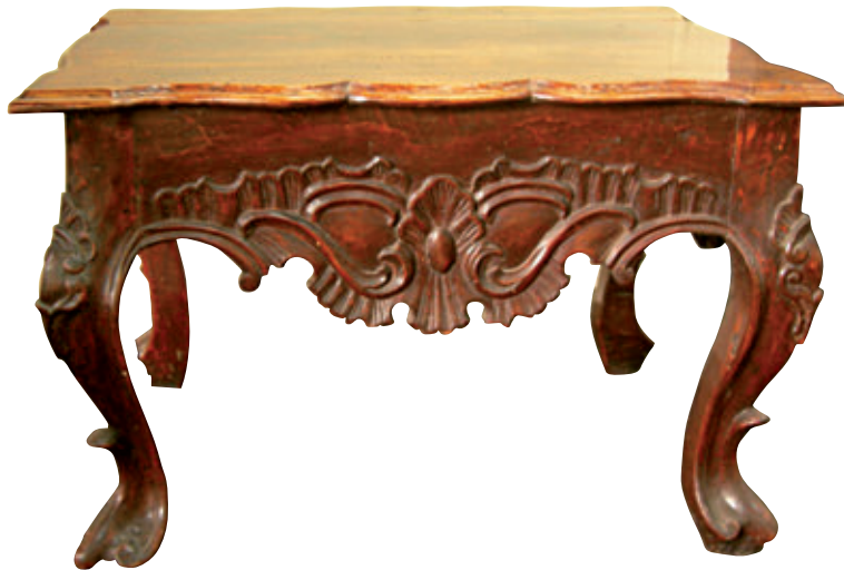
Figura 9. Mesita auxiliar. Madera tallada y barnizada. Siglo XVIII. 41,5 x 60,5 x 45 cm. Colección Quinta Presa - INC.