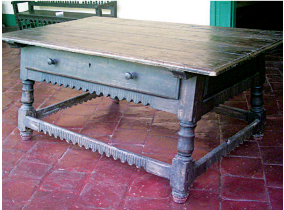
Figura 7. Mesa. Madera tallada, barnizada y decorada con marquetería. Siglo XVIII. 84 x 198,5 x 116,5 cm. Colección MNAAHP (código: 1966-798).