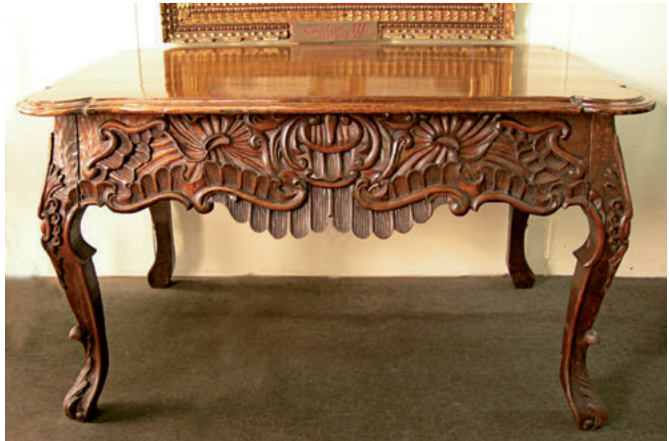
Figura 8. Mesa. Madera tallada y barnizada. Siglo XVIII. 93 x 160 x 114,5 cm. Colección Quinta Presa - INC.