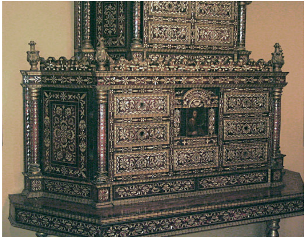
Figura 13. Papelera o bargueño (detalle). Madera tallada y dorada, enchapado de carey con incrustaciones de concha de perla, plancha de metal pintada. Siglo XVIII. 227 x 183 x 61 cm. Colección Casa Goyeneche - Banco de Crédito del Perú.