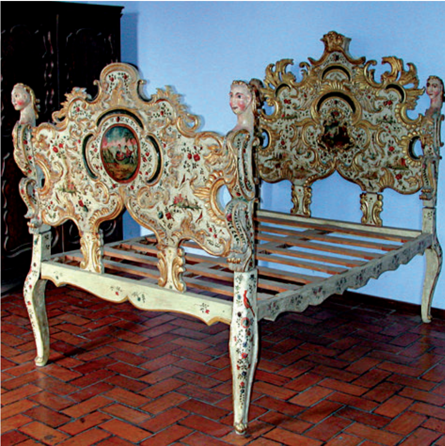
Figura 12. Cama. Madera, pintada y dorada. Siglo XVIII. 178 x 141 x 200 cm. Colección Quinta Presa - INC.