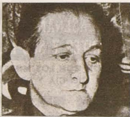
Secretario general del Movimiento; don Torcuato Fernández Miranda. Es catédrico de Derecho Político.