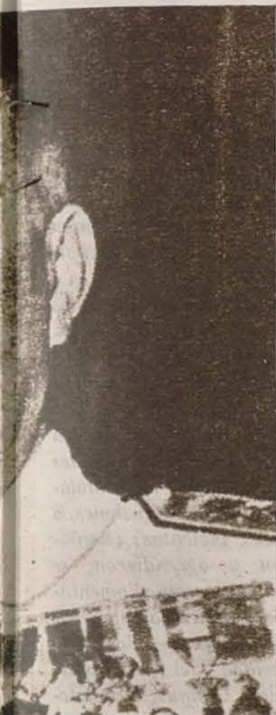
nte don Luis Carrero Blanco.

egran el nuevo Gobierno de nisterial continúan al frente os de Justicia, Obras Públi- de Desarrollo.