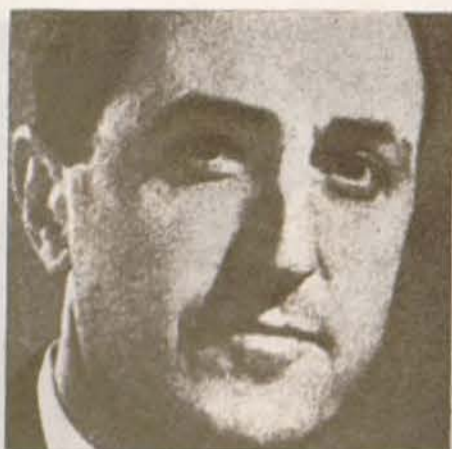
Asuntos Exteriores; don Gregorio López Bravo. Doctor en Ingeniería Naval.