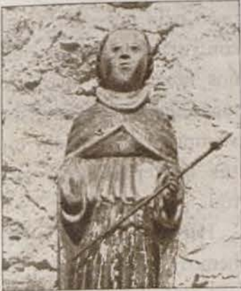
Talla del siglo XVI, localizada por un grupo de estudiantes de un pueblo de Segovia.

3.800 NIÑOS PARTICIPAN YA EN LA "MISION RESCATE"