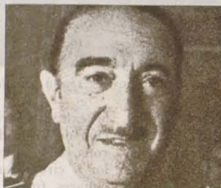
Gobernación; don Tomás Garricano Goñi. General auditor del Cuerpo del Ejército del Aire.