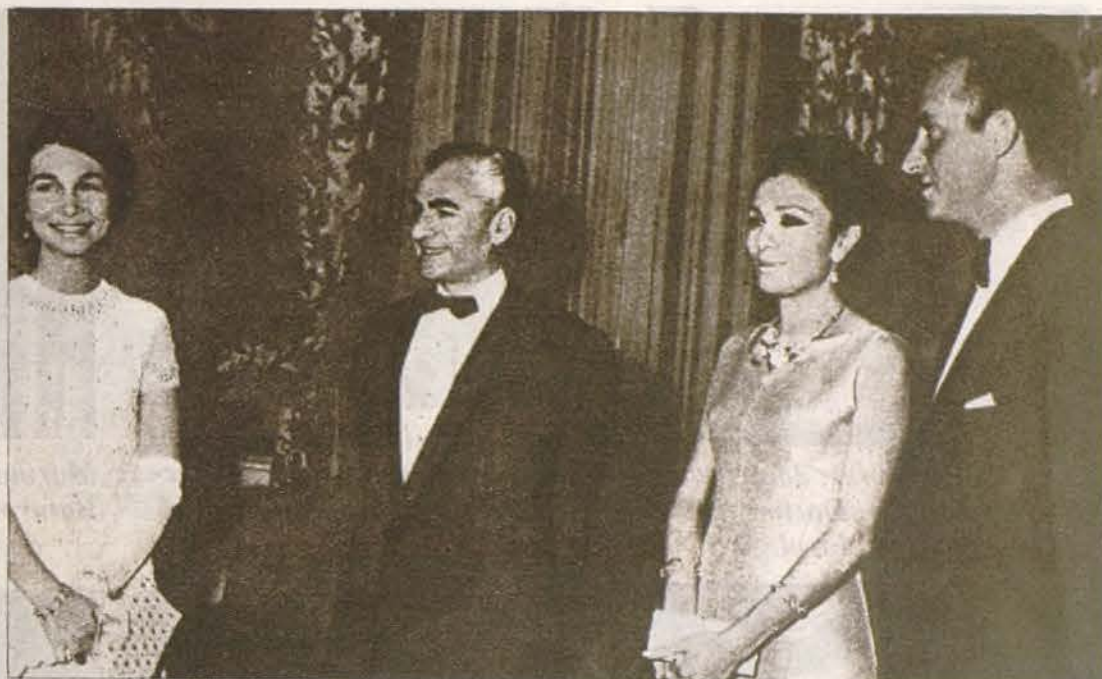
Los Príncipes de España, con los emperadores del Irán.

El Príncipe visitó ese mismo día el Senado ira-