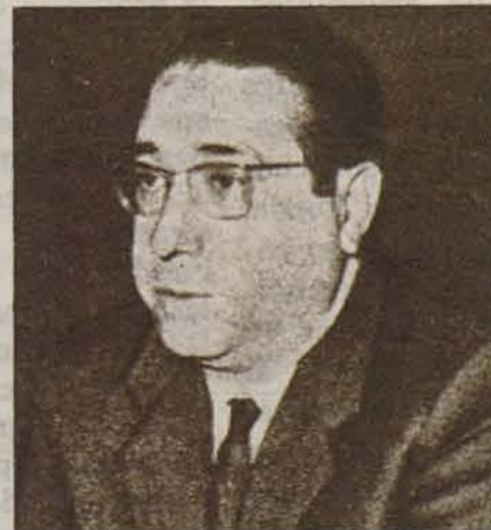
Educación y Ciencia; don José Luis Villar Palasí.

DE LOS NUEVOS MINISTROS, CINCO SON MILITARES; CUATRO, INGENIEROS; OCHO, ABOGADOS; UNO, ECONOMISTA