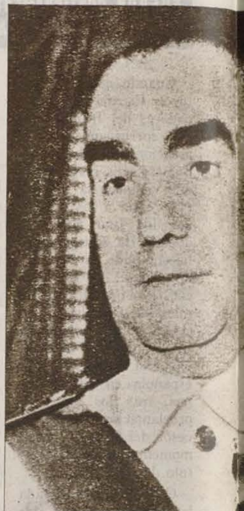
Vicepresidente del Gobierno; almirante don Adolfo Suárez.

Estos son los hombres que integran el nuevo Gabinete de España. En la reorganización ministerial de sus Departamentos los ministros de Asuntos Exteriores, Justicia, Trabajo, Hacienda, Agricultura, Industria y Comercio, Educación y Ciencia y Planificación Económica.