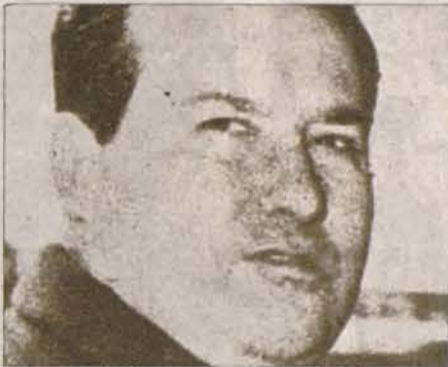
Información y Turismo; don Alfredo Sánchez Bella. Periodista y doctor en Derecho y Filosofía. Era embajador en Roma.