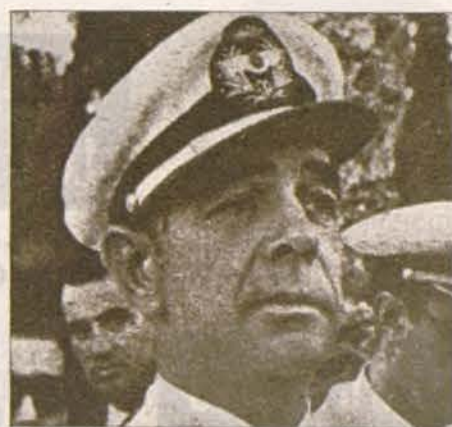
Aire; general don Julio Salvador Díaz-Benjumea. Formó parte del grupo de caza del legendario García Morato.