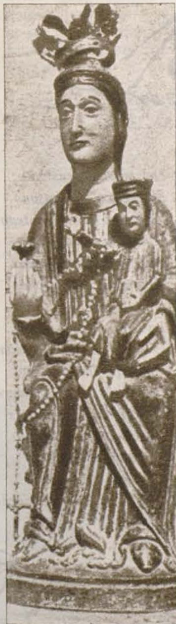
Virgen románica del siglo XII, descubierta por un grupo de un pueblo leonés.

El trofeo de oro ha correspondido al grupo oscense de Curbe, y otros trofeos de plata fueron asignados a otros tantos grupos más destacados.