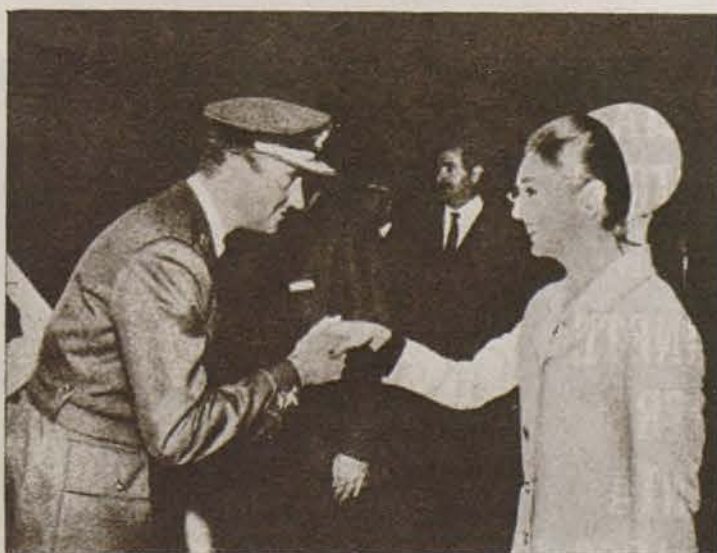
El Príncipe de España saluda a la hermana política del sha, la princesa Manizieh.

Esa misma noche el embajador de España ofreció una recepción, seguida de cena de gala, con lo cual se ponía punto final a los actos organizados en honor de los Príncipes españoles en este primer viaje oficial.