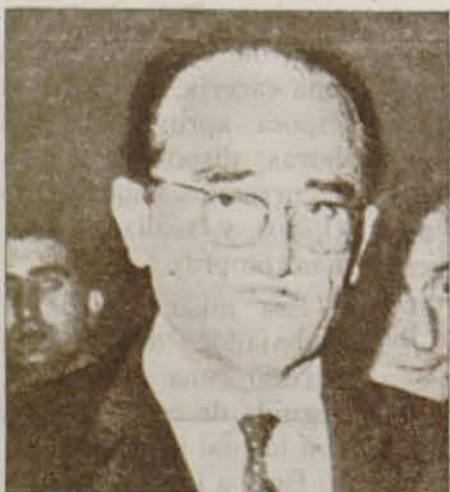
Justicia; don Antonio María de Oriol y Urquijo.

LA MAYORIA DE LOS MINISTROS DEL NUEVO GABINETE ESTAN ENTRE LOS CUARENTA Y CINCUENTA AÑOS