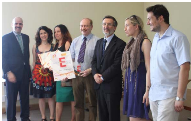
El director del ZSO n° 4 "Józef Tischner" de Poznań, la coordinadora de español y tres profesores de la SB posan junto al Embajador de España y Consejero de Educación

El jurado ha valorado la calidad del dossier presentado por el ZSO n° 4 "Józef Tischner" de Poznań, con Sección Bilingüe de español, tanto en las etapas educativas de Educación Secundaria como en Bachillerato.