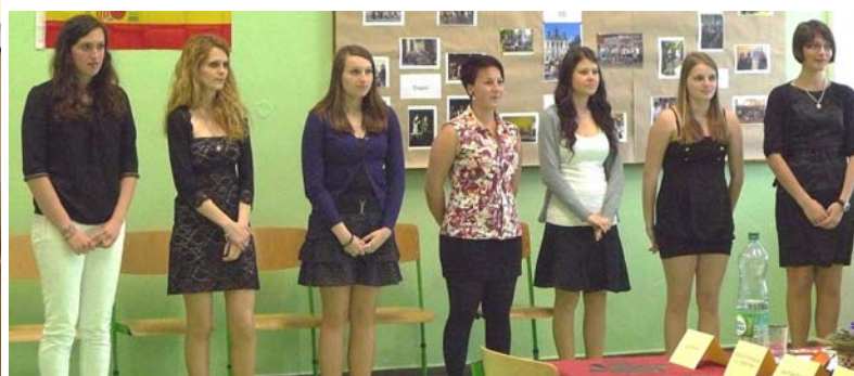
Examen de maturita de la Sección Bilingüe del Gymnázium Budějovická de Praga y alumnas de la primera promoción de la Sección Bilingüe del Gymnázium Lud'ka Pika de Pilsen esperando los resultados de sus exámenes