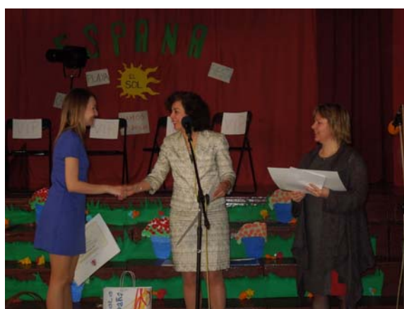
Recogida de títulos de bachiller en la SB de Łódź