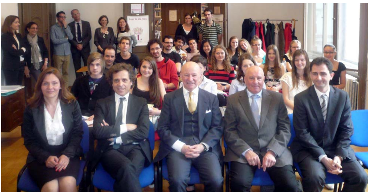
Imagen de las autoridades presentes en el acto