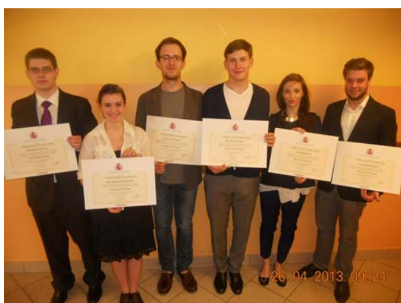
Alumnos de la SB que terminaron sus estudios en 2012 en el Liceo Miguel de Cervantes de Varsovia recogen su título de bachiller

Agradecemos especialmente el esfuerzo extra realizado por los estudiantes que se han presentado además a las pruebas para la obtención del título de bachillerato español.