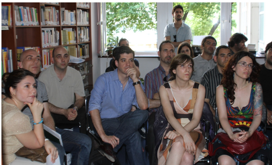
Imagen de profesores de SSBB en la reunión de profesores, previa a la reunión de grupos de trabajo.

Los grupos de trabajo están formados por miembros del profesorado español de las secciones bilingües de español en Polonia.