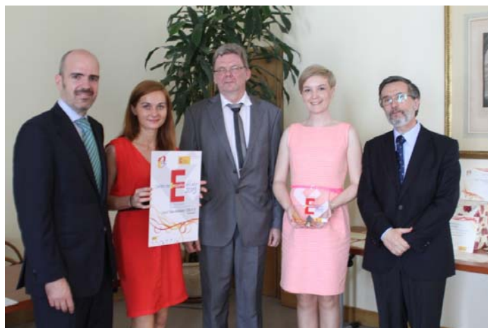
El director del Liceo II "Adam Mickiewicz" de Racibórz y sus dos profesoras de español posan junto al Embajador de España y Consejero de Educación

El jurado ha valorado la implantación del español en el Liceo II de Racibórz en 2004, siendo actualmente segunda lengua extranjera. La dirección del centro y la Concejalía de educación del ayuntamiento de la ciudad están implicadas en el apoyo a la enseñanza de español en el centro, a lo que hay que añadir la entusiasta dedicación y compromiso del profesorado de español del centro. El liceo cuenta con un proyecto dedicado al perfeccionamiento de habilidades comunicativas en español con fondos de la Unión Europea, proyecto que se ampliará a más alumnos el próximo curso escolar.