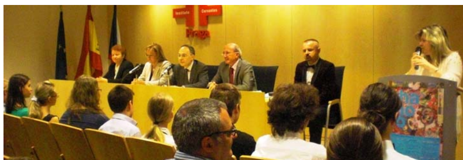
Entrega de certificados de maturita de la Sección Bilingüe de Praga en el Instituto Cervantes, bajo la presidencia del Sr. Embajador