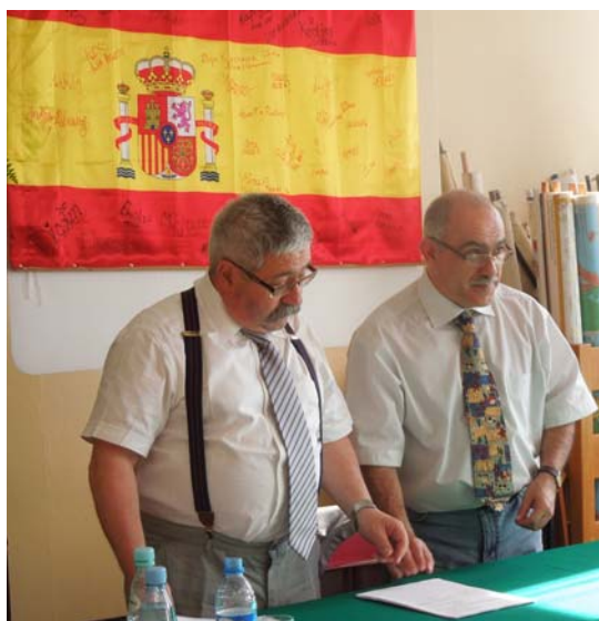
Imágenes de las pruebas orales a nivel bilingüe de los alumnos de la Sección bilingüe de español en el Liceo IX de Lublin