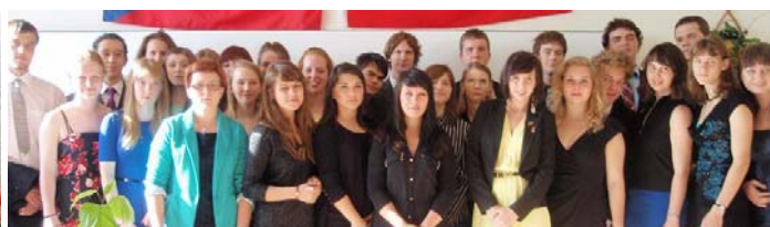
Promoción 2013 de las secciones bilingües de České Budějovice y Brno