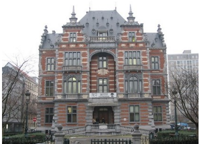
Haute École Francisco Ferrer

Por lo que respecta a mi función, suelo estar de observadora que resuelve dudas y en ocasiones aporta juegos y actividades cortas para reforzar los conocimientos proporcionados por el manual. Siempre que es posible, y para escapar un poco de la rutina del manual, intento presentar aspectos de la cultura española y crear debates a partir de noticias, vídeos o artículos relacionados con la actualidad o con los estudios de los alumnos. Además, también animo mesas de conversación, en las que cualquier persona puede participar siempre que cuente con un nivel A2. Es una actividad que me gusta mucho, ya que las conversaciones suelen ser muy interesantes. Los participantes suelen ser adultos con muchas cosas que contar.