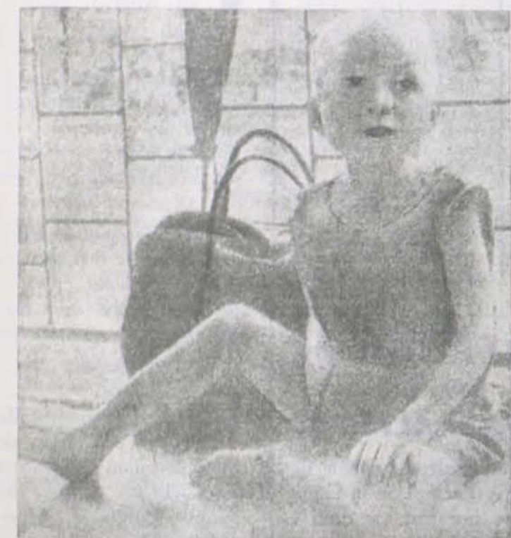
La espantosa guerra de Biafra causa estragos, especialmente entre la infancia, huérfana y hambrienta.

CRONICAS Y REPORTAJES EXCLUSIVOS PARA ALBA