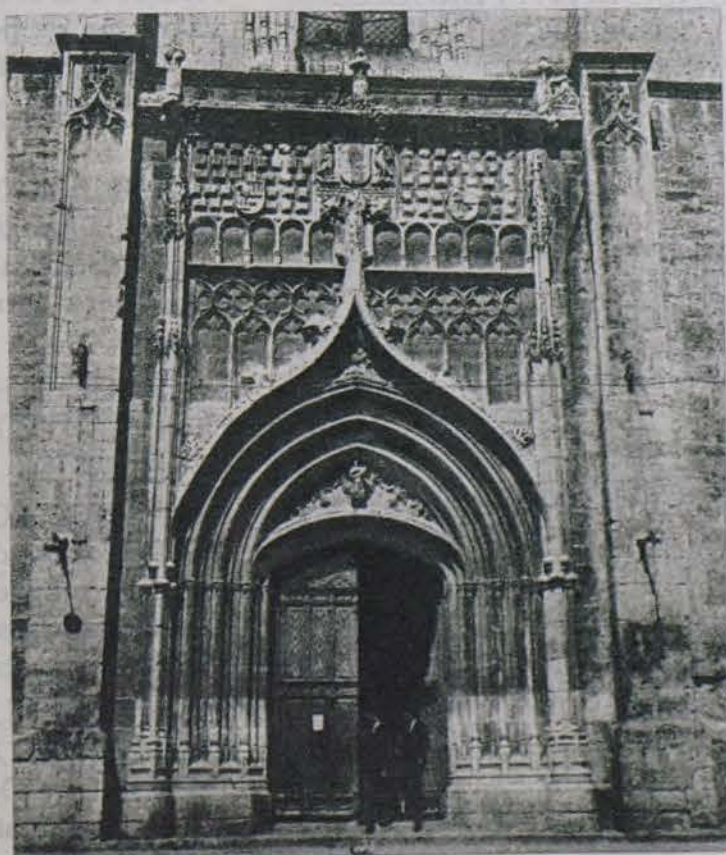
Portada de la iglesia de Santa María de Mediavilla.

Toda Medina de Rioseco es una obra de arte que encaja perfectamente en el marco extraordinario de Castilla.