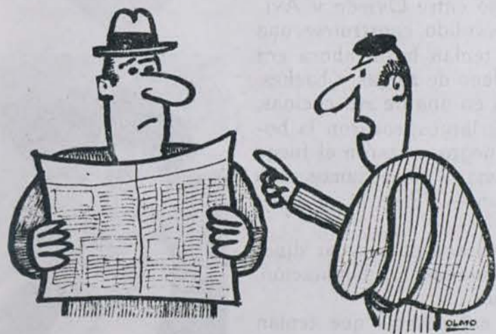
—Pues yo creo que el combate de revancha se debía celebrar entre Legrá y el árbitro.

Elche - Pontevedra, Valencia - Córdoba, Sabadell - Granada, Zaragoza - Atlético de Bilbao, Coruña - Las Palmas, Real Sociedad - Barcelona y Español - Málaga.