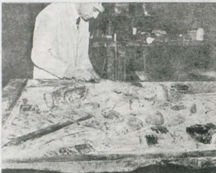
Los restauradores, como los médicos, llevan bata blanca, inyectan en sus pacientes y observan todas sus futuras reacciones.

Las piedras de los museos, las piedras de las catedrales y los antiguos arcos de triunfo, los cuadros de los conventos y de las colecciones particulares precisan del cuidado de los restauradores, verdaderos médicos que atajan las enfermedades más raras y destructivas. Porque las piedras y los cuadros, aunque parezca extraño, también son sensibles y