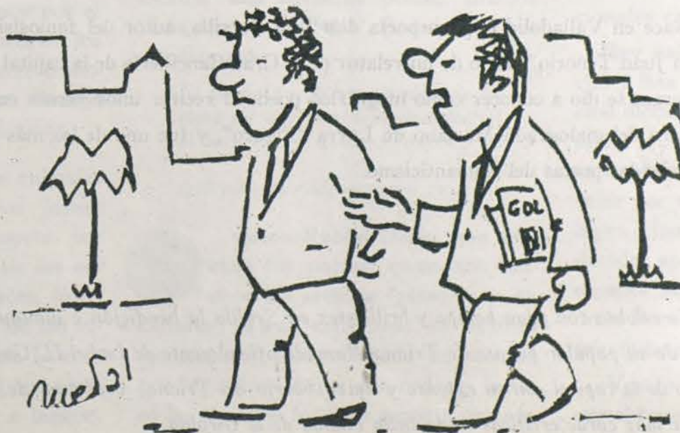
—Los alemanes, siempre igual. En vez de importar futbolistas, nos piden sesenta mil trabajadores.