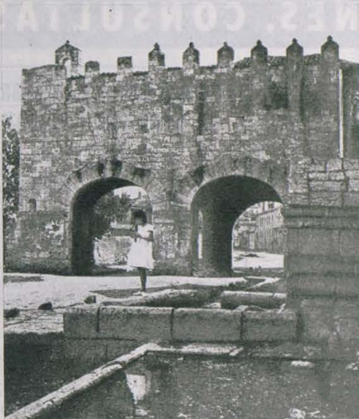
Puerta de San Sebastián.

La grandiosidad de sus templos y la majestuosidad de las ruinas de