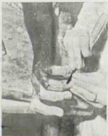
Con el bisturí, las manos tienen que ser sensibles y disciplinadas.

Las obras de arte también mueren, también pueden morir si se las deja en olvido. Muchas obras de la antigüedad están totalmente desaparecidas y de otras sólo quedan unos restos pobres, lastimosos. Para remediar estos males del mundo del arte funciona desde hace seis años el Instituto Central de Restauración y Conservación de Obras de Arte, Arqueología y Etnología, instalado en el Casón del Buen Retiro, de Madrid.