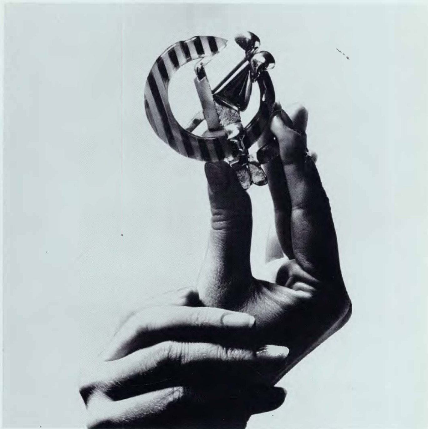
FONT Broche de plata y metacrilato. 7,00×6,00 cm.