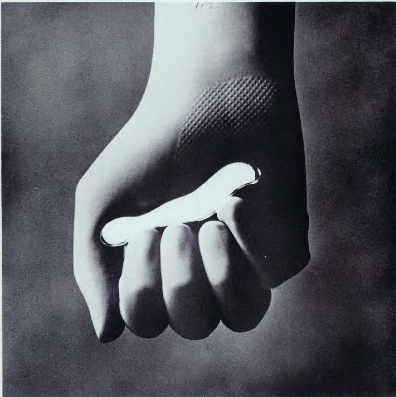
GUASCH Objeto de plata pulida y ébano. 9,50 x 2,00 x 0,60 cm.