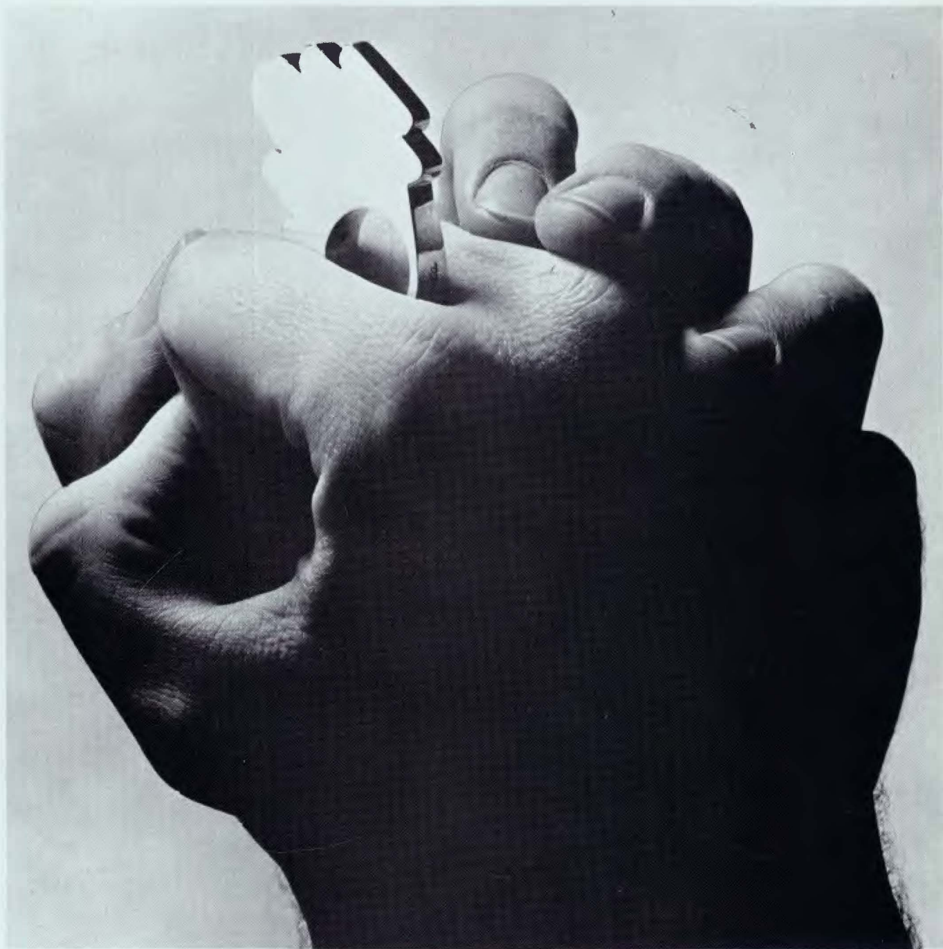
GUARDIOLA Anillo de plata pulida 5,00 x 3,50 cm.