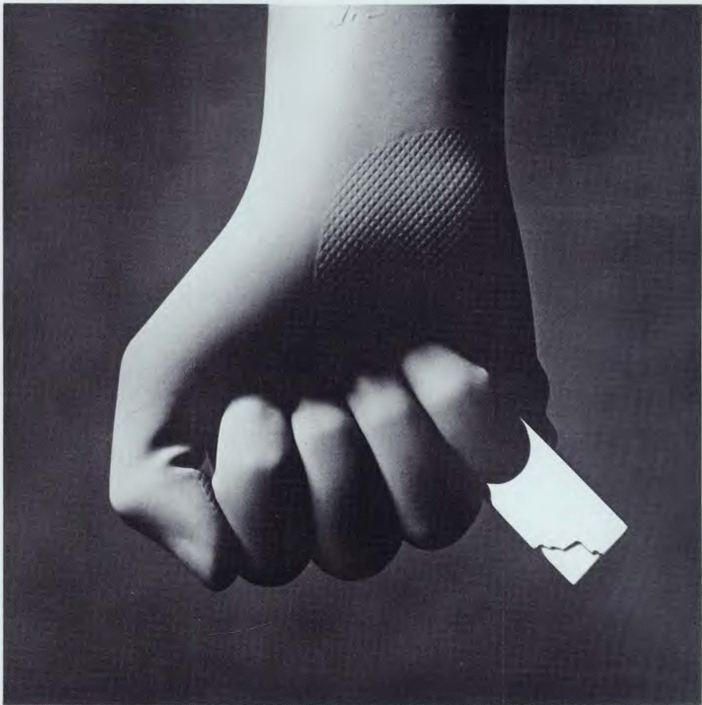
GUASCH Anillo de plata pulida y marfil. 4,70×2,00×0,50 cm.