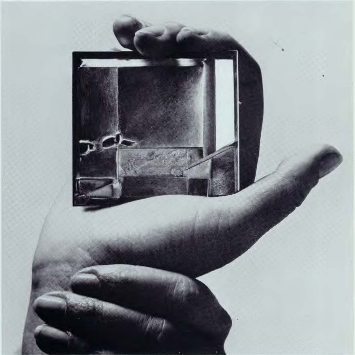
FONT Broche de plata mate y pulido. 7,50×6,00 cm.