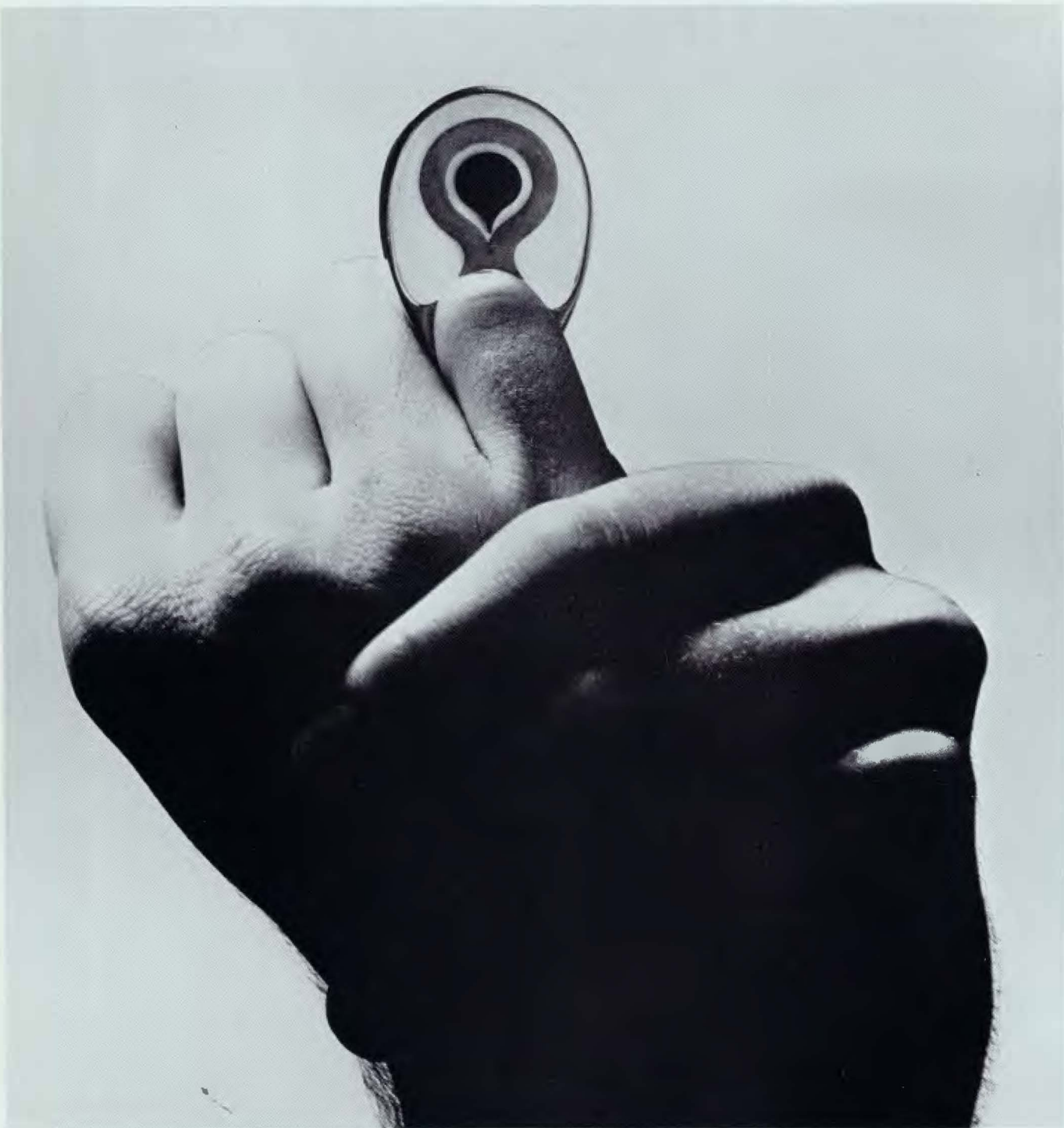
GUARDIOLA Anillo de plata y metacrilato. 5,30×3,70 cm.