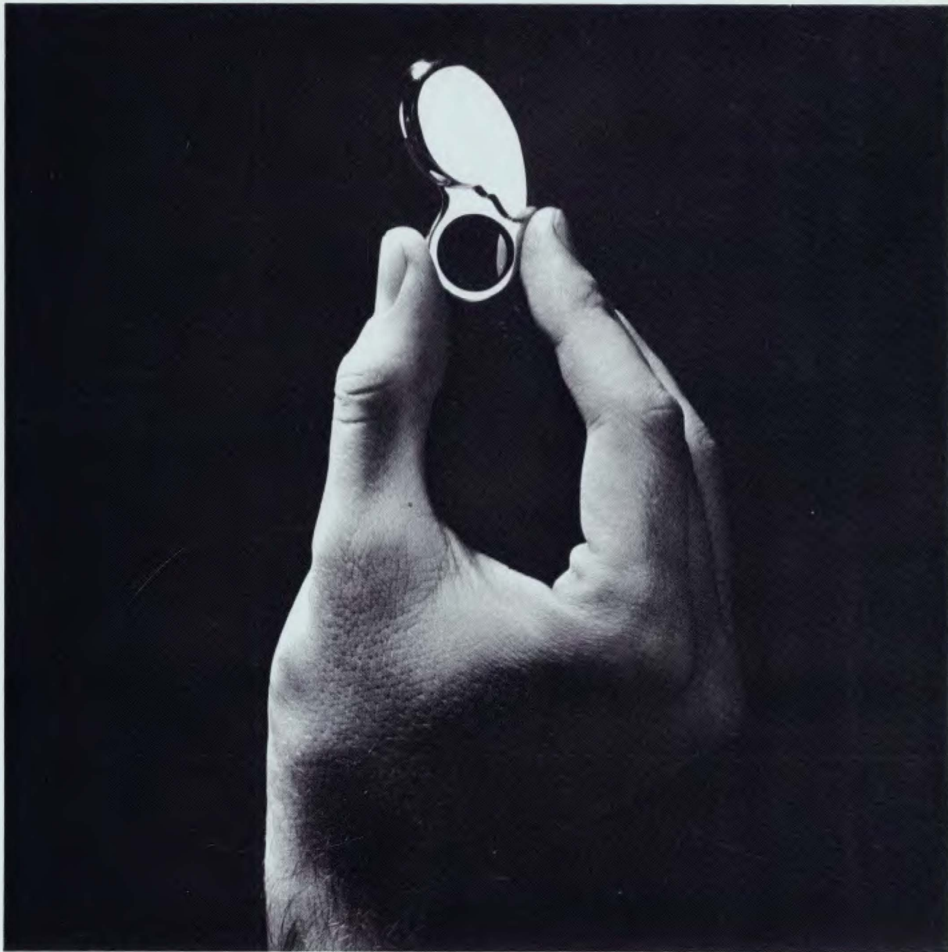
GUARDIOLA Anillo de plata pulida. 5,00 x 2,80 cm.