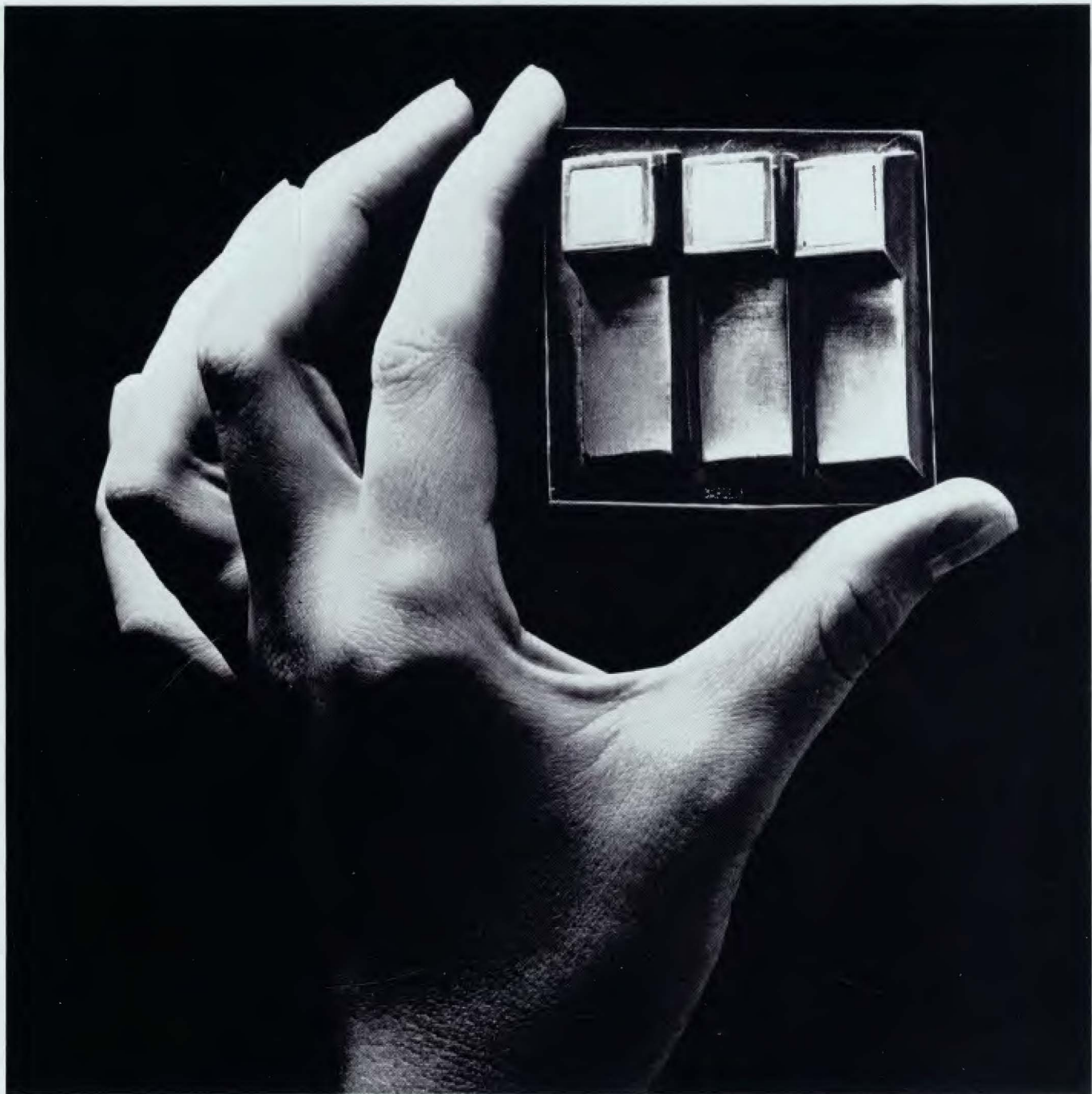
CAPDEVILA Broche de plata oxidada y marfil. 5,50×5,50×2,00 cm.