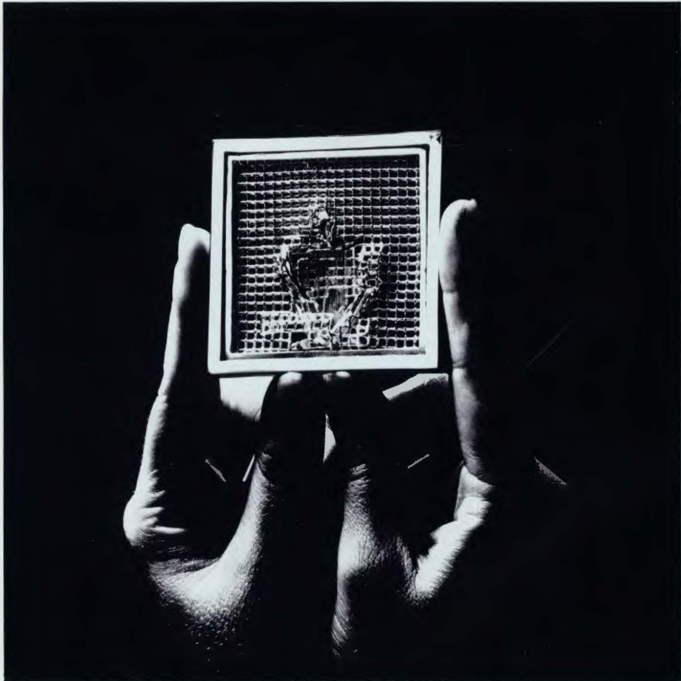
FONT Broche de plata. Bisel dorado. 6,00×6,00 cm.