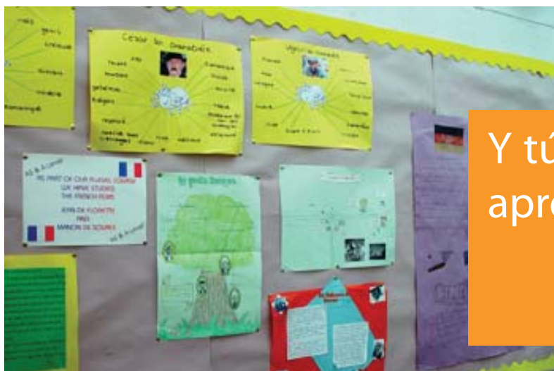
Exposición de trabajos de idiomas. © Foto imágenes y sonidos del Ministerio de Educación, Cultura y Deportes de España.

AUTOR: José Joaquín Moreno Artesero Asesor técnico de la Consejería de Educación en Reino Unido e Irlanda