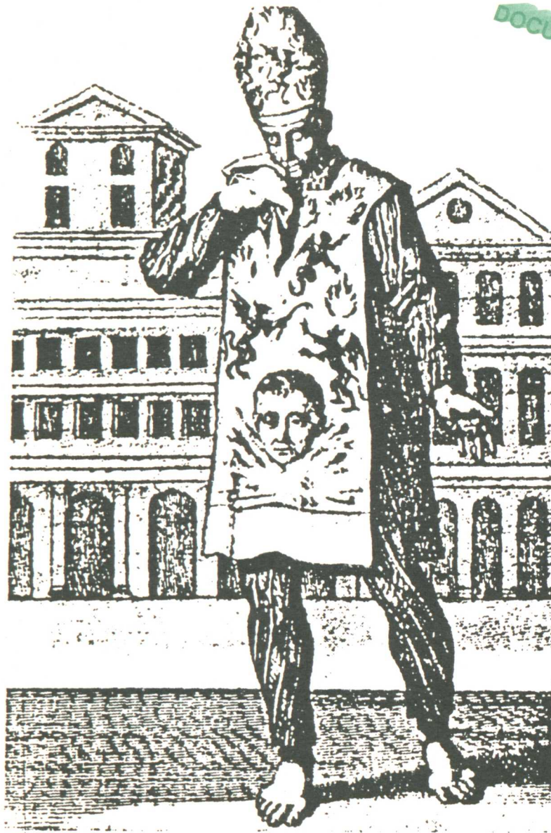
Penitente con sambenito y corozza