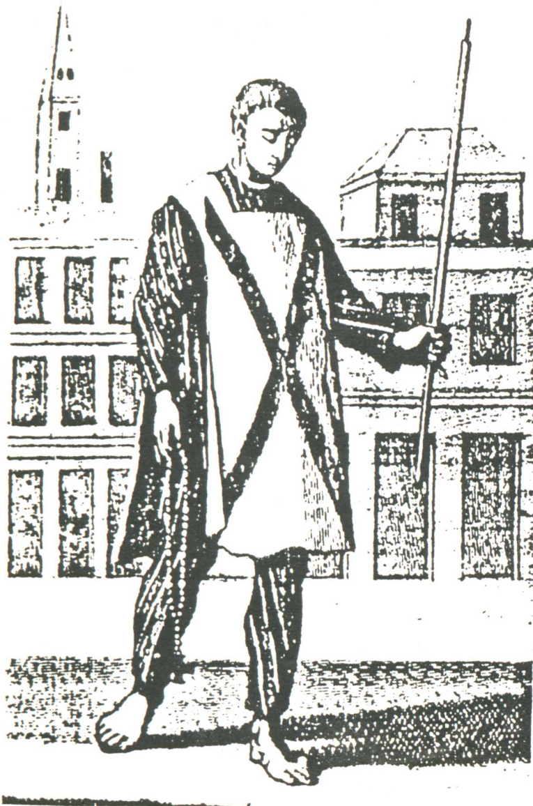
Penitente con sambenito