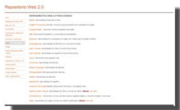
Repositorio Web 2.0