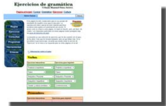
Ejercicios de gramática