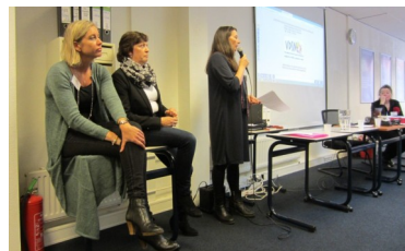
EQUIPO DIRECTIVO VDSN

La jornada contó con 7 diferentes talleres didácticos.