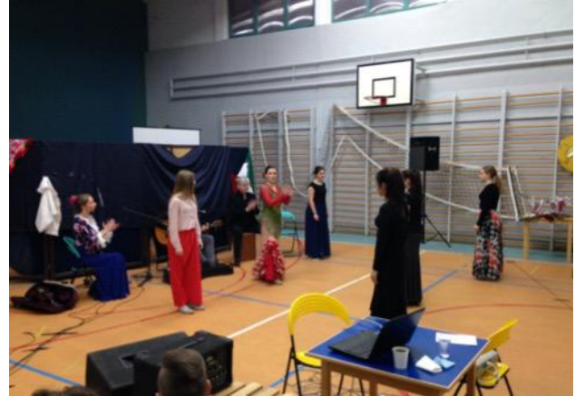
Algunas imágenes de los actos celebrados en esta inolvidable jornada