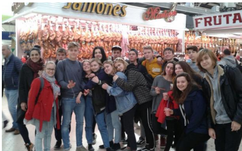
Arriba, en la Lonja de la Seda de Valencia, Patrimonio de la Humanidad. Abajo, en el Mercado Central de Valencia.