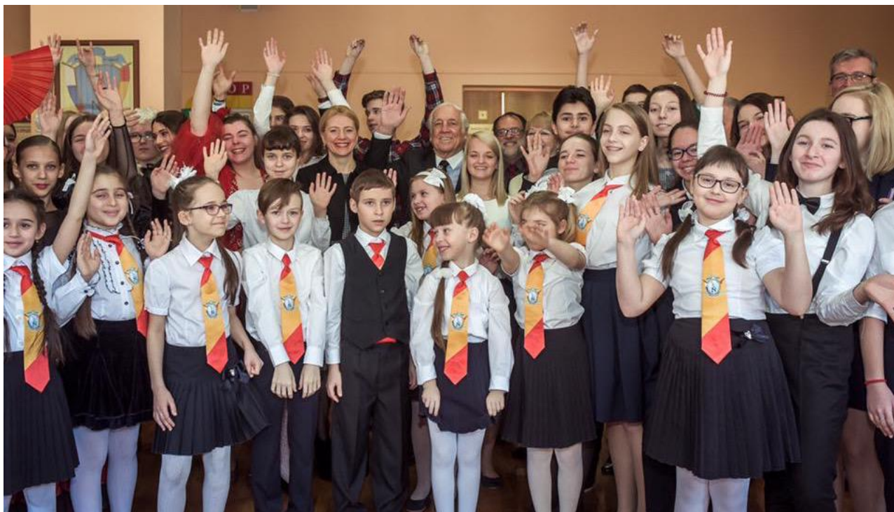
Delegación de Marca España junto con alumnos del centro.