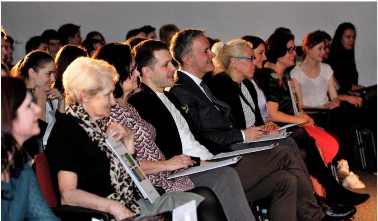
Imágenes de algunas representaciones y de la entrega de premios. Abajo: Los miembros del jurado de COOLturiada' 2017 durante las actuaciones.