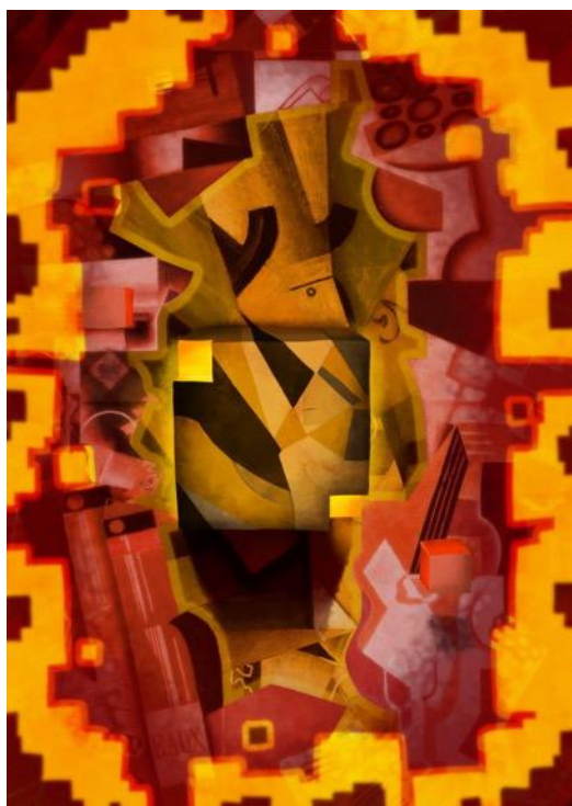
1º premio “Cuadros, cubos y cuadros de un cubista” de Eliška Vičinská