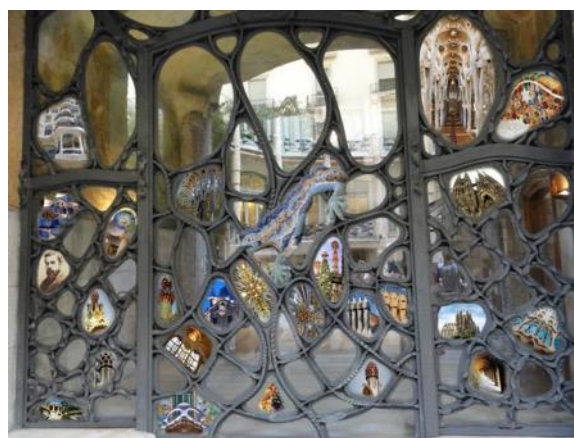
2º premio “El Mago Antonio Gaudí” de Piotr Wierzchowski