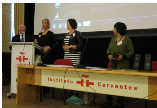
El Consejero y el equipo directivo de la asociación