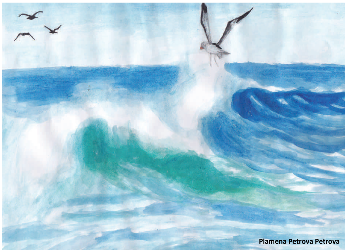
Plamena Petrova Petrova