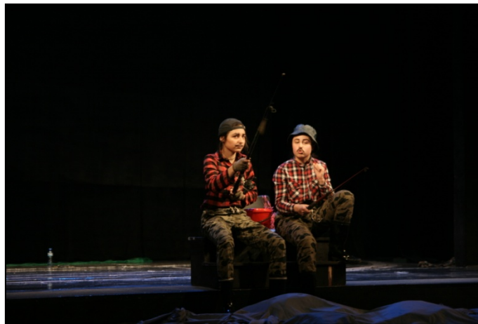
Imagen del estreno.