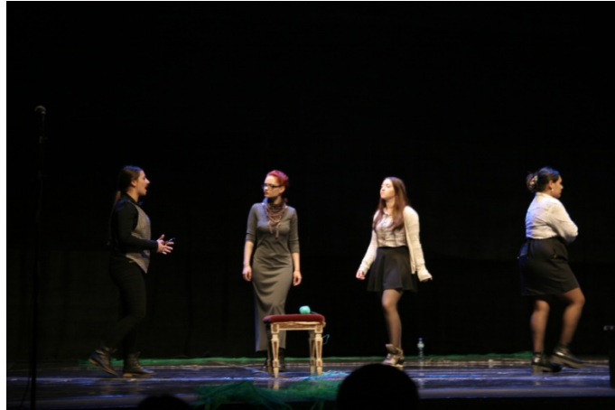
Imagen del estreno.