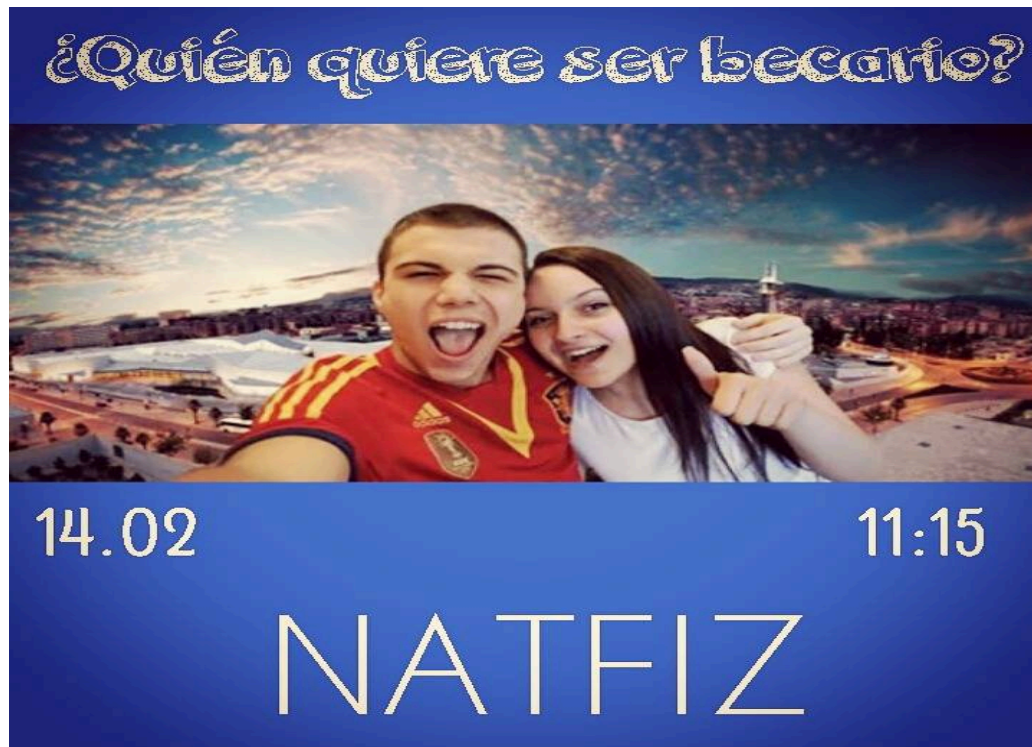
FOTO DE PORTADA O PROGRAMA

La Consejería de Educación, ha organizado el concurso 10 preguntas que darán a nuestro valiente concursante la posibilidad de pasar un año estudiando en Granada con todos los gastos pagados. ¿Sabrá Misho todas las respuestas? ¿Podrán ayudarle sus recuerdos? ¿Será todo un sueño?