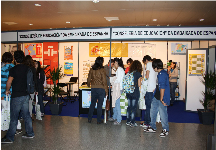
Stand de la Consejería de Educación en Expolingua