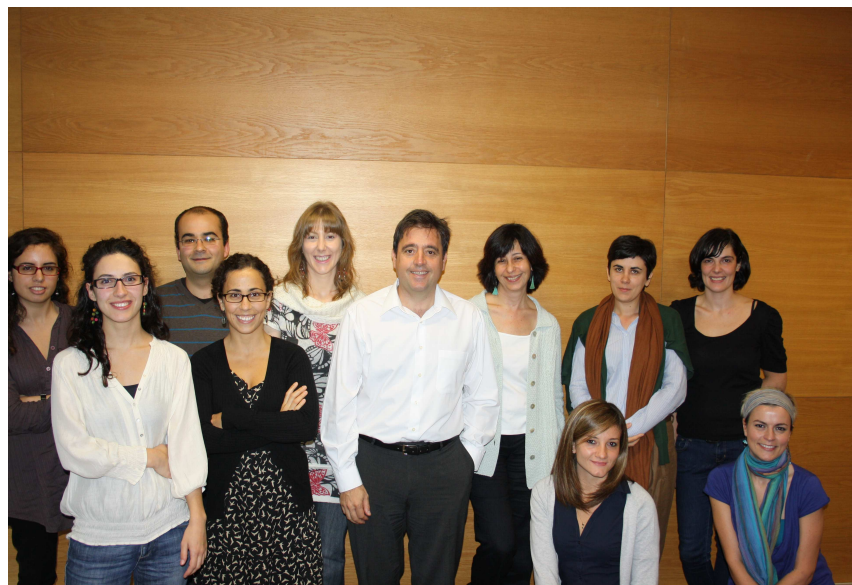
Lectores El Corte Inglés y AECID junto con los Asesores de la Consejería