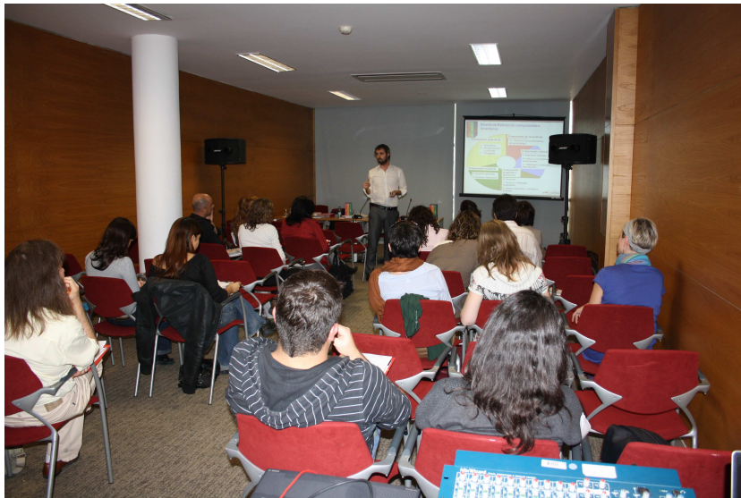
Seminario de formación para profesores de español