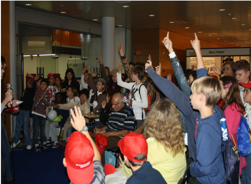
Mini aula de español

Un año más, la Consejería de Educación participó los días 3, 4 y 5 de noviembre de 2010 en la feria Expolingua que tuvo lugar en el Centro de Congresos de Lisboa.