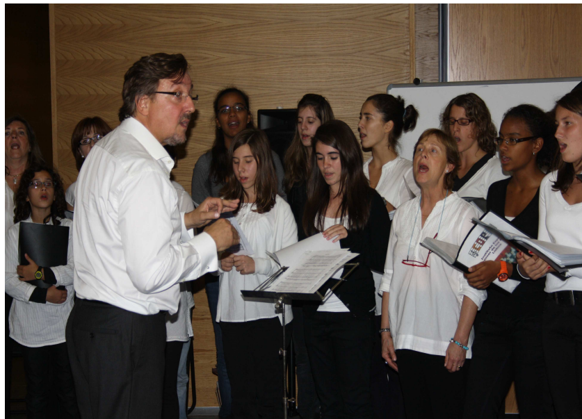
Coro del Instituto Español Giner de los Ríos de Lisboa