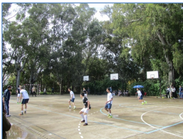
Jornada final en el IEES “Severo Ochoa” de Tánger.

La jornada final intercentros cierra el ciclo de pruebas y competiciones previas realizadas durante el curso escolar en los centros de titularidad española. Estas jornadas suponen un lugar de encuentro e intercambio educativo en el ámbito deportivo, con objeto de favorecer la convivencia y la educación en valores.