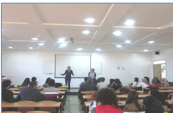
Jornada ELE en la ENCG de Kenitra

La jornada ELE en la Escuela Nacional de Comercio y Gestión de Kenitra se desarrolló el 27 de noviembre de 2017. La actividad contó con una gran implicación del alumnado de 5º año de carrera, que realizó presentaciones orales sobre diferentes aspectos de la cultura de España.