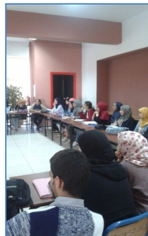
Campus Aït Melloul

La actividad se presentó el 22 de marzo y consistió en talleres que favorecieron la participación de los alumnos y el uso de la lengua española: “España a través de sus cafés” y “Taller de juegos ELE”.