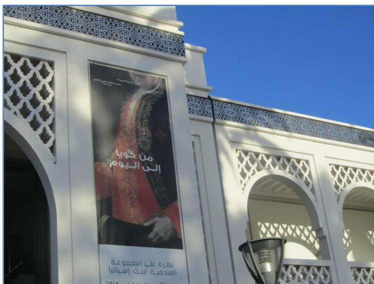
Fachada lateral del Museo Mohammed VI en Rabat.

Los alumnos y alumnas de los centros educativos españoles en Marruecos han visitado en días sucesivos el Museo Mohammed VI de Rabat, en el marco de la exposición “De Goya a nuestros días. Miradas sobre la Colección Banco de España” realizada bajo el alto patrocinio de Su