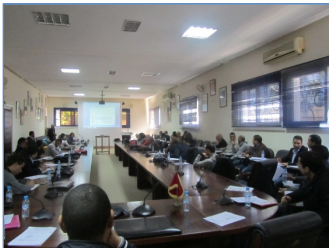
AREF de Agadir

Las jornadas ELE en el AREF de Agadir tuvieron lugar los días 22 y 23 de marzo de 2018. El equipo de asesoras técnicas ofreció las ponencias “Enseñar ELE a través de la pintura”, “ Don Quijote de la Mancha : la aventura de las palabras”, “Taller de comprensión y expresión escrita: cuentos tradicionales”; “Propuestas didácticas para el tratamiento del componente sociocultural en la enseñanza ELE”,