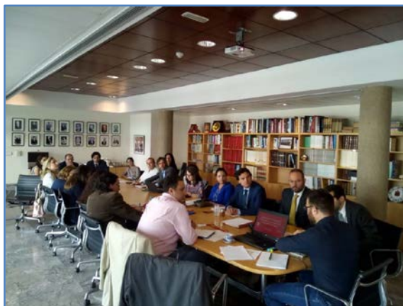
Desarrollo del taller MAP en la Embajada de España

El objetivo es dar mayor visibilidad y capitalización al trabajo realizado por los sectores españoles en materia de cooperación desde la última firma del documento en el 2014.