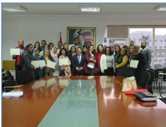
Universidad Mohammed V de Rabat

El equipo asesor de la Consejería impartió estas sesiones con un enfoque comunicativo y dando prioridad a las competencias orales.