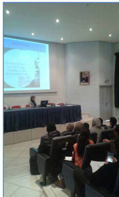
Jornada ELE en la Universidad de Casablanca