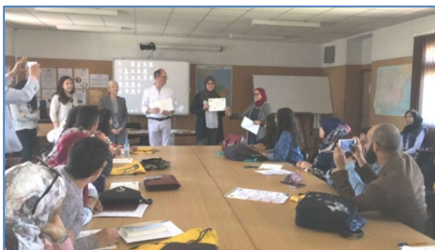
CERE de la Universidad de Agadir

Este año la Jornada ELE en la Facultad de Letras y Ciencias Humanas de la Universidad Ibn Zohr de Agadir ha tenido lugar el 22 de marzo de 2018, desarrollándose como en otras ocasiones en el espacio del CERE.