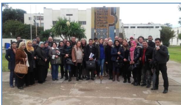
AREF de Casablanca

Los días 15 y 16 de diciembre de 2017 la Consejería de Educación presentó en el AREF de Casablanca las ponencias-talleres con propuestas variadas para la enseñanza ELE: uso de la pintura, la introducción del componente cultural, el uso del Quijote y, por último, el Community manager educativo.