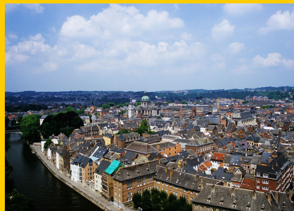
Panorámica de la ciudad de Namur