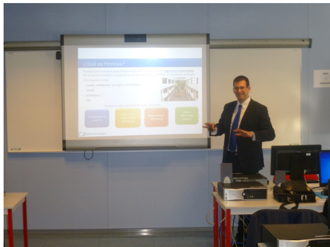
Galería de imágenes de la jornada celebrada el pasado 17 de marzo en la Haute École de Charleroi

"Diseñando secuencias didácticas de ELE para el mundo empresarial"