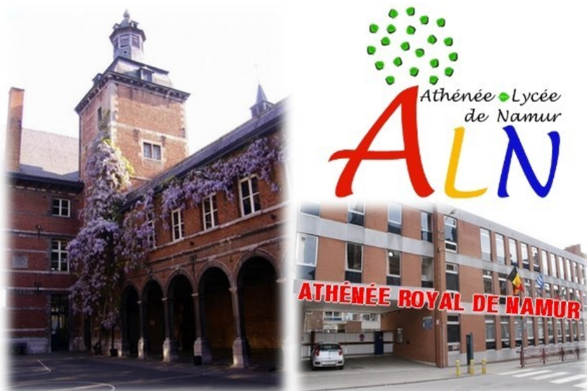
Athénée Royal Namur François Bovesse (Namur, Bélgica). Página web: http://alnamur.be/

También ayudo a los estudiantes en la realización de los ejercicios escritos y apporto nociones culturales sobre España y sobre Galicia.