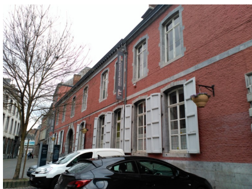
Athénée Royal Namur François Bovesse

Durante el presente curso académico estoy destinada como auxiliar de conversación en la localidad de Namur.