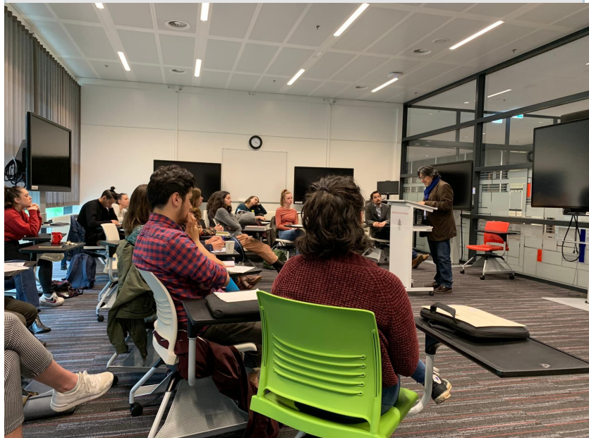
El escritor Fernando Iwasaki