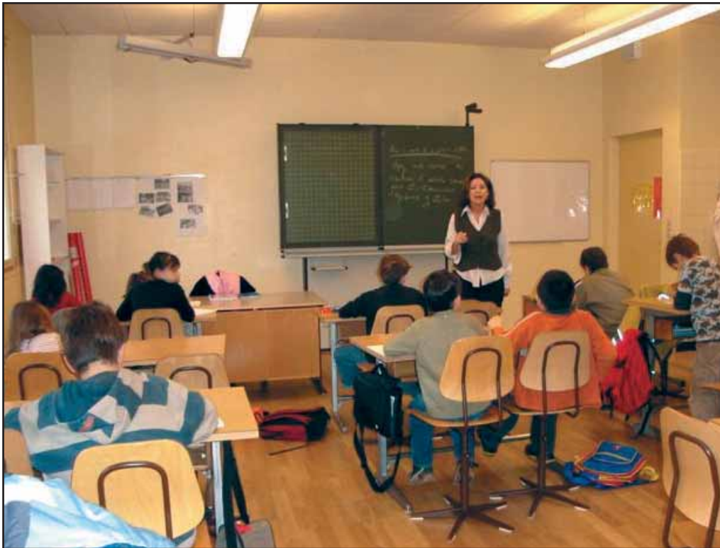
Aula de Lengua y Cultura Españolas de la Agrupación de Lausana (Morges).