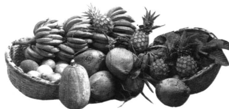
Figura 3. Frutos tropicales.

Tardaría mucho esta rama de la agricultura en transformarse en una explotación especializada y, como consecuencia de la proximidad del mercado habanero y del puerto de embarque a Estados Unidos, este hecho se producirá a fines del siglo en la región occidental 8 (fig.3).