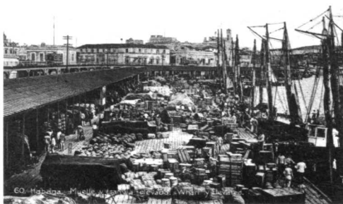
Figura 5. Laboreo en el Muelle de La Habana.

79 pesos (dólares) per cápita 19 y tan solo con los víveres, incluyendo vinos y licores, en los años 1827-1846 en Cuba se registra el 41,6% del valor de los artículos importados 20 ; seguido de las manufacturas, que comprendían especialmente los tejidos, con el 28% (fig 5).