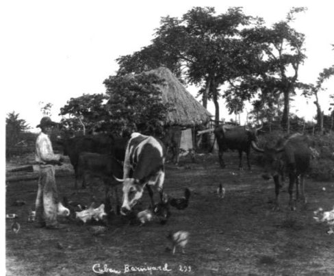
Figura 4. Escena de la vida campesina.

Respecto al ganado ovino y caprino el censo de 1827 recoge la cifra conjunta de 46.000 cabezas y el de 1862 las de 78.900. Crianzas que en estos años aumentan en un 171,5%. En 1862 la proporción de cabezas de oveja y cabra por habitante fue de 0.04 y 0.02 respectivamente 13 . Por evidentes razones climáticas en Cuba no se desarrolla el ganado ovino en gran extensión y a pesar de los intentos por establecerse la producción de lana sólo se logra la utilidad de su carne. Lo mismo que sucedió con el ganado cabrío aún cuando fue la cría por excelencia de la población rural de origen canario, de la que se le decía a la cabra isleña la vaca de los campesinos pobres (fg.4).