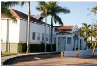
Escuela Key Biscayne K-8 Center recientemente incorporada a la Sección española de Miami.

La Sección española del Programa de Estudios Internacionales de Miami fue creada en virtud del acuerdo de cooperación internacional entre el Ministerio de Educación y Ciencia de España (MEC) y el Distrito escolar del condado de Miami-Dade (MDCPS). Desde el curso escolar 1986-1987 miles de estudiantes del área de Miami se han beneficiado de este programa, que ofrece la posibilidad de recibir contenidos del currículo oficial de España en el contexto de experiencias educativas interculturales y bilingües. Tras 21 años desde su puesta en marcha, la Sección española del PEI se ha consolidado como un programa de excelencia académica, atendiendo la creciente demanda de educación bilingüe español-inglés en una ciudad tan emblemática como Miami.