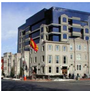
Sede de la Embajada de España en Washington, D.C., en la que se encuentra alojada la Consejería de Educación y Ciencia para Estados Unidos y Canadá.