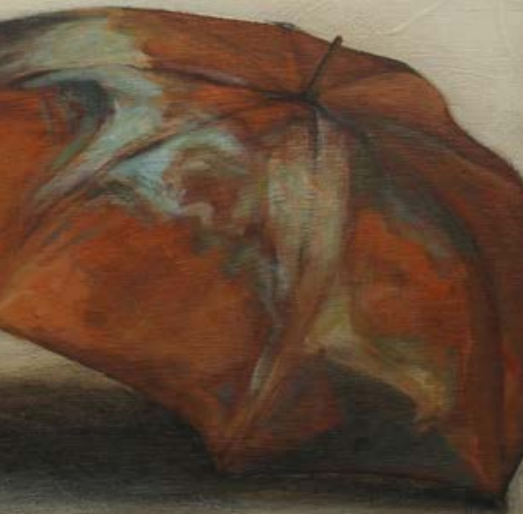
Quedarán en la memoria (2012). José Ibarrolaren margoa.