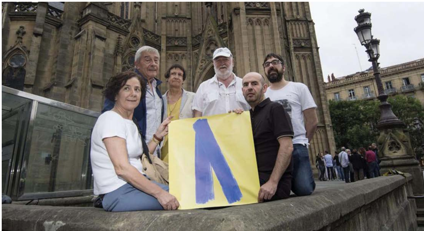
Erreportajearen irudia Lazo urdina piztu zuen bahiketa