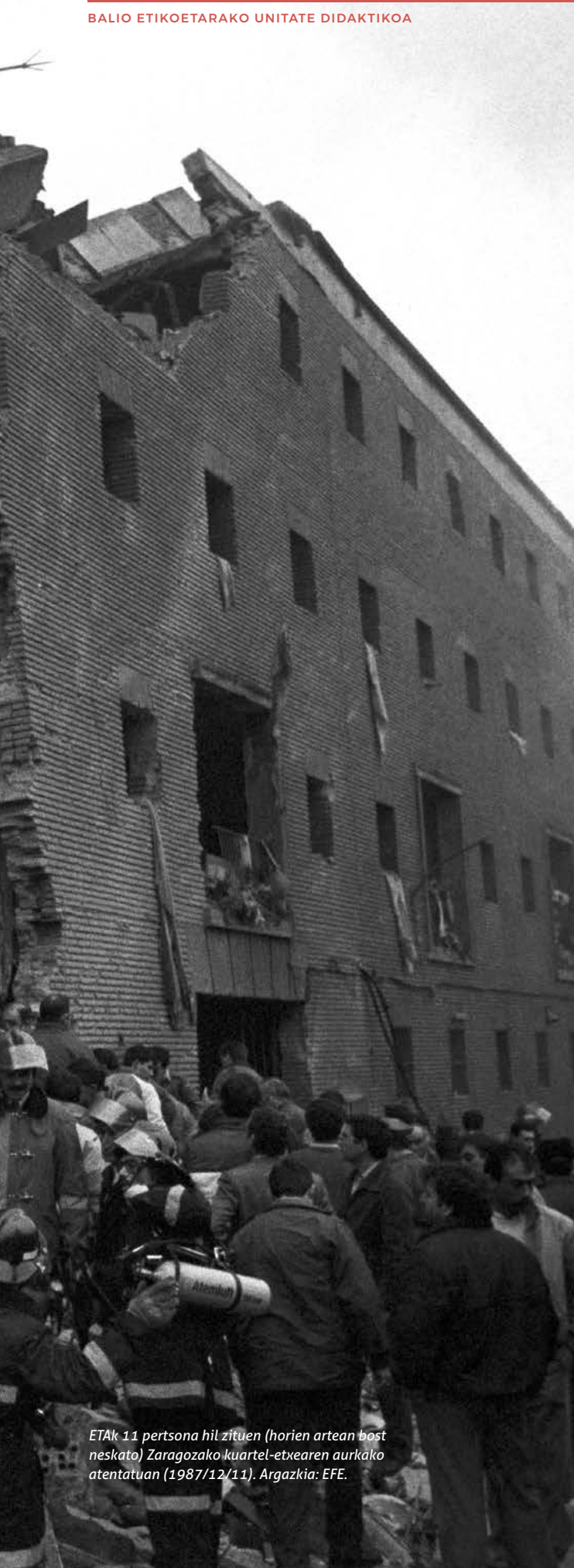
ETAk 11 pertsona hil zituen (horien artean bost neskatu) Zaragozako kuartel-etxearen aurkako atentatuan (1987/12/11).