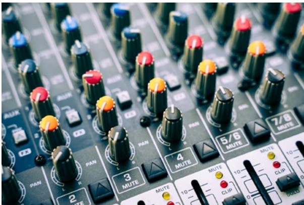
Ilustración 1. Hoy en día podemos realizar un programa de radio escolar con muy buenos resultados sin precisar medios especiales, como una mesa de mezclas de audio.

Esta propuesta es simple y colaborativa. Los alumnos podrían crear un pódcast sobre alguno de los dos libros que hemos comentado aquí, o incluso añadir alguna otra obra de ciencia ficción que consideren importante y sobre la que quieran trabajar. Asimismo, podrían enviarlo a los organizadores del proyecto para que lo escuchásemos y les diésemos nuestra opinión. En vez de recurrir al clásico trabajo individual por escrito, esta propuesta pretende aprovechar su conocimiento natural de las tecnologías y poner en valor el aprendizaje colaborativo y la búsqueda activa de información, que son dos herramientas pedagógicas fundamentales. Además, el trabajo colaborativo les obliga a trabajar estrechamente con personas diversas que provienen de entornos sociofamiliares muy diferentes y que tienen necesidades específicas. Es una labor inclusiva. El objetivo final es que se impliquen y sean capaces no solo de buscar información, sino de filtrarla debidamente y aprender a comunicarla a un público oralmente. El formato pódcast ofrece como ventaja que, al ser una grabación, se puede escuchar más de una vez, a diferencia de una exposición oral y, al mismo tiempo, resulta cómodo porque basta una conexión a internet para poder acceder a él.