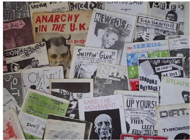
Ilustración 2. Una selección de fanzines británicos de los años 70.

Si es necesario, puedes encontrar las claves para la creación de un pódcast en clase en este recurso del INTEF .