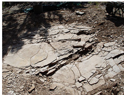
Yacimiento de dinosaurio.

A esta gran variedad de restos paleontológicos existentes en España se han unido últimamente los de un dinosaurio hallado en la provincia de Cuenca. Se trata de un depredador carnívoro, de unos seis metros de longitud y con una curiosa joroba en el lomo, que vivió hace aproximadamente 125 millones de años. Sus restos fósiles, muy bien conservados, fueron descubiertos en 2003 en el yacimiento de Las Hoyas por paleontólogos de la