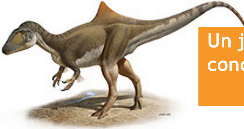
El Concavenator corcovatus .