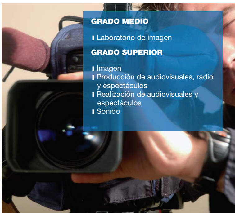
IMAGEN Y SONIDO