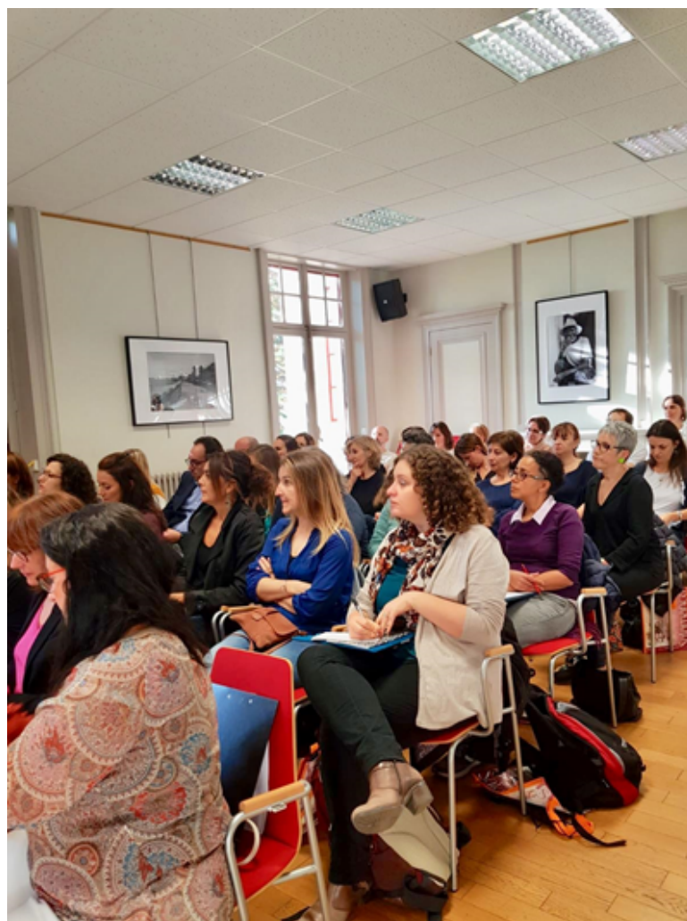
Jornadas de didáctica del español en Lyon. Octubre de 2019.

programa se lleva a cabo tanto en línea como en jornadas presenciales centrándose en las competencias y destrezas lingüísticas, integración de aspectos socioculturales, así como herramientas tecnológicas y metodológicas para la enseñanza de español. En los últimos años se ha incluido en este plan de formación actividades formativas para el profesorado de secciones Bachibac, así como una cita anual de la Universidad de Verano del Español en el mes de julio.