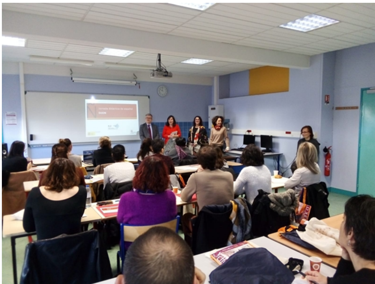
Jornadas de didáctica del español en Dijon. Febrero de 2020.