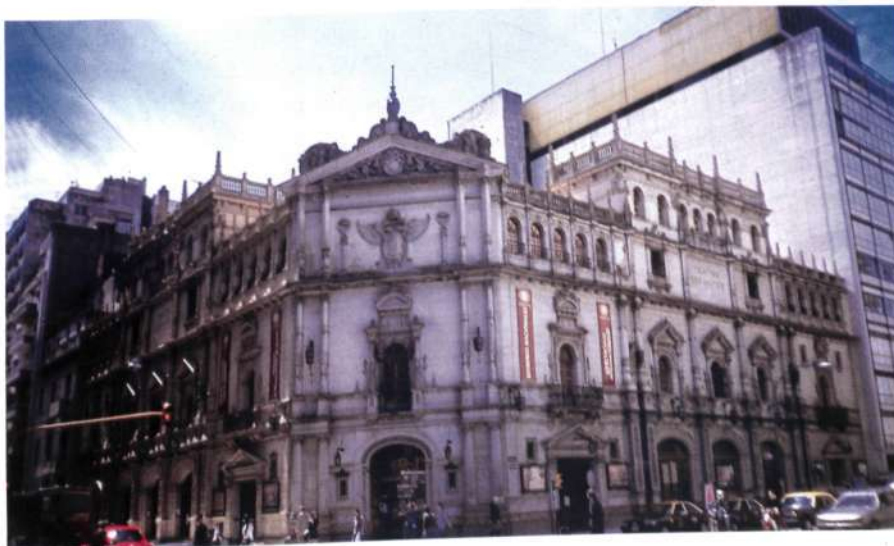
Figura 8: Buenos Aires. Teatro Cervantes.

El Teatro Nacional Cervantes de Buenos Aires (fig. 8) fue proyectado por los arquitectos españoles Bartolomé Repetto y Fernando Aranda Arias (1822-1959), que