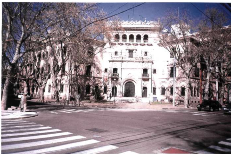
Figura 4: Mendoza. Banco ExHipotecario.