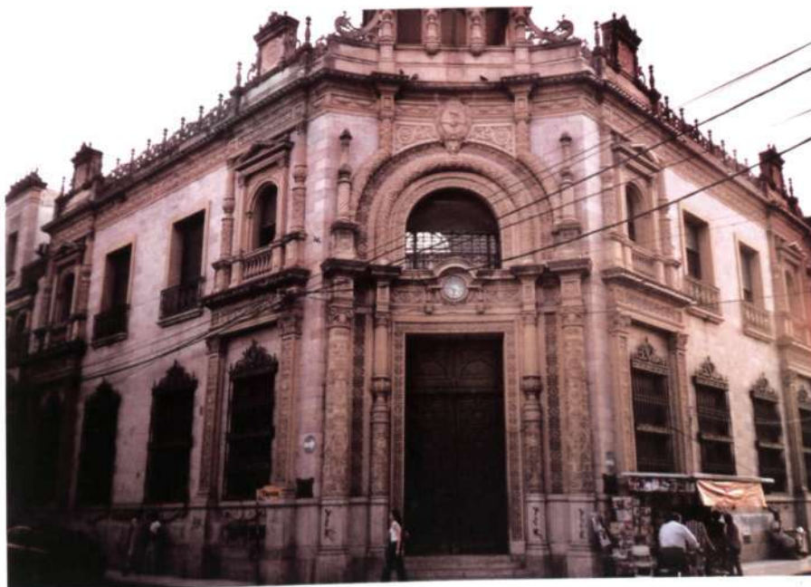
Figura 10. Salta. Banco Nacional.

En Salta se levanta el Banco Hipotecario de la Nación que, construido por Pascuicci entre 1936 y 1940, es uno de los ejemplos más sobresalientes del movimiento de la Restauración Nacionalista (fig. 10). El edificio se alza en esquina y se divide en dos cuerpos, todo ello rematado por una crestería. En él predomina el vano sobre el muro, un total de ocho vanos en cada cuerpo, y los del superior se encuentran simétricamente. La compartimentación y ornamentación es claramente influencia del renacimiento español. Lo característico de este edificio es el diseño de su portada que se levanta en la esquina. Presenta unas grandes similitudes con la del Hospital de Santa Cruz de Toledo en España. Es una portada de dos cuerpos, en el primero se combinan columnas balaustradas con clásicas cuyos fustes se encuentran ornamentados con decoración neoplateresca, y lo curioso es su segundo cuerpo, ya que los fustes de las columnas se doblan y siguen la rosca del arco para enderezarse de nuevo y sostener el entablamento. En el resto de la fachada se combinan balcones con rejas que siguen modelos renacentistas. Esta obra es la que mejor representa el renacimiento español dentro del movimiento de la Restauración Nacionalista.