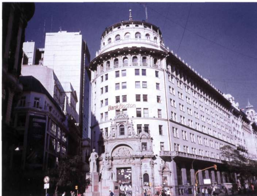
Figura 9: Buenos Aires. Banco Boston.

cursó estudios en la Escuela de Arquitectura de Madrid. Se construyó gracias a la iniciativa de los actores españoles María Guerrero y Fernando Díaz de Mendoza, que fueron los que financiaron la obra. El edificio se erige en una esquina, en ochava, y presenta una fachada que repite el diseño de la fachada de la Universidad de Alcalá de Henares, proyectada por Rodrigo Gil de Hontañón en 1543. Los materiales fueron traídos y diseñados en España. La obra fue inaugurada en 1921 y será en 1961 cuando, a causa de un incendio, se lleve a cabo una reforma en el escenario.