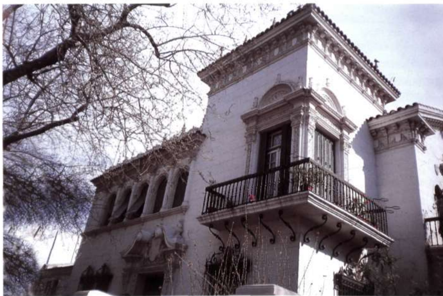
Figura 5: Mendoza. Casa Lamicela.

Otro de los edificios claves es la Casa Lamicela (1928) en la Avenida Emilio Civit, obra del arquitecto Ramos Correas. Se ubica en una esquina, dando una gran importancia a todo el conjunto. Presenta una torre y balcones en esquina que recuerda a los palacios extremeños de Trujillo. El conjunto queda rematado por la típica crestería de clara influencia española (fig. 5).