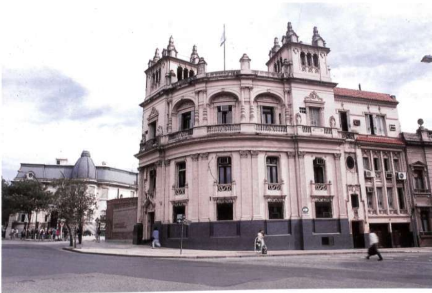
Figura 6: Córdoba. Palacio de Don Luis Pastrone.

En la fachada de este edificio nos encontramos una mezcla de estilos. Por una parte, la portada principal con una decoración neoplateresca en sus pilastras. La misma composición del arco de la portada de ingreso nos recuerda al gótico, ese tipo de arcos apuntados tan característicos. Hay que señalar que, en el segundo cuerpo del edificio, aparecen unas dobles columnas abalaustradas que es un elemento típico español, y será un rejero de la primera mitad del siglo XVI quien las utilice en la rejería española. Como remate de la fachada, tenemos dos torres de planta cuadrada y coronadas en cada uno de sus lados por una especie de pináculos, que recuerdan a los coronamientos del Palacio de Monterrey en Salamanca. Por lo tanto, en este edificio nos encontramos con una mixtura de "Neos" (neogótico, neorrenacimiento y neocolonial).