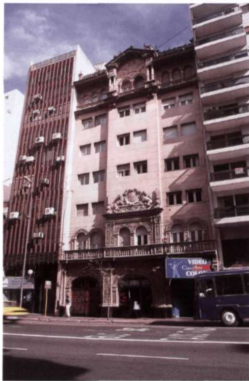
Figura 3: Córdoba. Apartamentos PH

En el primer cuerpo aparece una portada, con tres arcos rebajados y con pilas-tras ornamentadas con decoración vegetal. En la parte superior una gran balaustrada donde se abren arcadas de medio punto. Cada dos arcos se corresponde uno de los arcos rebajados o escarzanos de acceso al edificio. Esta portada se corona en su parte central con un escudo entre leones, claro elemento de los palacios renacentistas españoles. El segundo cuerpo alberga cuatro niveles y cada uno con seis vanos.