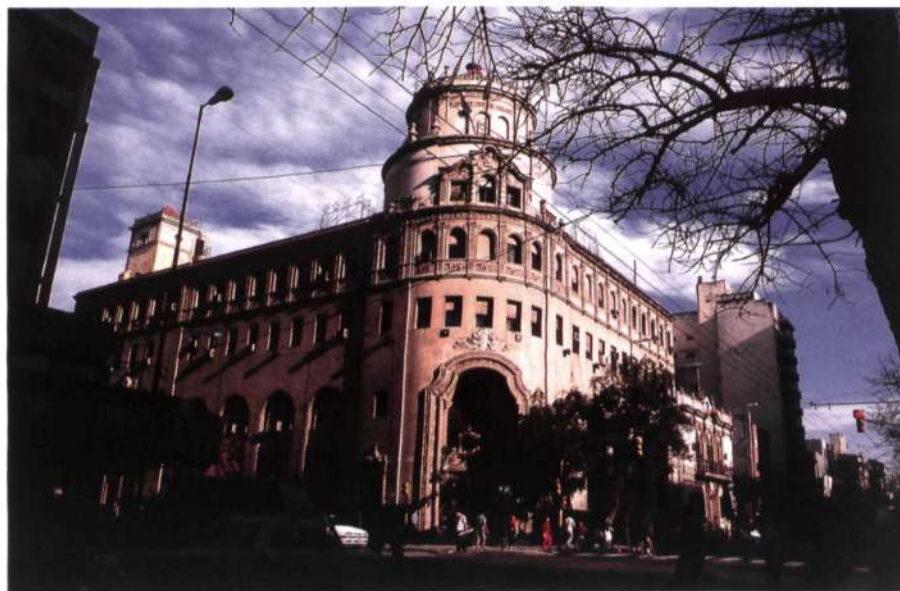
Figura 1: Córdoba. Caja Popular de Ahorros.

arquitecto en la Universidad de Michigan y fue uno de los pioneros del movimiento moderno.