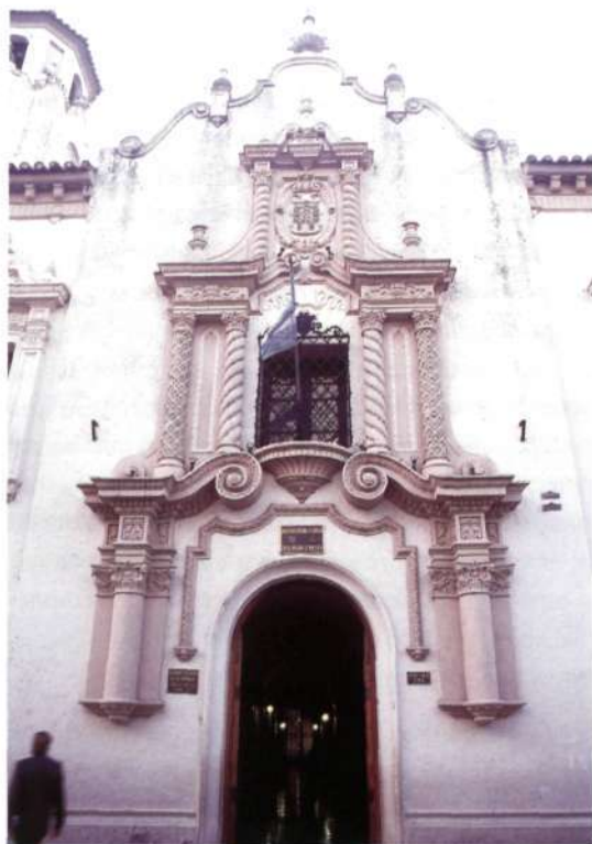
Figura 7: Córdoba. Portada del Colegio de Montserrat.

senta las columnas salomónicas y el remate mixtilíneo, que será característico tanto en los edificios civiles como religiosos. Uno de los elementos que toma de la portada del convento de las Carmelitas de Córdoba son las medias columnas. Posiblemente él creyera que originalmente fueran así, pero se ha podido ver en fotografías antiguas del convento que nunca se hicieron estas medias columnas, sino que éstas arrancaban directamente del basamento y fue en el siglo XX cuando se cortaron (debido a que la cera era demasiado angosta) para que circularan los peatones con menor dificultad.