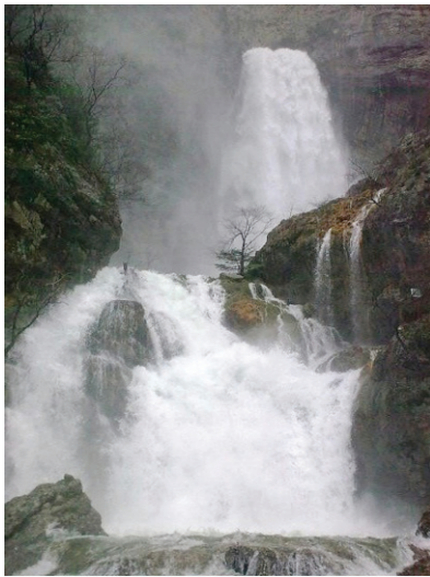
Nacimiento del río Mundo (Albacete)

AUTOR: José Joaquín Moreno Artesero Asesor técnico de la Consejería de Educación en Reino Unido e Irlanda