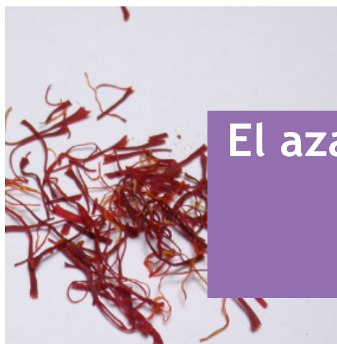
Azafrán tostado.

AUTOR: José Joaquín Moreno Artesero Asesor técnico de la Consejería de Educación en Reino Unido e Irlanda