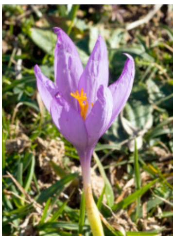
Rosa del azafrán.