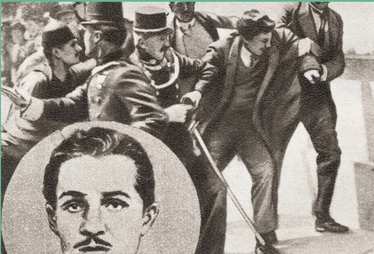
Fig. 7. La policia arresta Gavrilo Princip, assassí de l'arxiduc Francesc Ferran d'Àustria.

FASE B. Un cop acabat el treball per grups, el professor ha de demanar a un portaveu de cada grup que comenti i presenti a la classe el resultat del seu treball. La presentació, oral, es pot acompanyar d'altres suports: pissarra, pissarra digital, murals, vídeos... Les presentacions poden ser gravades per tal que siguin accessibles per a tot l'alumnat a la plataforma o bloc de l'aula. Després de l'exposició de tots els portaveus, el professor fa un recordatori del que s'ha tractat en la introducció de l'activitat i com les diferents versions del terrorisme han sembrat el terror com a eina política, basant-se en el discurs de l'odi i el pensament fanàtic. Finalment, convindria estimular un debat entre l'alumnat, que també es pot gravar i, posteriorment, penjar en la mateixa plataforma.