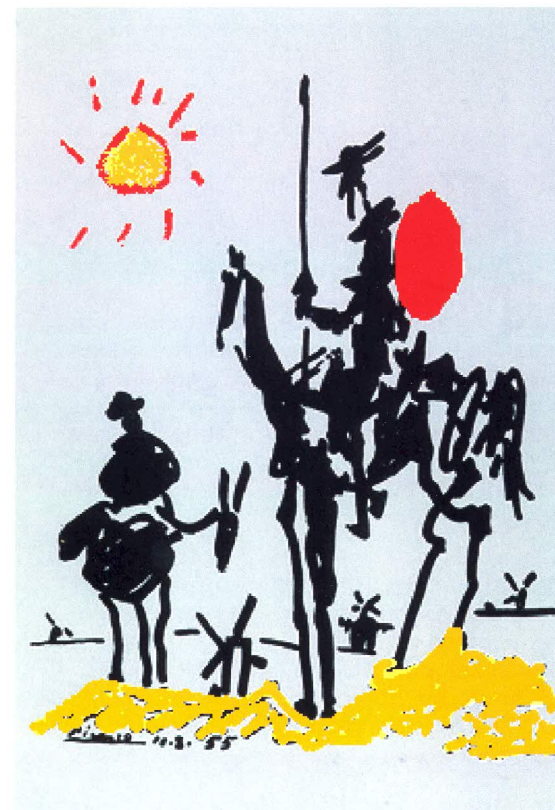
Don Quijote y Sancho, Pablo Picasso, 1955. Litografía, 51cmx41cm