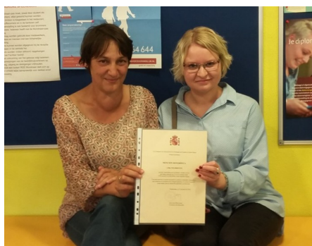
ROC MONDRIAAN DEN HAAG