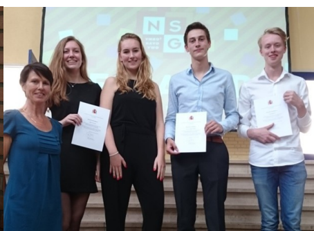
HEIJNINGEN HET NIEUWE LYCEUM HILVERSUM