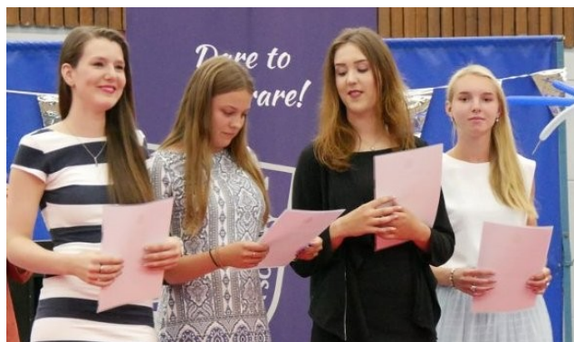
JAC. P. THIJSSSE COLLEGE CASTRICUM