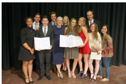
GYMNASIUM NOVUM VOORBURG DEN HAAG