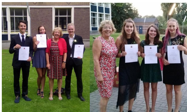
STEDELIJK GYMNASIUM ARNHEM

Felicitemos a todos los alumnos que obtuvieron el diploma y esperamos que su esfuerzo sirva de ejemplo y estímulo para los del curso que ahora se inicia.