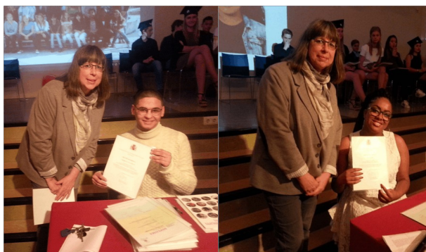
SPINOZA LYCEUM AMSTERDAM