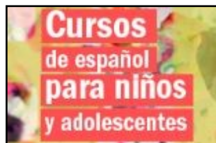
Cursos y talleres para niños