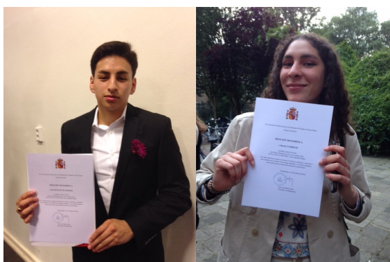
BERLAGE LYCEUM AMSTERDAM

Adjuntamos fotografías con una muestra de estos alumnos recibiendo sus diplomas en los diferentes centros.