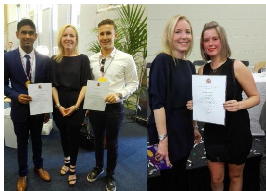
WATERINGSE VELD COLLEGE DEN HAAG