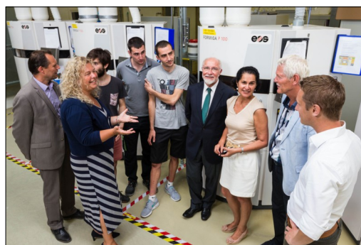
Visita en Eindhoven a la empresa Shapeways, fabricación en 3D, por parte de la delegación española y la neerlandesa.