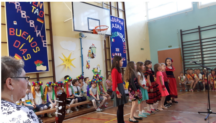
Durante el concierto escolar