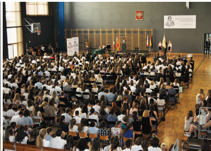
Superior izq. Mateusz Morawiecki, vice primer ministro de Desarrollo, junto al presidente de la ciudad de Wrocław, Rafał Dutkiewicz Superior der. Mateusz Morawiecki entrevistado por Radio Wrocław Inferior izq. Florentyna Ciešlik baila flamenco durante el encuentro Inferior der. El aforo completo para la despedida de curso junto al vice primer ministro, el embajador de España, el Consejero de Educación y otras autoridades