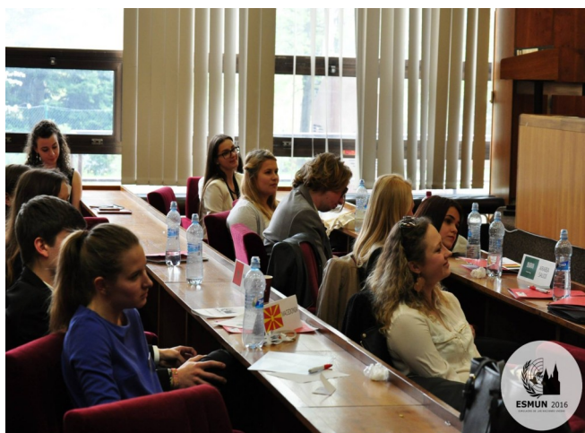
Participantes durante el evento escuchan exposición