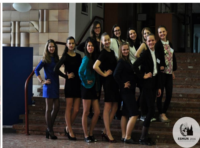
Algunas de las participantes en las afueras del evento