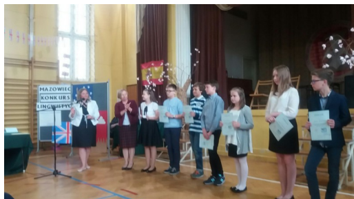
Alumnos recogiendo diplomas