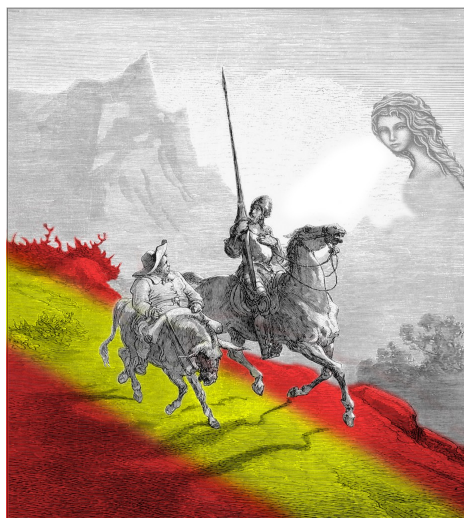
1º Premio: Michal Psíšek

3º Premio. Zuzanna Ornacka de Polonia, por su trabajo El caballero de la triste figura y su ruta por el bosque encantado .