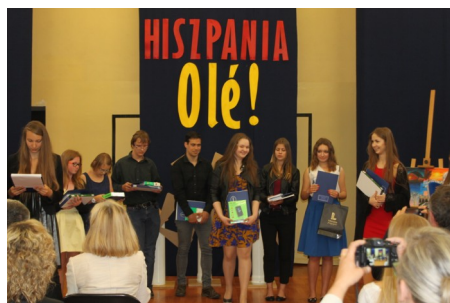
Alumnos recogen los permios en Lublin

Nuestra más sincera enhorabuena a todos y os animamos a seguir participando en nuestras Secciones Bilingües que tanto cautivan al mundo polaco.