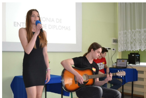
Alumnos del gimnazjum nr3 de Gdansk cantan durante el encuentro