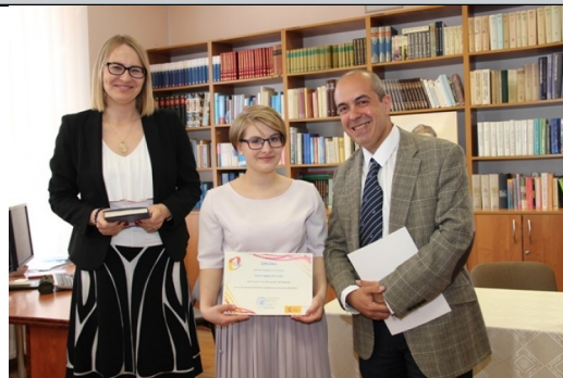
Una de las alumnas premiadas en Białystok acompañada por representación de la Consejería de Educación