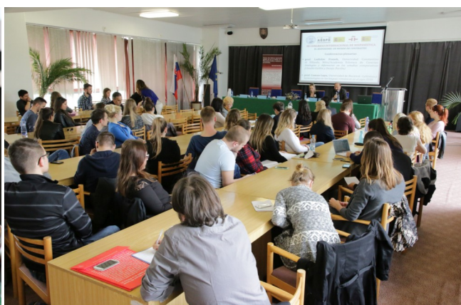
Durante las ponencias en el Congreso, participantes