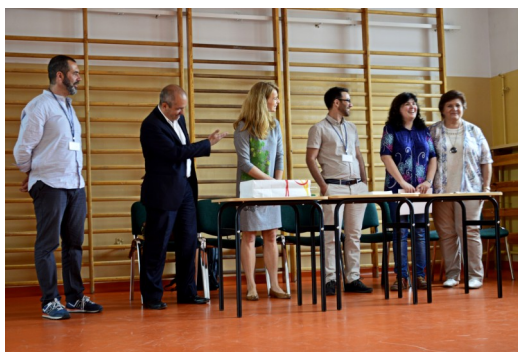
La Consejería visita Radom para la entrega de premios