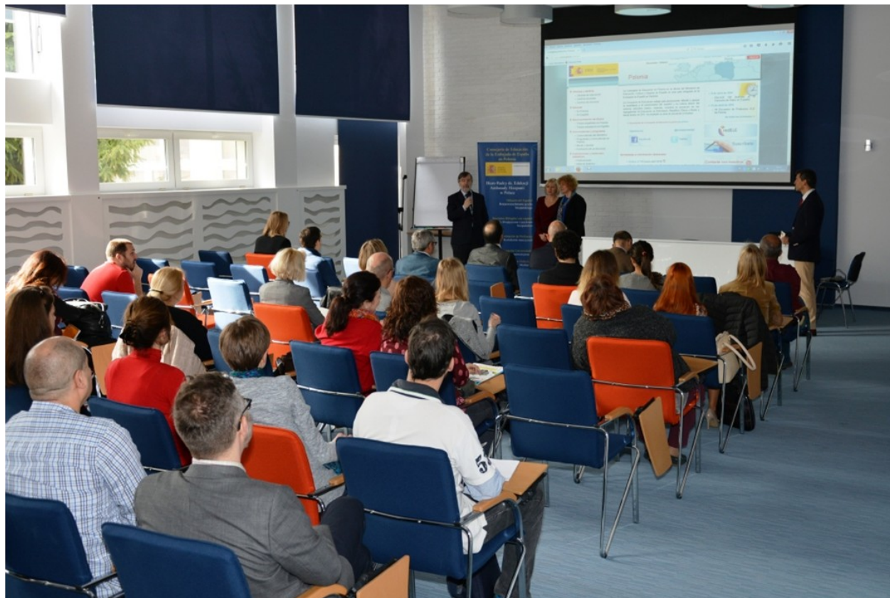
Asistentes durante el VII Encuentro ELE en Polonia organizado por la Consejería de Educación de España en Polonia

Durante el fin de semana tuvimos la oportunidad de entrar en contacto con diferentes centros, docentes y, en fin, figuras relacionadas con el mundo de la enseñanza del español. Además, allí se habló de diferentes cuestiones que afectan al universo de la lengua española, tales como: literatura para jóvenes, enseñanza a adolescentes, uso de nuevas tecnologías, tablets, móviles..., español coloquial, teatro, comprensión lectora y escrita, entre otras. Acompañaron el evento unas ricas provisiones de embutidos típicos de la región, tales como jamón, chorizo y otros ibéricos, proporcionados igualmente por la Junta de Castilla y León. El éxito de este VII Encuentro de profesores ELE en Polonia ha sido notorio al contrastar las valoraciones que hicieron todos los participantes del mismo, a los que invitamos a participar en próximas ediciones, así como a seguir enriqueciendo, de manera activa, el rico panorama del español por el mundo.