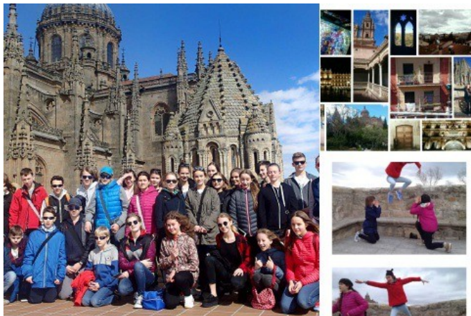
Selección de fotos del grupo que viajó a Salamanca