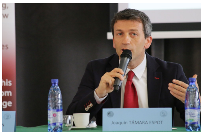
Joaquín Támara Espot, Consejero de Educación en Polonia, durante la apertura del evento