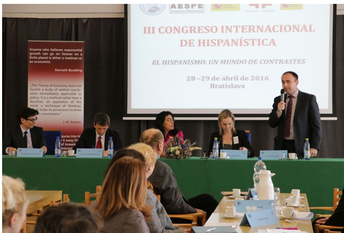
Apertura del Congreso Internacional de Hispanística

Durante los días 28 y 29 de abril se celebró en Bratislava el III Congreso Internacional de Hispanística bajo el título "El Hispanismo: un mundo de contrastes", organizado por la Asociación Eslovaca de Profesores de Español (AESPE) en la Universidad de Economía de Bratislava y con el Patrocinio de la Agregaduría de Educación de la Embajada de España en Eslovaquia y el Instituto Cervantes. El Congreso se estructuró en 4 secciones, dedicadas a la Traducción; la Didáctica; Lingüística y Didáctica; y Literatura, Historia y Cultura. A su vez, cada sección dio cabida a distintas ponencias que permitieron poner en común reflexiones y estudios realizados por hispanistas llegados desde Estados Unidos, Chile, Italia, Ucrania, R. Checa y, por supuesto, Eslovaquia. La organización fue un éxito y las ponencias del máximo interés. Así lo señalaron participantes y público con ocasión de una recepción que, ofrecida por el embajador de España en Eslovaquia Félix Valdés, puso fin al Congreso.