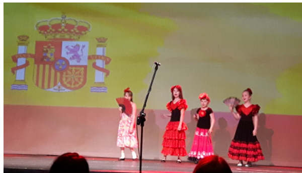
Representación de flamenco durante el encuentro

En el marco del evento el público vio una obra de teatro bilingüe (interpretada en español e inglés), preparada por los alumnos de la red nacional de escuelas de lenguas extranjeras MAŁA LINGUA & LINGUA TEENS SPACE. Gracias a la preparación profesional de los pequeños artistas por parte de los actores del Teatro Syrena, y los profesores de MAŁA LINGUA, el espectáculo fue un gran éxito y mostró el gran potencial para el aprendizaje de lenguas extranjeras que tienen los niños más pequeños.