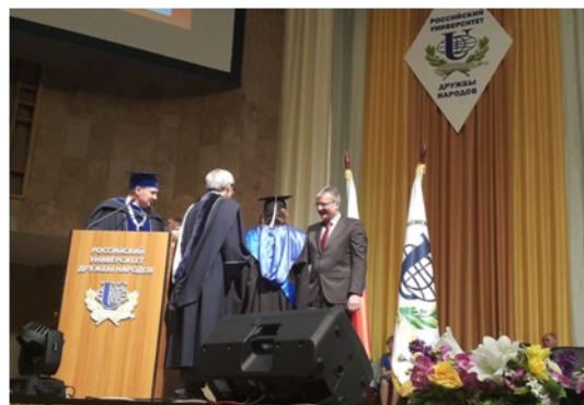
Autoridades durante el acto

Por otro lado, la Facultad de Humanidades de la Universidad de la Amistad de los Pueblos, en Moscú, cuenta con dos programas de doble titulación con las universidades de las Islas Baleares y Complutense. A finales de junio también se hizo entrega de sus diplomas a los alumnos de estos programas de estudios. Los programas de doble titulación representan uno de los niveles de mayor profundización en la cooperación educativa entre instituciones universitarias.