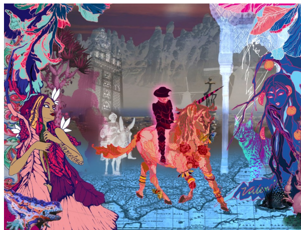
3º premio: Zuzana Ornacka