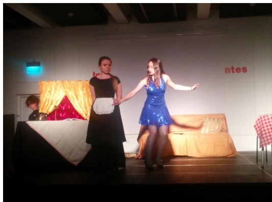
Durante la representación de Hotel Splendor , la ganadora