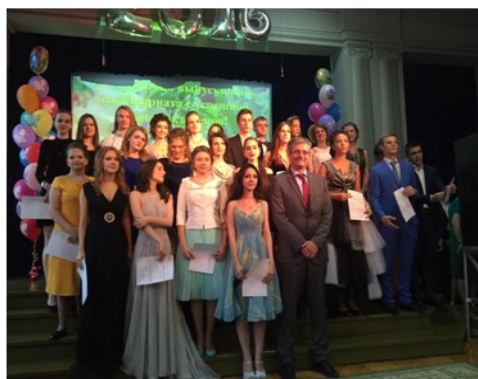
Representación de la Agregaduría de Educación en Rusia y participantes

Coincidiendo con el final del curso académico, la Agregaduría de Educación de la Embajada de España en Rusia participó en diferentes ceremonias de graduación y entrega de certificados a alumnos de Secciones Bilingües de Español y programas universitarios de doble titulación. El día 24 de junio, el Agregado de Educación visitó los cuatro colegios con Sección Bilingüe ruso-española de Moscú, y tuvo la oportunidad de felicitar personalmente a los más de cuarenta alumnos que en el presente curso académico han cumplido con todos los requisitos académicos para obtener la doble titulación de Bachillerato.