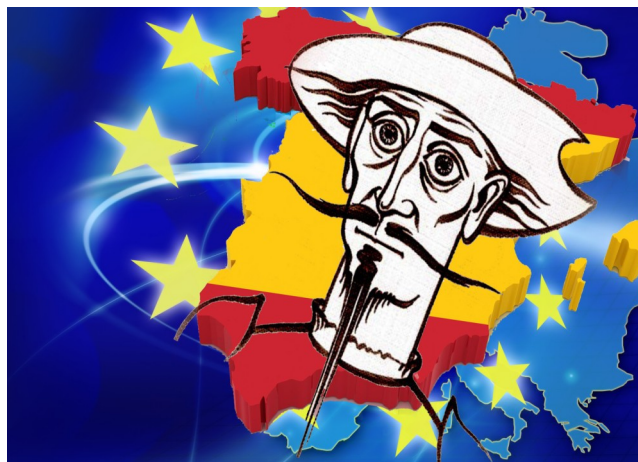
2º premio: Tetiana Chilyi