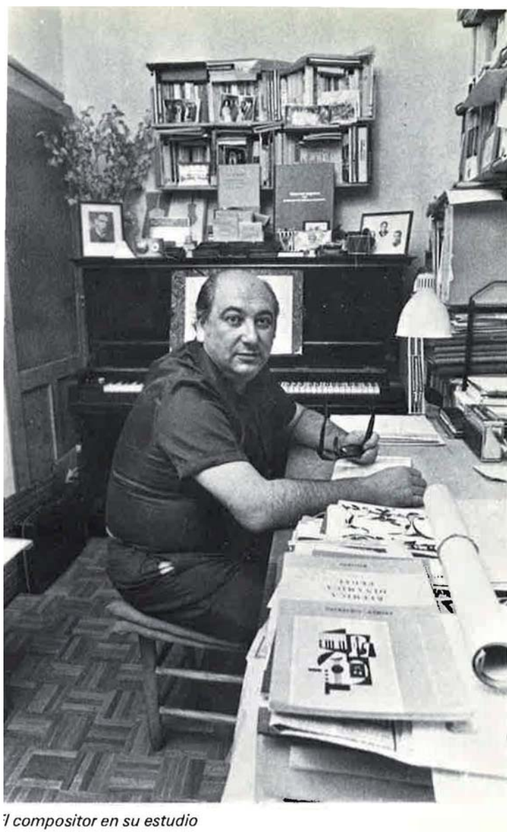
l compositor en su estudio