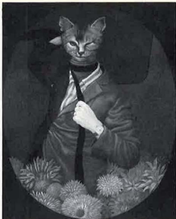
«Hombre gato», 1972