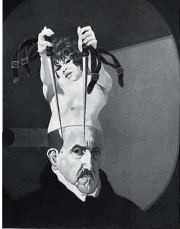
Gloria III , 1973