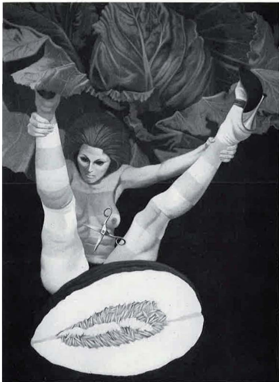
«Naturaleza muerta», 1973