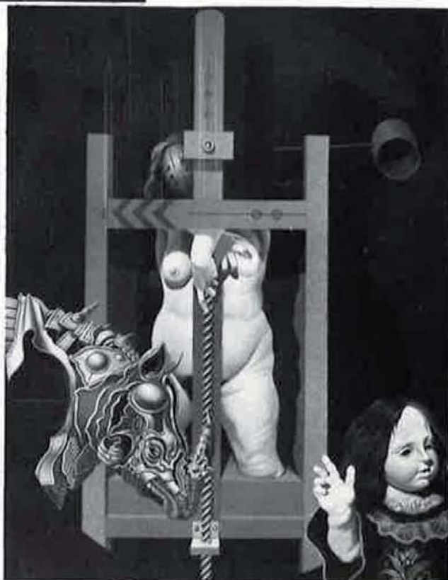
Acción de anatomía , 1973