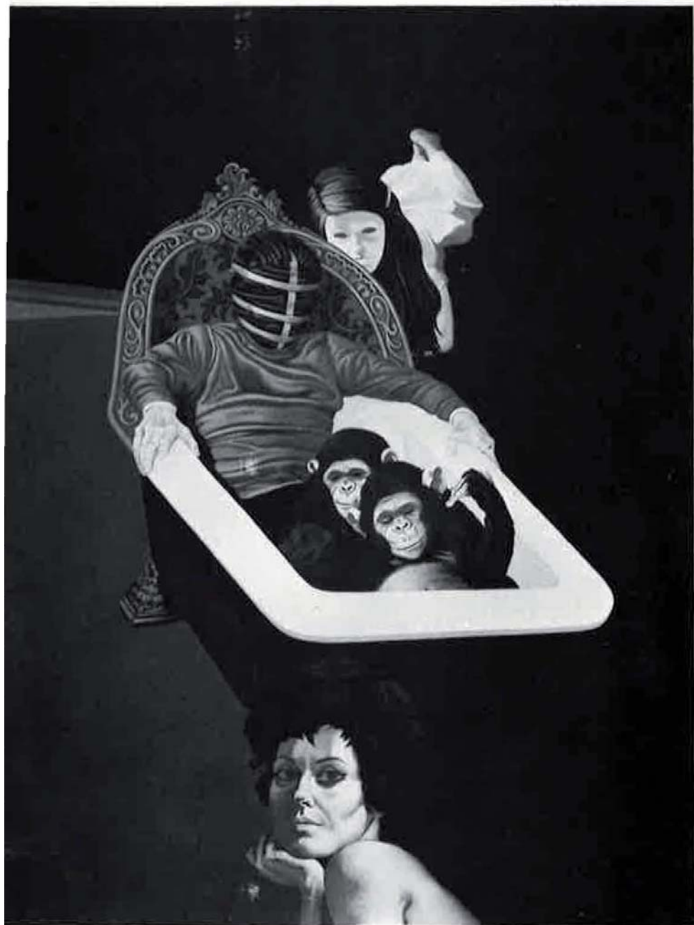
retorno del Junker, 1973