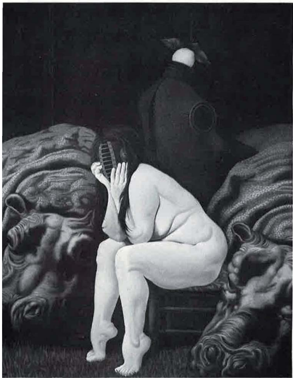
a domadora, 1972