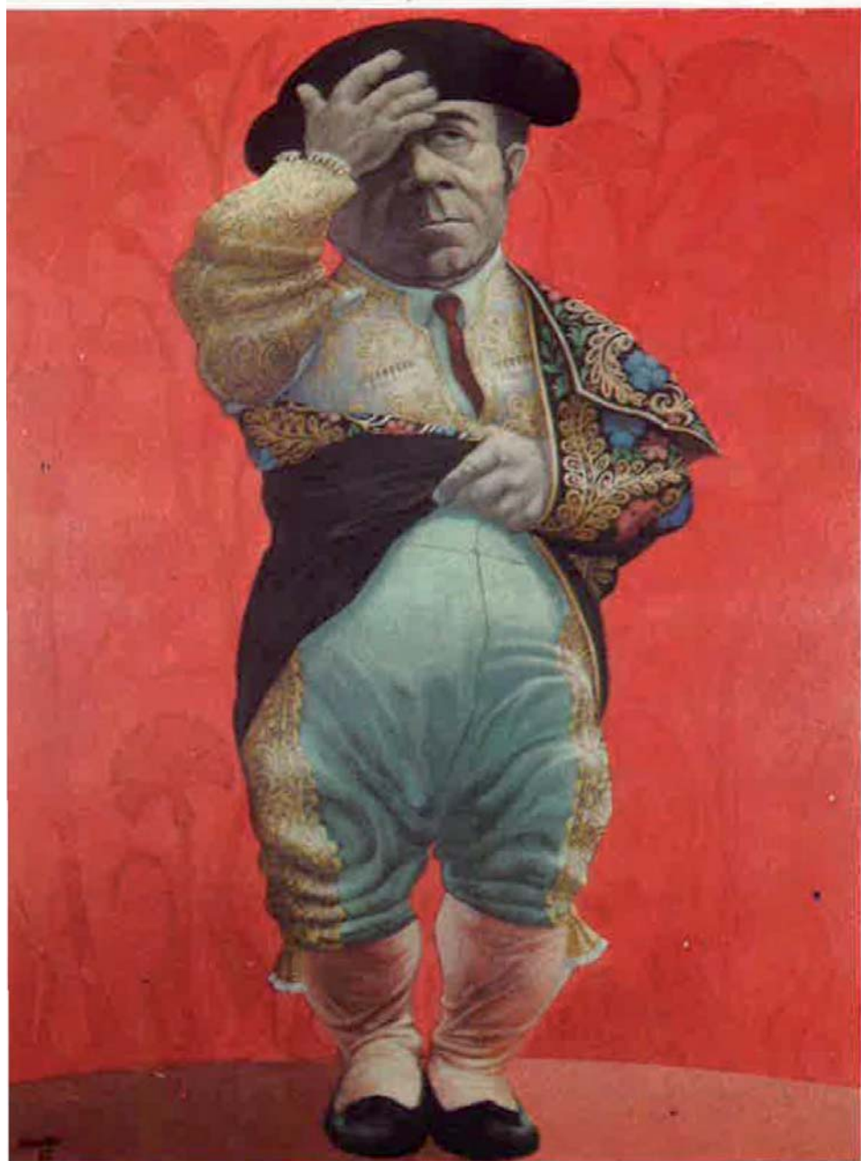
Torero , 1967