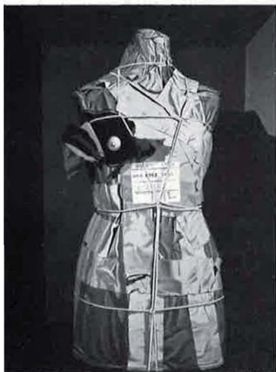
Valija diplomática, 1973