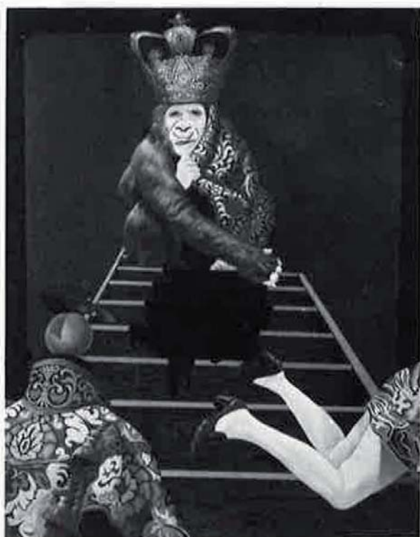
pirámide del poder, 1972