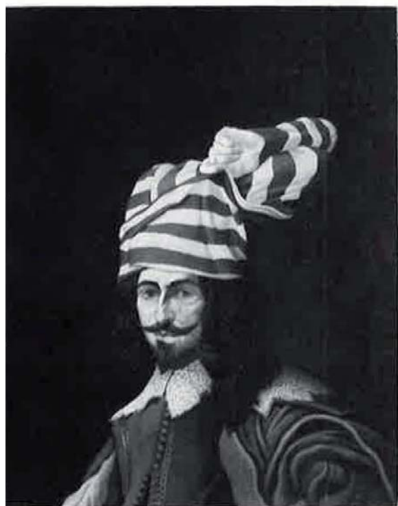
«Caballero anónimo», 1972