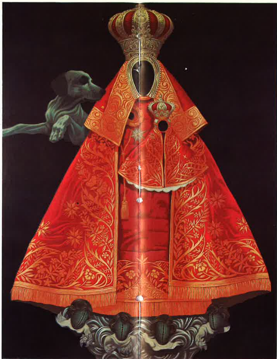
Imagen , 1973