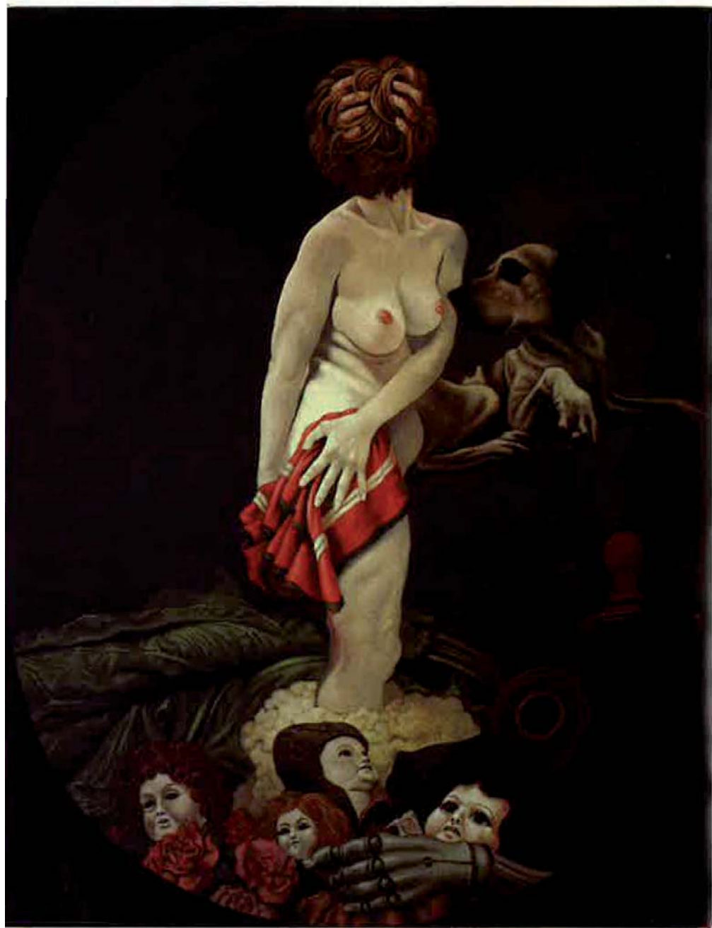
Mujer con perro», 1972