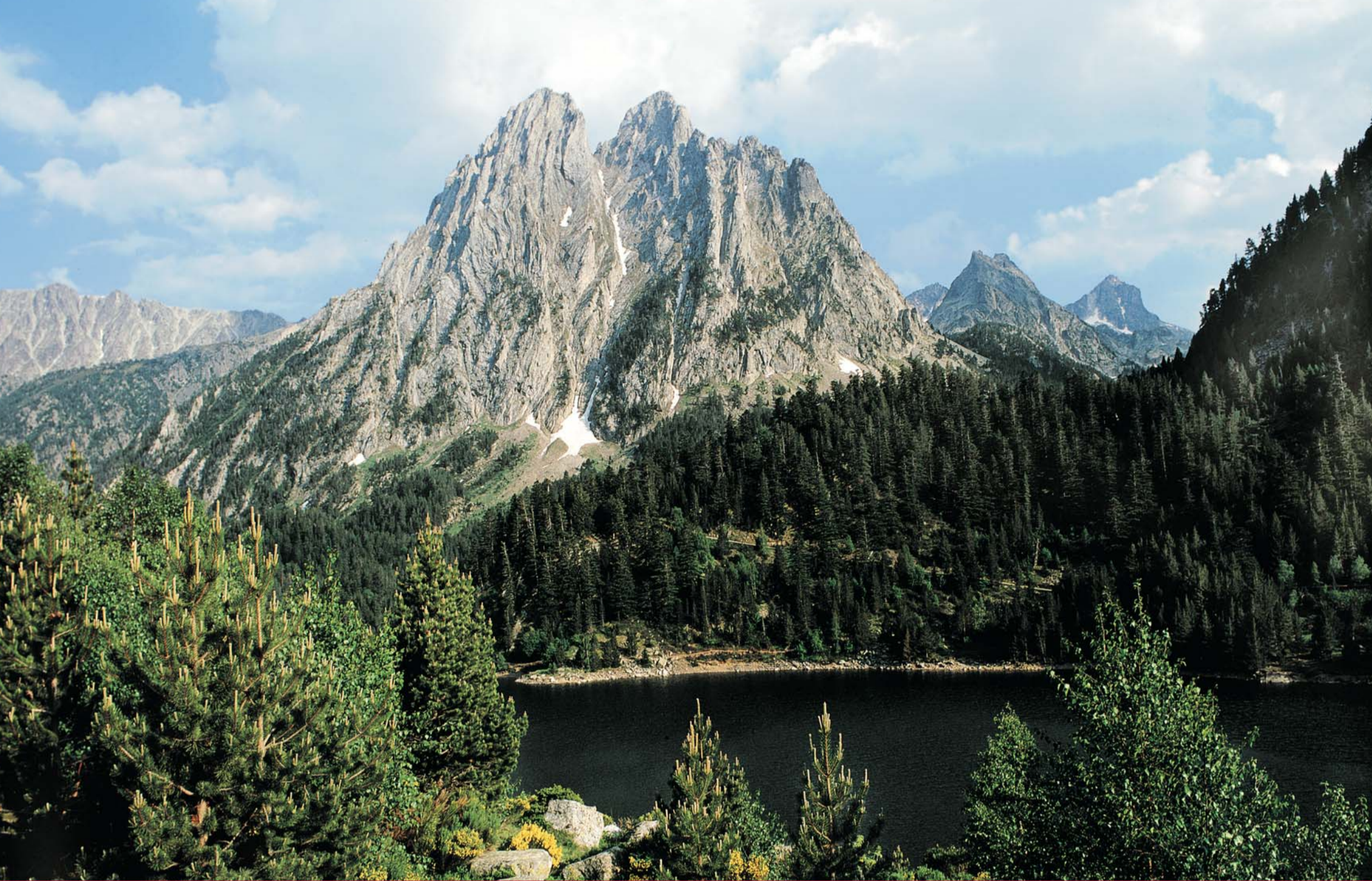
Aigüestortes 31866