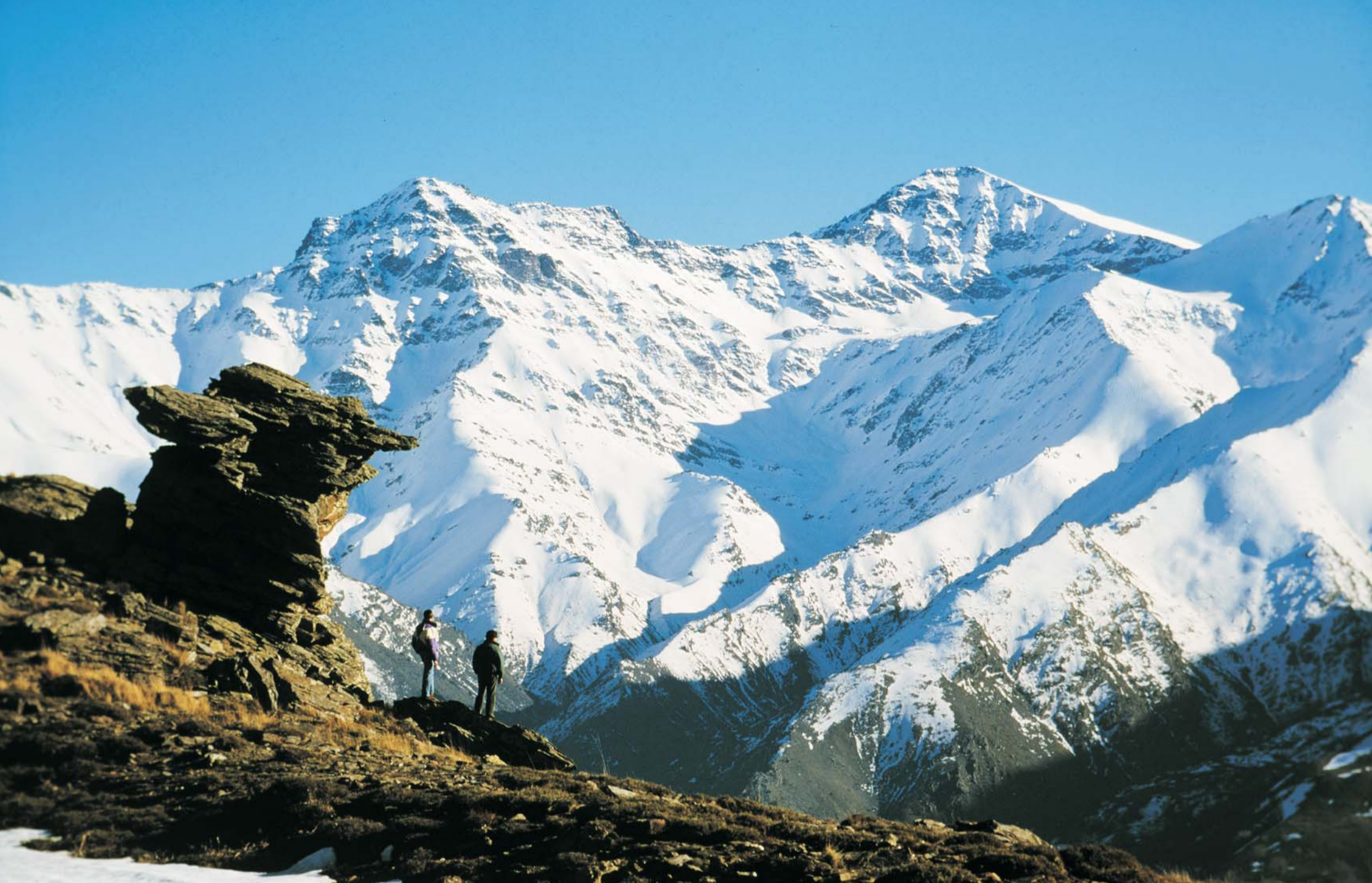
Sierra Nevada 26893