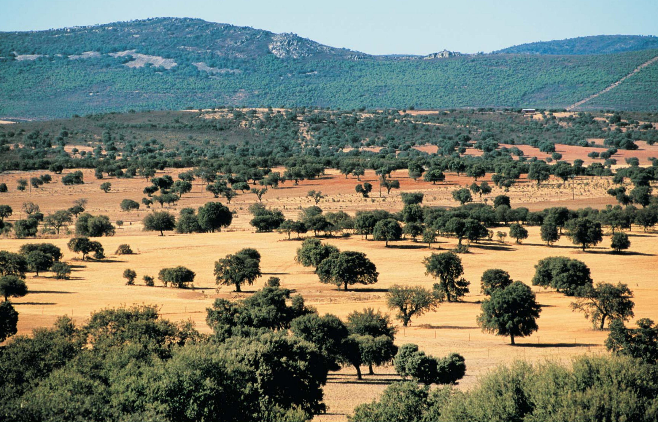
Cabañeros 34695