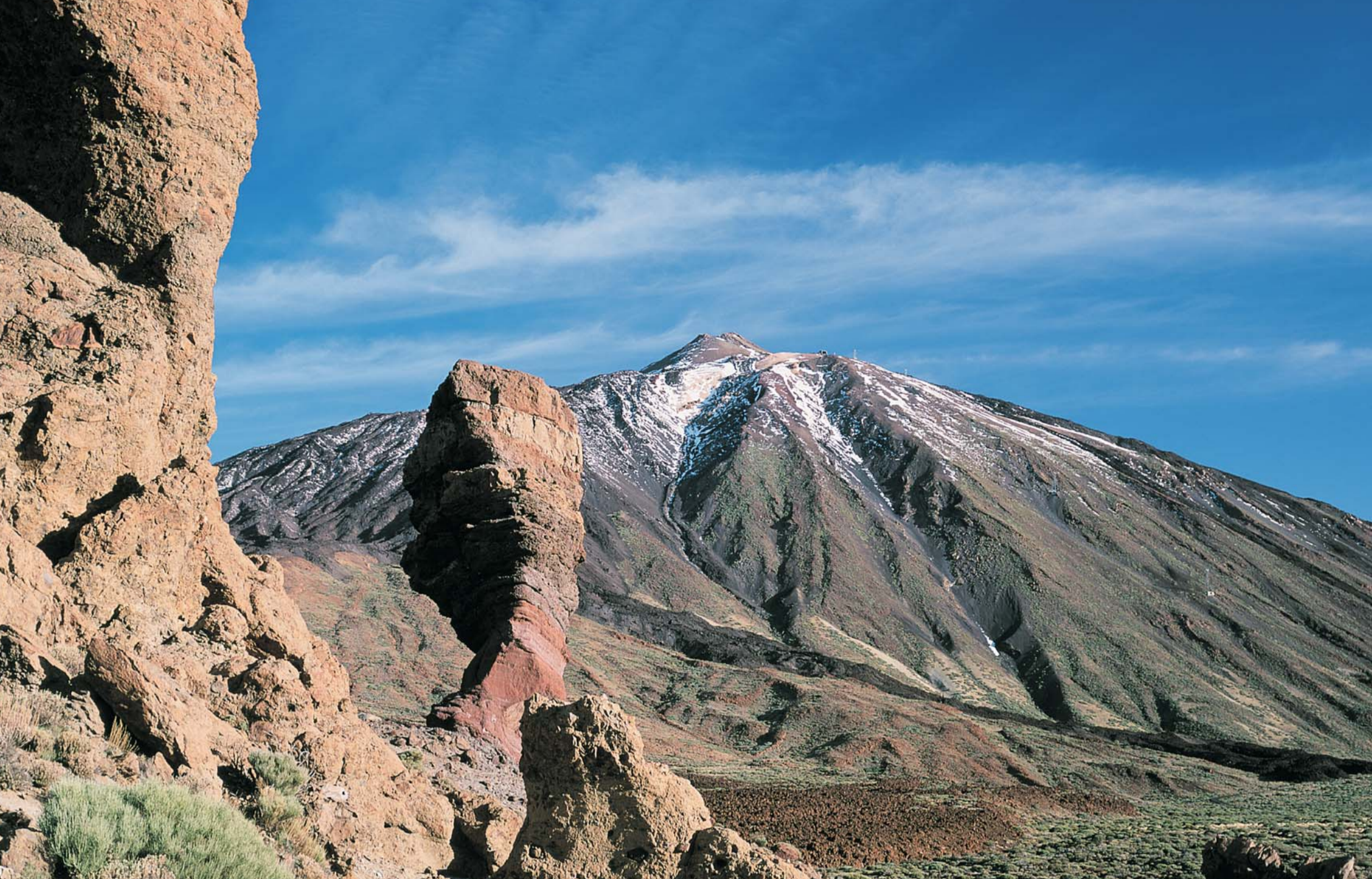
Teide 31845