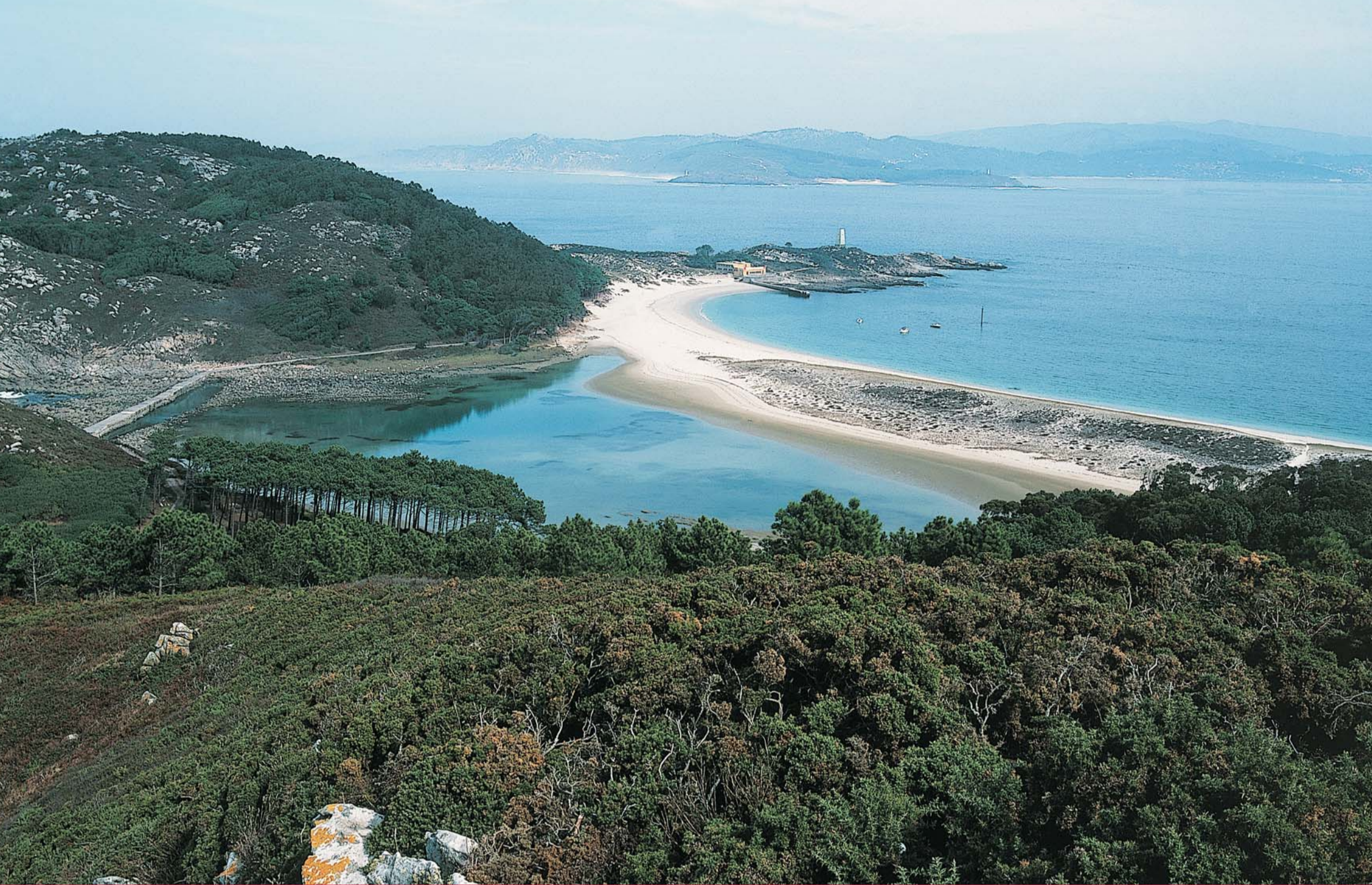
Islas Atlánticas