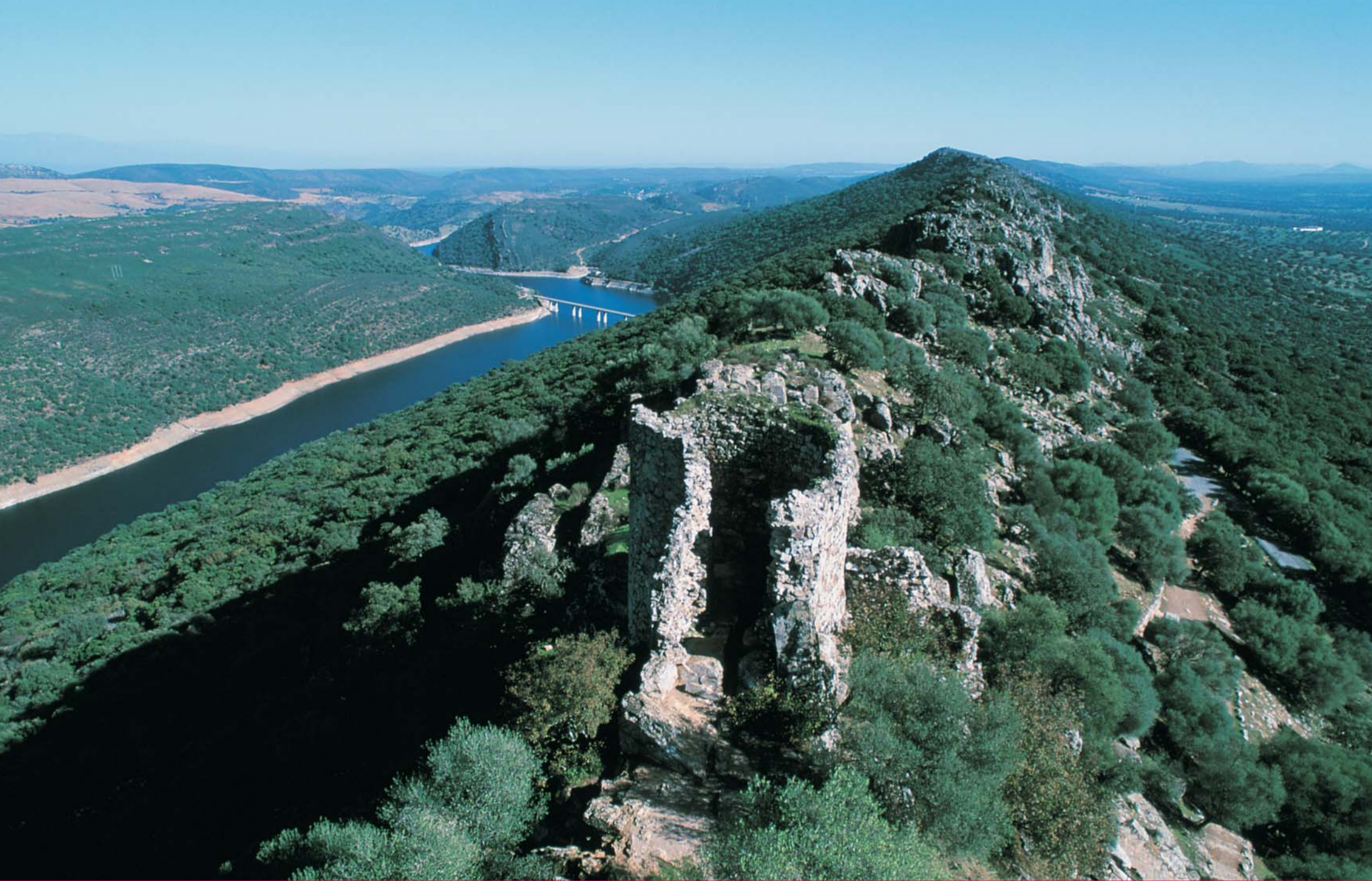
Monfragüe 31879