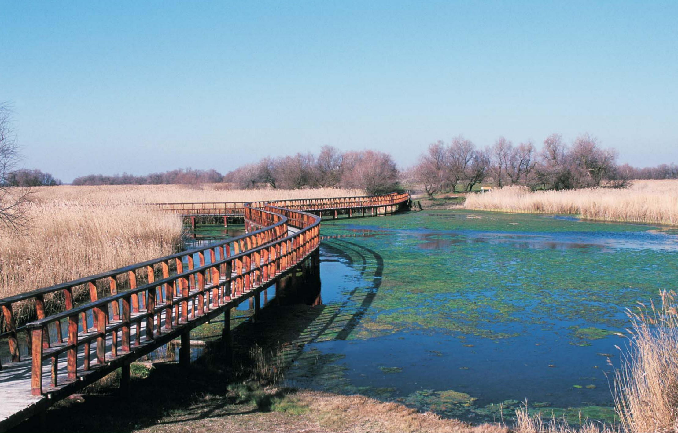
Tablas de Daimiel 23478