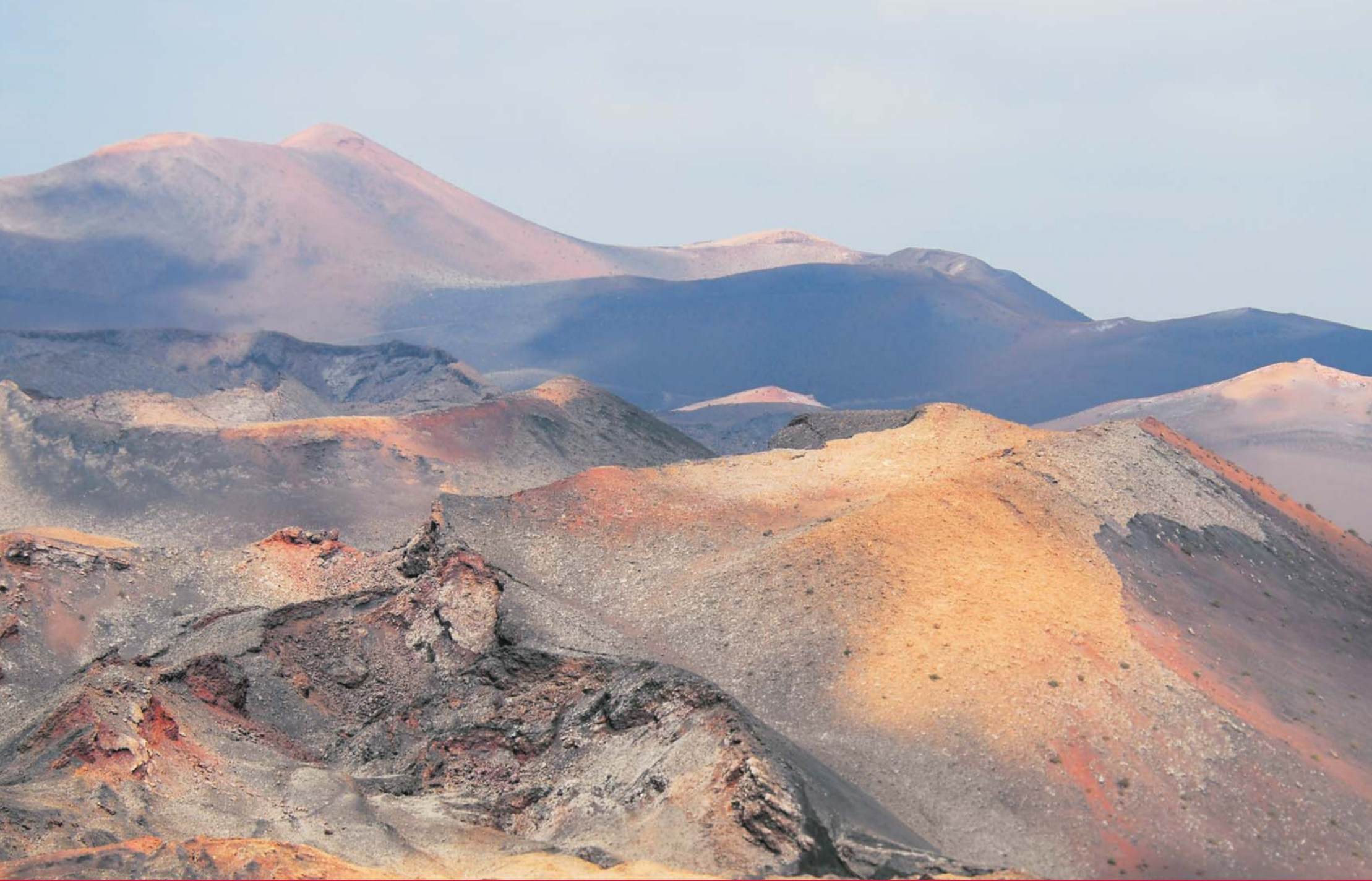
Timanfaya 37588