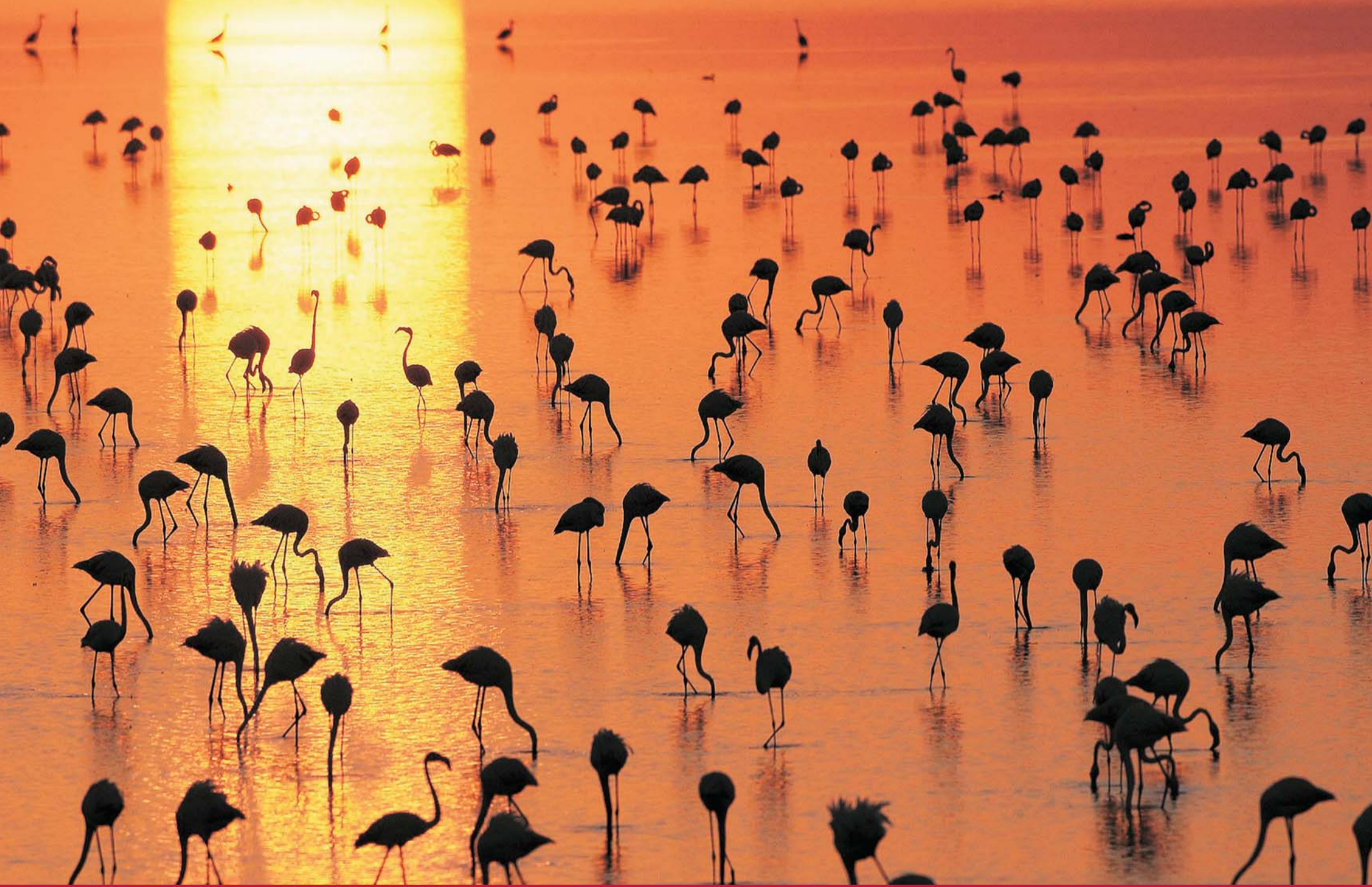
Doñana 38061