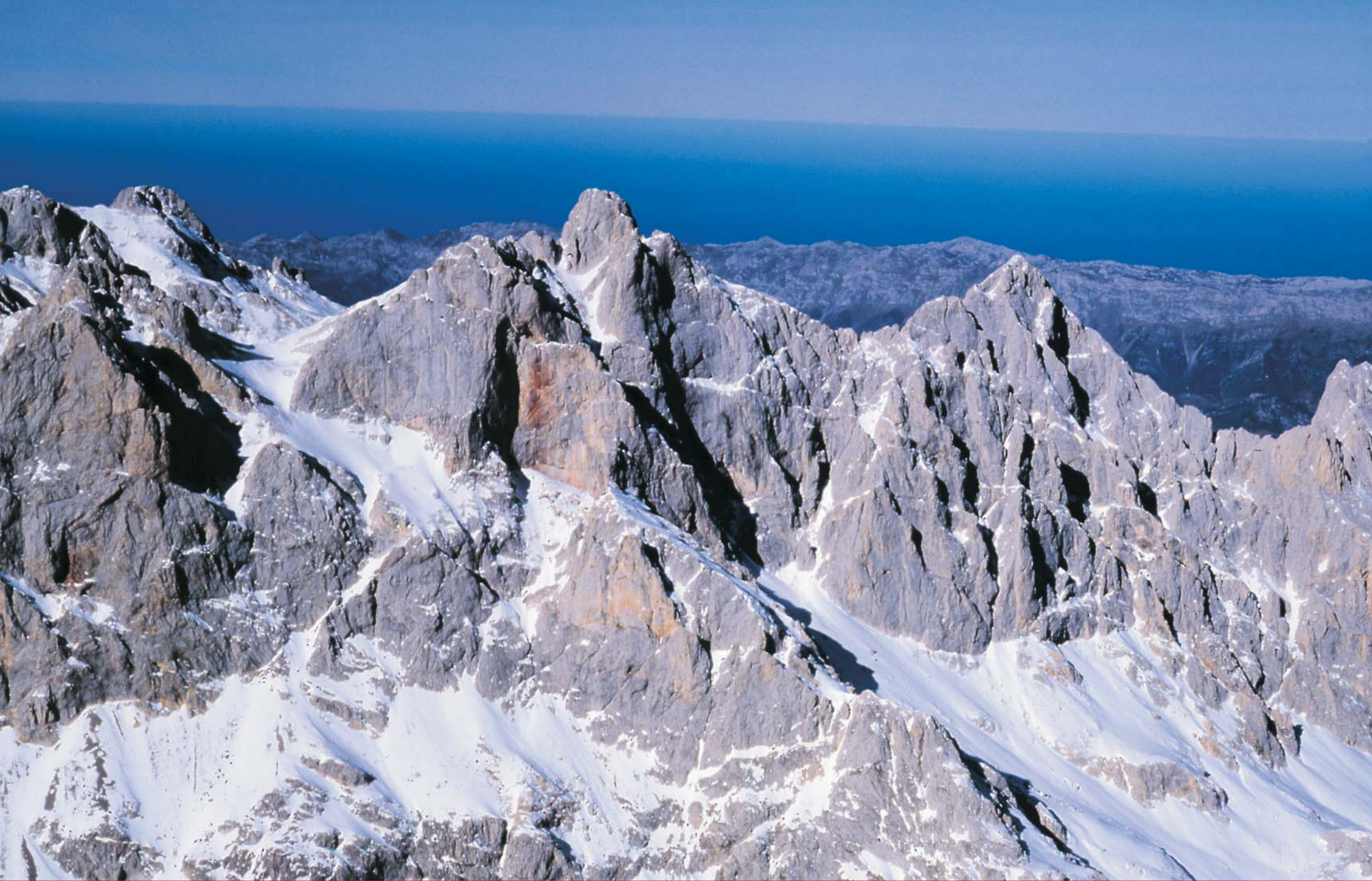
Picos de Europa 14530