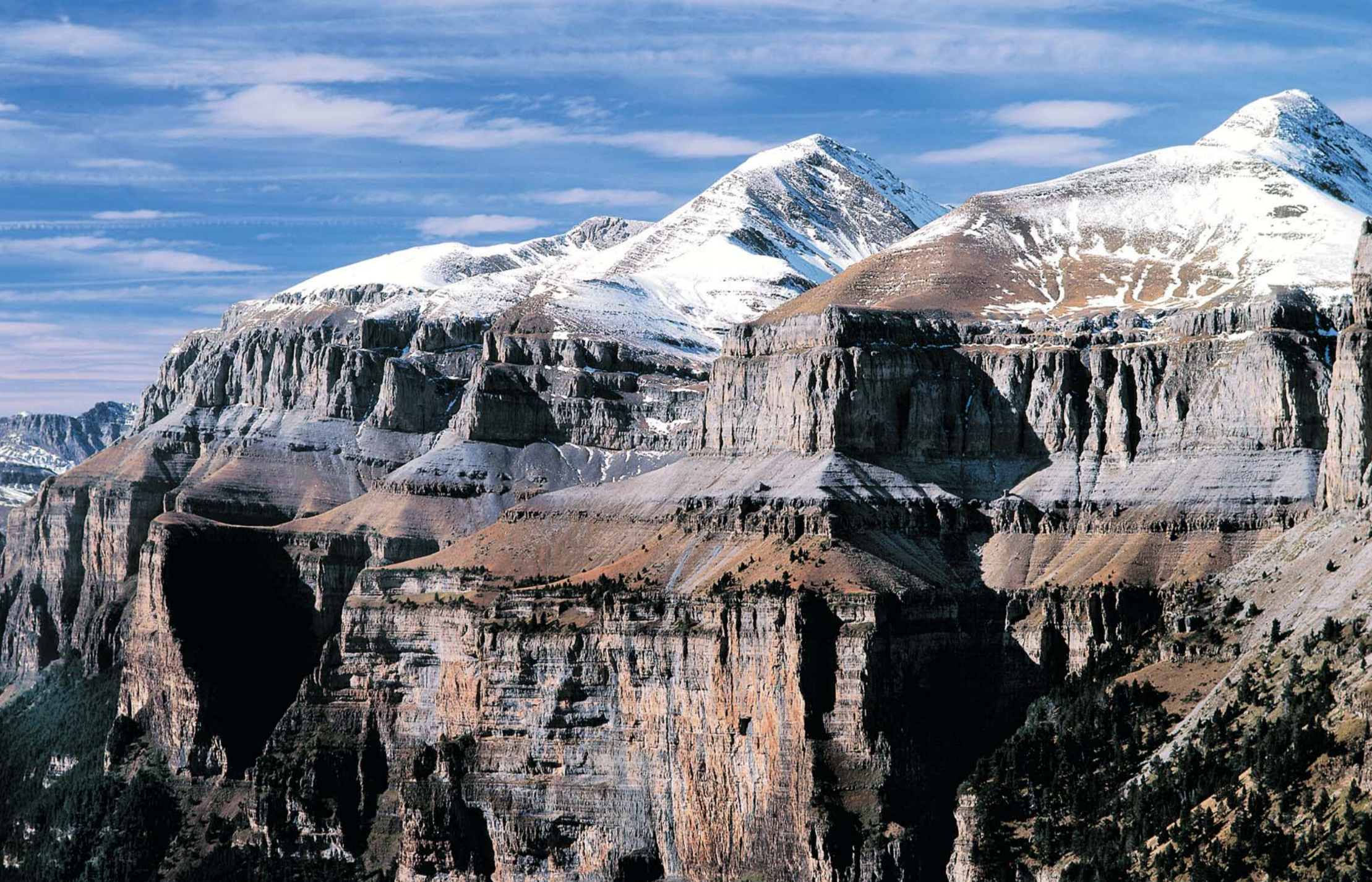
Ordesa 31856