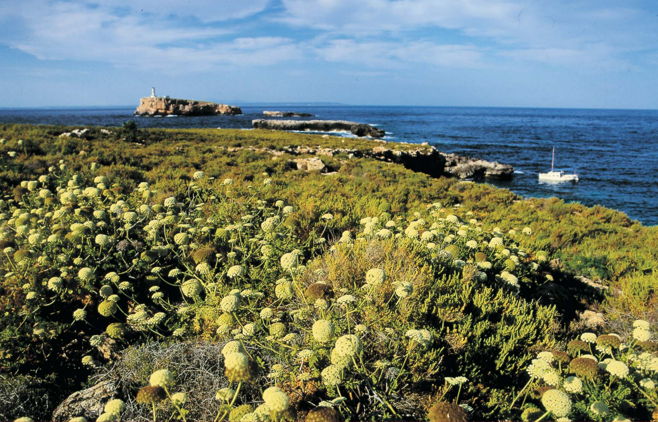
Archipiélago Cabrera 13708