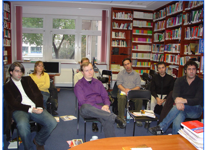
Lectores del Programa MAEC AECID, que imparten docencia en Polonia durante el curso 2009-2010, en un momento de la visita.