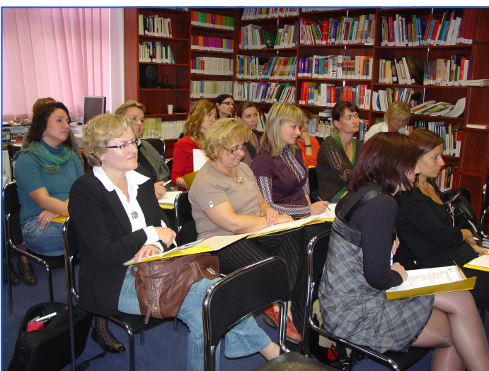
Las coordinadoras de las Secciones Bilingües de Polonia escuchan la exposición de la Consejera de Educación.

El cordial almuerzo de trabajo que completó la reunión sirvió para que todas las coordinadoras pudieran conocerse mejor, para que compartieran inquietudes y experiencias y para que, en el futuro, se puedan estrechar lazos y crear nuevas vías de colaboración entre las distintas Secciones Bilingües.