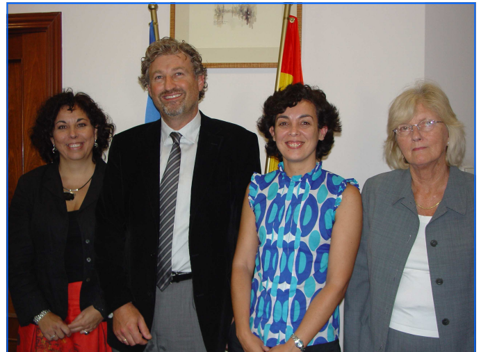
El equipo de la Consejería de Educación de España en Polonia junto al Consejero de Educación del Reino Unido.