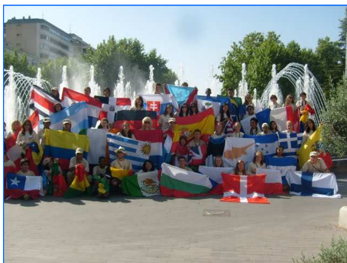
Participantes en la Ruta Quetzal 2009 posan con las banderas de sus correspondientes países.