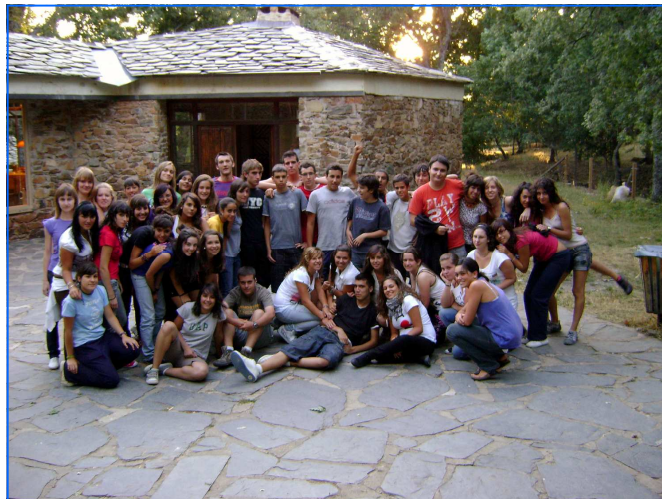
Foto de grupo en Umbralejo

Si tuviera la oportunidad de volver, lo haría sin lugar a dudas”.