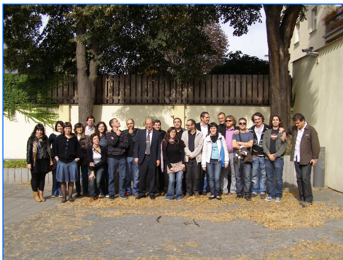
El Agregado de Educación junto al profesorado español de las Secciones Bilingües en la República Checa.