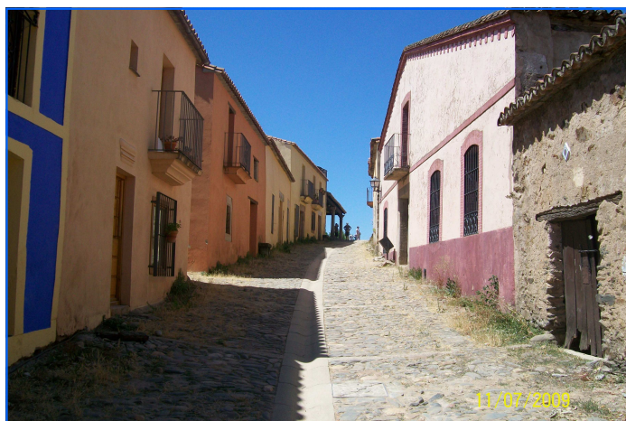
Foto de Granadilla, Extremadura