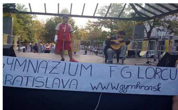
Imagen del Día Europeo de las Lenguas en Bratislava

La sesión concluyó con la reunión de los grupos de trabajo de Matemáticas y de Literatura, que están elaborando, respectivamente, una guía práctica de bachillerato y una antología de textos y cronología histórico-cultural, con previsión de ser publicadas en este año y en el próximo.