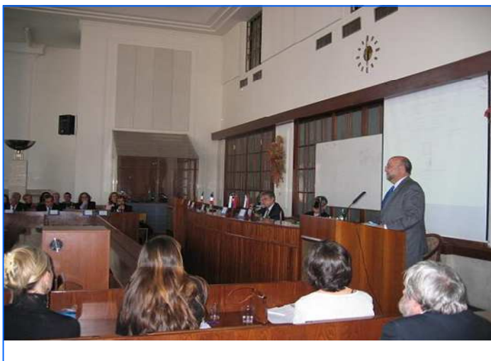
Imagen de la conferencia internacional

En colaboración con la sección cultural de la Embajada, esta exposición, que presenta en 46 carteles otras tantas visiones del Quijote por parte de artistas plásticos españoles actuales, tras haber protagonizado los actos de la celebración del Día del Libro en Bratislava, y tras haberse mostrado en la de Košice, ha iniciado una gira por las secciones bilingües de Eslovaquia. Actualmente se exhibe en la Casa de la Cultura de Trstená, en donde está teniendo una notable repercusión entre los centros escolares de la zona.