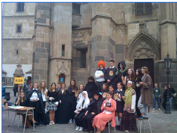
Imagen de los Días de la Cultura española en Košice