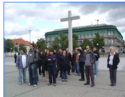
Imágenes de la reunión de profesores y de la posterior visita cultural a Varsovia.

Organizado por la Consejería de Educación de la Embajada de España, el sábado 5 y domingo 6 de septiembre de 2009, tuvo lugar la primera reunión del presente curso del profesorado de Secciones Bilingües de Polonia en el Centro de Recursos de la Consejería de Educación en Varsovia.