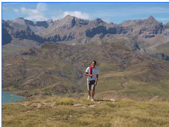
Imagen de Búbal, Huesca