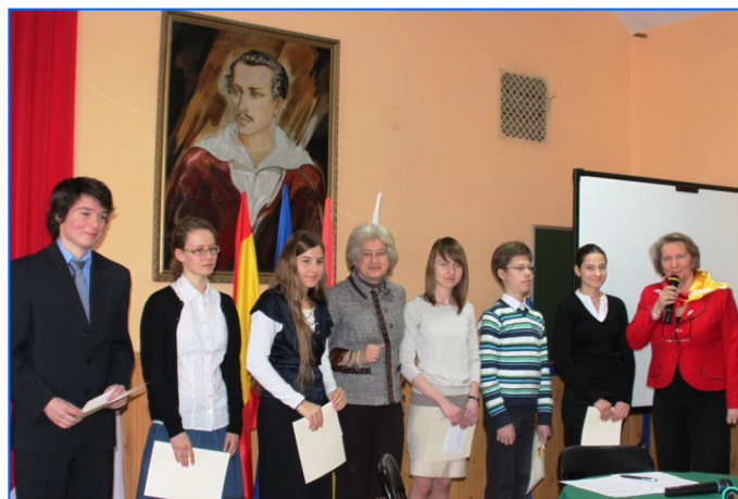
Entrega de becas en el Gimnazjum n° 10 de Oddziałami, Wrocław.