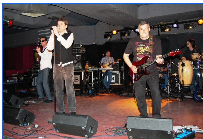
Un momento durante la actuación de del grupo Danza Invisible en el Club Hybrydy.