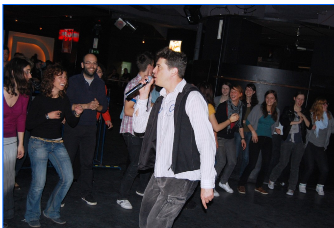
Profesores y alumnos de las Secciones Bilingües de Español con Javier Ojeda, líder del malagueño grupo Danza Invisible.