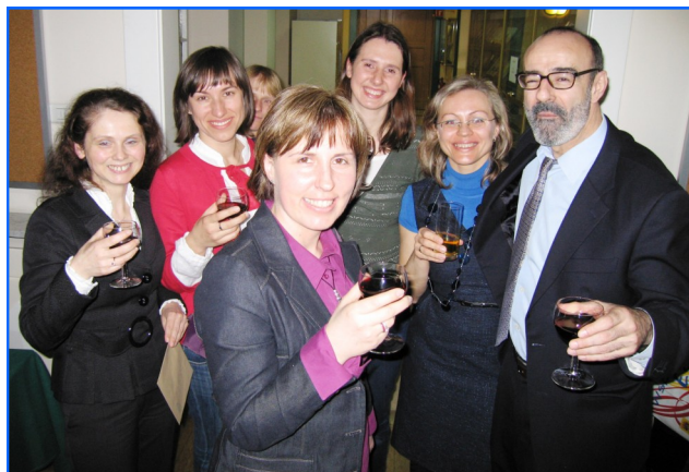
Algunos de los participantes en el curso.

Las instalaciones del Centro de Desarrollo de la Educación (ORE), situado en la Plaza de las Tres Cruces, acogieron el 19 de marzo el acto de entrega de diplomas de la tercera promoción de EUROPROF y del curso de metodología de lengua española.