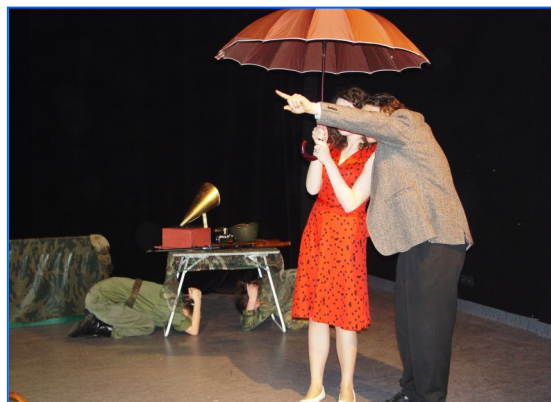
El Liceo XXXII Halina Poświatowska de Łódź representa 'Pic-Nic', de Fernando Arrabal.