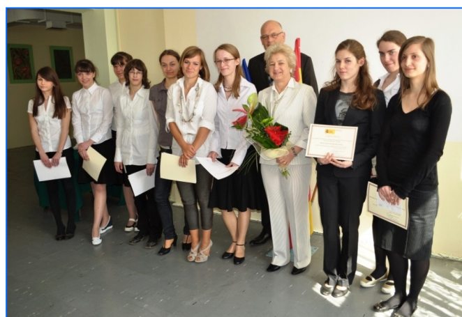
La Secretaria General, con los alumnos del Gimnazjum n° 3 Jana Pawła II, de Gdańsk.