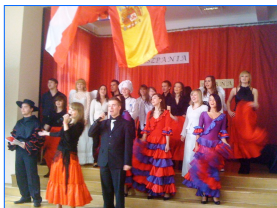
Grupo de participantes de la actividad.

Para más información sobre el centro, visita la web: http://www.zspw.waw.ids.pl/