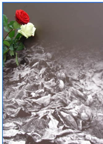
Exposición sobre las víctimas de Katyń de 1940.