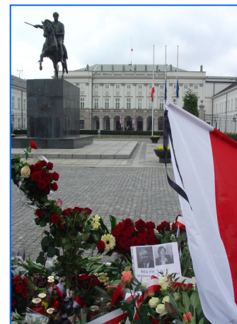
Muestras de cariño ante el Palacio Presidencial.

La Consejería de Educación de la Embajada de España quiere expresar sus condolencias por el trágico accidente aéreo ocurrido el 10 de abril en Smolensk, Rusia, en el que murió el presidente polaco Lech Kaczyński, junto a destacados funcionarios de su gobierno.