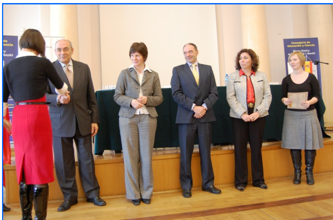
El director del Instituto Cervantes de Varsovia felicita a una de las participantes, acompañado de las otras autoridades que presidieron el acto.