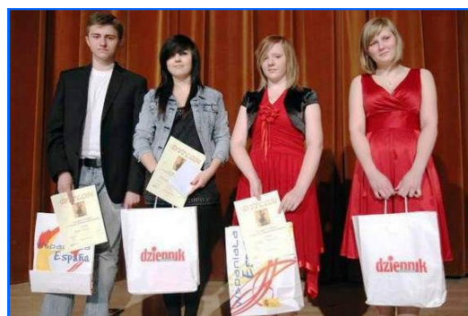
Grupo de finalistas del concurso.