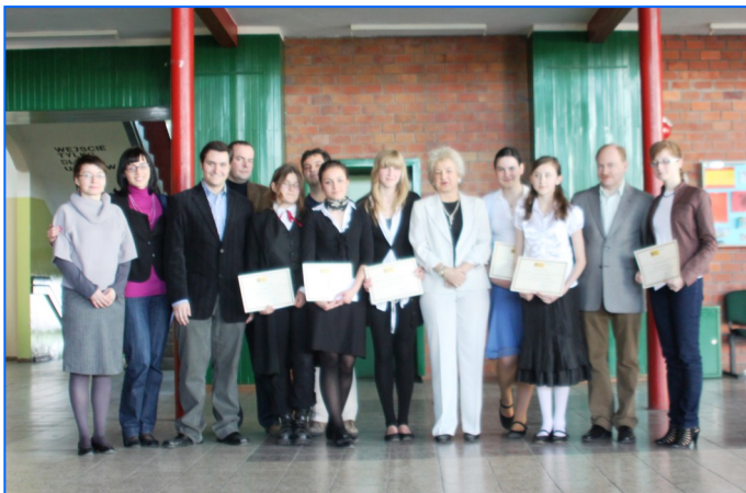
Entrega de becas en el Zespół Szkół n° 4 Prof. Józefa Tischnera de Poznań.