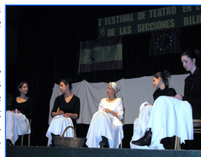
'La casa de Bernarda Alba'.

Además de sentimiento dramático, los estudiantes también pudieron conocer la ciudad de Praga a través de las rutas culturales programadas por la Ciudad Vieja y el Barrio Judío, el Castillo y la Ciudad Pequeña, y la Ciudad Nueva.