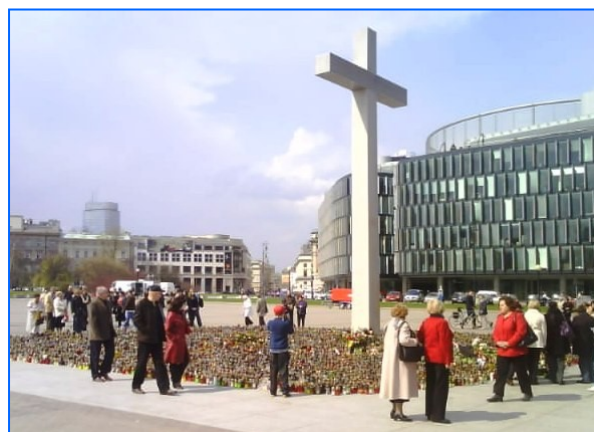
Plaza Marszałek Józef Piłsudski.

Al día siguiente Cracovia volvió a ser ruidosa y poco a poco se fue olvidando de las emociones encontradas de aquellos días. El accidente y el pesar afectó a todos los polacos sin excepción. Pero, sin duda, recibimos una clase de historia nacional de la que se pueden sacar algunas conclusiones, como que el patriotismo no siempre consiste en una crítica ruidosa, sino también en un poco de silencio en los momentos adecuados.”