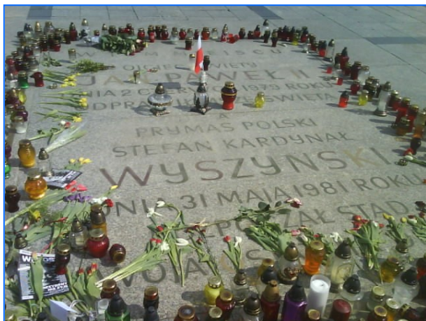
Placa-homenaje al Cardenal Wyszyński, adornada con velas y flores el día del accidente aéreo.