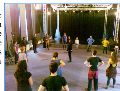
Un momento durante el taller.

Al día siguiente, actores de esta compañía ofrecieron un taller de teatro al que acudió cerca de veinte participantes, entre ellos profesores de las secciones bilingües de Eslovaquia.