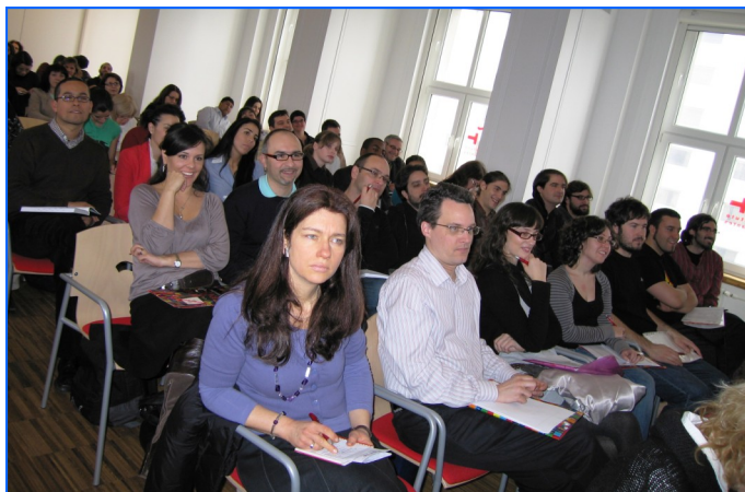
Grupo de profesores asistentes a la actividad, en el Instituto Cervantes de Varsovia.

La Consejería de Educación, en colaboración con el Instituto Cervantes de Varsovia, organizaron el “Encuentro de profesores de ELE de Polonia. Evaluación y autoevaluación del aprendizaje en el aula de español en Polonia”, que se desarrolló el sábado 13 y el domingo 14 de marzo en las instalaciones del Instituto Cervantes de Varsovia. La jornada contó con 160 participantes.