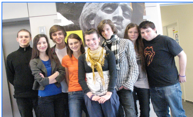
Los jóvenes actores del Liceo XXII José Martí, de Varsovia, interpretaron 'La sirena varada', de Alejandro Casona.