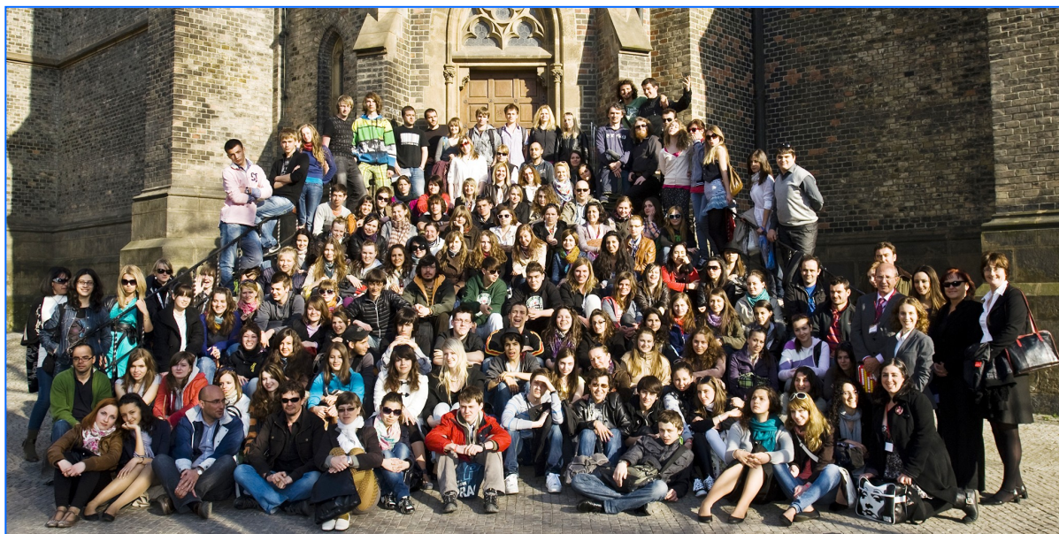
Grupo de participantes en el Festival Internacional de Teatro.

Alrededor de 160 jóvenes de Europa Central y del Este participaron del 18 al 23 de abril en la XVII edición del Festival Internacional de Teatro Escolar en Español.