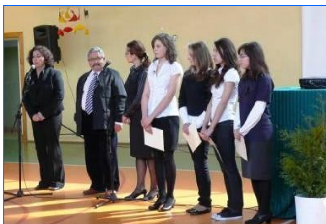
Entrega de becas en el Gimnazjum n° 32 y Liceo XIV, de Szczecin.

Estas jornadas se han convertido ya en un acontecimiento destacado en la planificación y organización de las actividades que se celebran en los centros educativos durante el curso y en muchos casos suele coincidir con lo que se ha venido en llamar día del español o de la sección española , jornada en la que se llevan a cabo diversas escenificaciones de contenidos hispanos y a la que asisten, además del equipo docente y alumnado, padres y representantes de la Administración educativa: representaciones de obras de teatro, musicales, bailes y otras actividades centran el interés de la comunidad educativa a lo largo de una jornada que concluye con acto muy emotivo en el que se hace entrega de la ayuda económica.