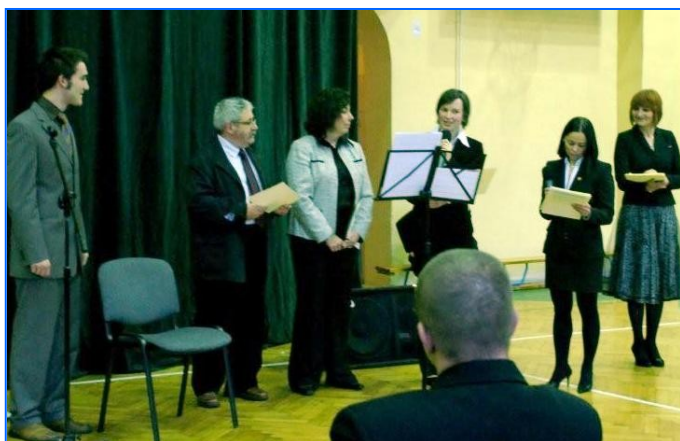
Entrega de becas en el Liceo II Marii Konopnickiej, de Katowice.