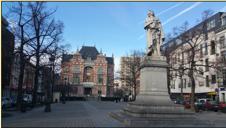
(La Haute École Francisco Ferrer, en la plaza Anneessens)

El español es muchas veces una asignatura opcional, por lo que muestran un buen nivel de motivación. La fluidez de los estudiantes en español varía enormemente no sólo entre clases (en mi caso, asisto a clases tanto de primer año como en último año de máster), sino también dentro de las mismas.