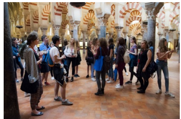
Algunas imágenes con recuerdos imborrables de nuestra estancia en tierras andaluzas.