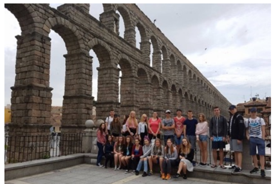
Momentos de las excursiones a Segovia y Ávila

Gracias a este viaje, el alumnado de primero pudo poner en práctica en situaciones de comunicación reales los conocimientos aprendidos a lo largo del curso además de impregnarse de la cultura española. La valoración de los estudiantes sobre esta experiencia fue muy positiva, por lo que varios alumnos de otros cursos han decidido realizar una estancia durante parte de sus vacaciones de verano en esta ciudad con una planificación similar a la de sus compañeros de primero.