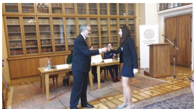
En la primera imagen: Michal Tuckova, encargado de temas iberoamericanos en el Ministerio de Asuntos Exteriores de República Checa y Rebeca Gryspan, Secretaria General Iberoamericana.