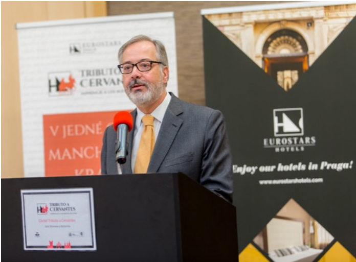
Izquierda: Excmo. Embajador de España D. Pedro Calvo-Sotelo. Abajo, autoridades presentes en el acto junto al: Excmo. Embajador de España: el Viceministro de Educación del gobierno checo, la Consejera Económica y Comercial, la Consejera de Turismo, el Consejero Cultural, la Agregada de Educación, representantes del Instituto de Traductología de Praga, y de las universidades de Olomouc, Comillas, Zaragoza y Mondragón.