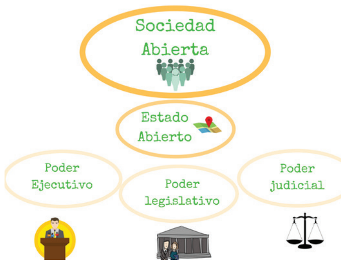
Imatge 1. La societat oberta