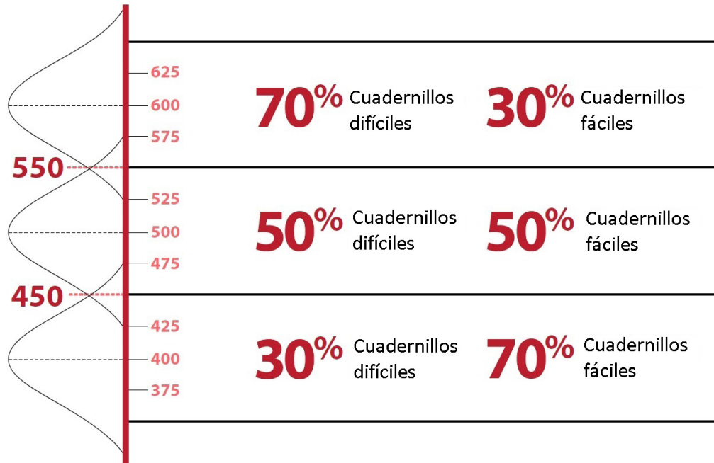
Muestra 6: Plan para la asignación de cuadernillos en países con un alto, medio y bajo rendimiento

sencillos, zzej. 30 %. A los países con un rendimiento entre los 450 y los 550 se les asignarán una cantidad proporcional igual de cuadernillos fáciles y difíciles y los países con un promedio bajo de rendimiento recibirán proporcionalmente menos cuadernillos difíciles (30 %) y más cuadernillos sencillos (70 %).