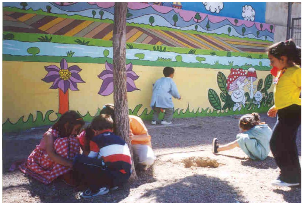
Fotografía 2. Los murales llenan de luz y color el patio de recreo.

A partir de este momento, se emprendieron los planes de acción, con la ilusión y el esfuerzo de todos: padres y madres, profesorado y, por supuesto, los protagonistas, los niños, niñas y jóvenes de Segovia, que añadieron a los patios colores y murales, fuentes, juegos, papeleras, bancos, árboles... ¡El esfuerzo de todos había logrado cambiar la cara y dar color a unos patios tristes y feos!