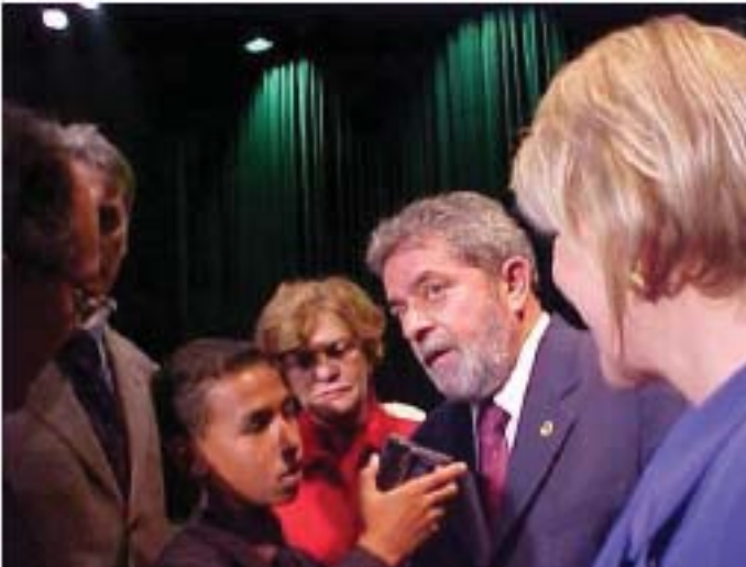
Figura 2. O Presidente Lula é entrevistado por um participante do projeto Educom.radio.

à todos os professores: matemática, geografia, história, português, para que descobrissem novas metodologias para ministrar as aulas utilizando as várias linguagens da arte como cinema, construção de brinquedos, cantigas de roda, circo, música etc. e vários outros diferentes projetos que objetivavam relacionar as várias áreas do conhecimento em torno de projetos numa tentativa de romper com a sala de aula tradicional e isolada.