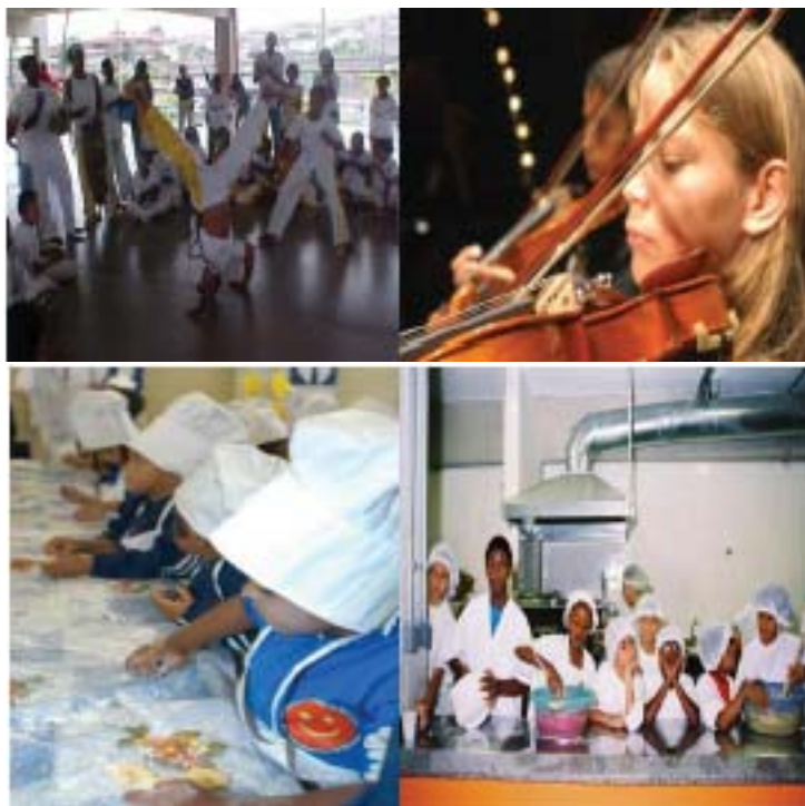
Figura 1. Diversas atividades no CEU: orquestra, padaria, atividade com as criança de 4 a 6 anos, capoeira.

Muitos projetos também foram lembrados a partir da elaboração coletiva, éramos em torno de 100 pessoas, da Política Educacional Inclusiva por representantes da equipe pedagógica da Secretaria e das 31 Coordenadorias de Educação. Foi um debate intenso, confrontando idéias sem distinção entre as pessoas e o cargo que ocupavam. Naquele espaço nasceu o Projeto CIDADE EDUCADORA EDUCAÇÃO INCLUSIVA – Um Sonho Possível .