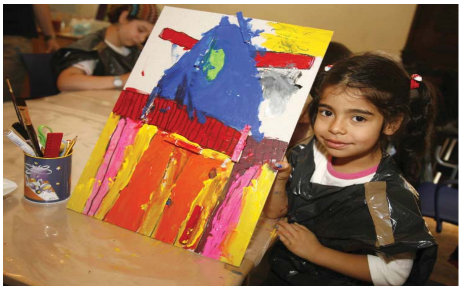
Fotografía 3. Taller infantil.

Cada uno de los 365 días del año la obra permanece abierta para los visitantes, pero también para colegios, institutos, ikastolas.