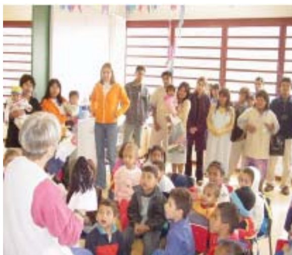
Figura 8. Contação de estórias na biblioteca.

Por exemplo, pessoas da Melhor Idade (acima de 60 anos), muitas vezes já aposentados, sem contato com a família, excluídos do mercado de trabalho impossibilitados de ter uma vida culturalmente ativa, contavam com atividades direcionadas para esta faixa etária, como hidroginástica, yoga, caminhada, aulas de dança de salão, informática, rodas de leitura e até de Bailes da Saudade . Com o tempo propusemos a eles que participassem das “contações” de estórias e histórias que ocorriam na biblioteca para as crianças ou em baixo de árvores. Foi um sucesso, muitos encontraram de novo um objetivo para seus dias.