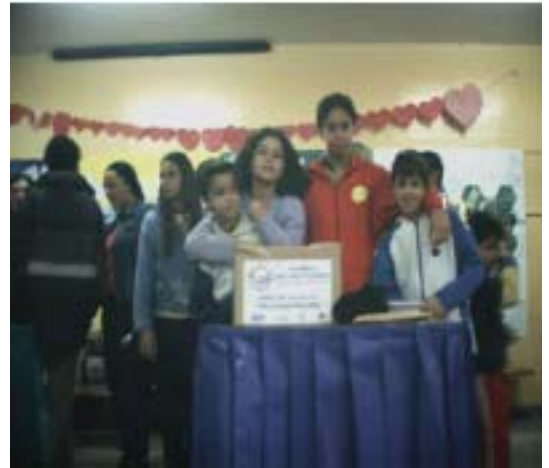
Figura 12. Educandos da escola.

Mesmo conscientes da existência de obstáculos e conflitos, inerentes ao processo que seria vivenciado por aquelas crianças e jovens, da mudança a que estariam expostos, individual ou coletivamente, os resultados foram surpreendentes. Os debates fizeram com que não apenas eles, também nós, educadores, confrontássemos nossas idéias e posturas perante eles, nossos pré-conceitos e o embate entre o discurso e a prática democrática.