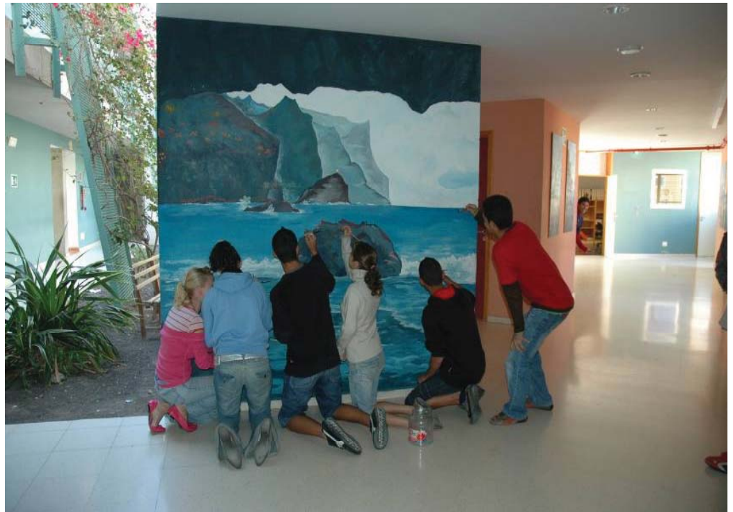
Fotografía 5. Trabajo cooperativo en el edificio nuevo.

por la Consejería de Educación, Cultura y Deportes del Gobierno de Canarias a propuesta del CEP de Gáldar para realizar la experiencia piloto de La máscara del amor junto con otros 27 centros del Archipiélago. Se trata de un taller de prevención de la violencia de género dirigido a jóvenes, que acompaña a la lectura de la novela El infierno de Marta; la máscara del amor . Con el mismo se está logrando concienciar a toda la comunidad educativa de la violencia de género y sus graves consecuencias. Pero uno de los principales escollos está la adaptación de los contenidos: cómo reducirlos sin perder el objetivo de las sesiones. También el poco tiempo dedicado a la práctica.