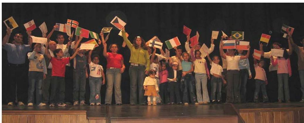
Fotografía 6. Fiesta multicultural.

Dentro de este proyecto nace para este nuevo curso, Medialdea, otro proyecto de mediación escolar para la resolución de conflictos que tiene por objetivo la formación de mediadores que actuarán en dichas resoluciones ■