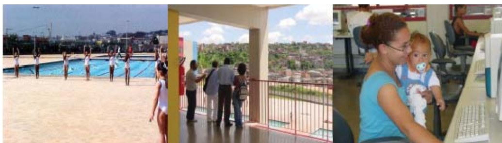
Figura 5. Domingo na periferia de Sao Paulo A familia toda aproveita o CEU.

Durante a semana, as crianças e jovens, fora do seu horário de aula, têm acesso à nataçãõ, aulas de esporte e dança, informática e muitas outras atividades complementando a jornada escolar, escolhendo o que mais lhe agrada, auxiliando nas suas descobertas vocacionais e oferecendo educação integral.