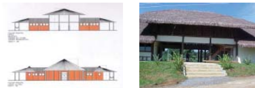
Figura 9. CECi. Centro Educaional da Cultura Indígena.

Na Opy ouvem pohahey , as belas palavras proferidas pelos pajés, os quais ouvindo as vozes e orientações divinas de Ñanderú conduzem o povo para espaços em que neles possam ser construídas suas aldeias.