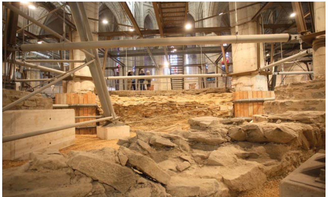
Fotografía 1. Interior de la catedral en obras.

M a Cruz del Amo del Amo Senén Crespo de las Heras