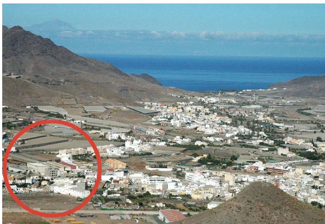
Fotografía 2. Ubicación del Instituto en el valle principal de la Aldea.

La historia de La Aldea de San Nicolás la define en su época moderna y contemporánea un centenario pleito socioagrario entre su población, medianera en el régimen de enfiteusis (El Pleito de La Aldea), y los propietarios de un gran latifundio enclavado en las mejores tierras del valle principal. Se enmarca este litigio entre principios del siglo XVII y principios del siglo XX cuando interviene el Estado, expropia a los latifundistas y vende a los colonos, naciendo así un régimen de propiedad de la tierra (vinculada al agua) minifundista que aún impera. Desde tiempo inmemorial se mantuvo una economía de autoconsumo a base de la producción cerealística que cambia hacia 1898 con la introducción del tomate para la exportación. Hoy, en la primera década del siglo XXI, mantiene el mismo modelo económico del monocultivo; pero, en un marco tecnológico, social, cooperativista y comercial muy distinto; modelo de desarrollo económico que parece estar agotado y que ha entrado desde hace unos pocos años en una nueva crisis.