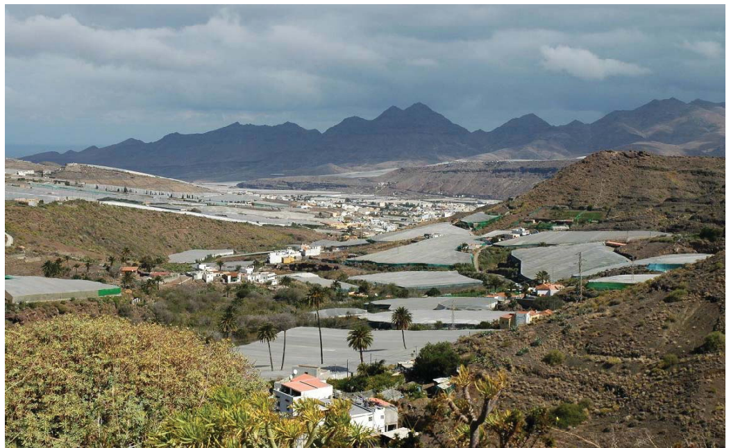
Fotografía 1. Municipio de la Aldea de San Nicolás.

Profesor de Geografía e Historia del IES y Cronista oficial del municipio