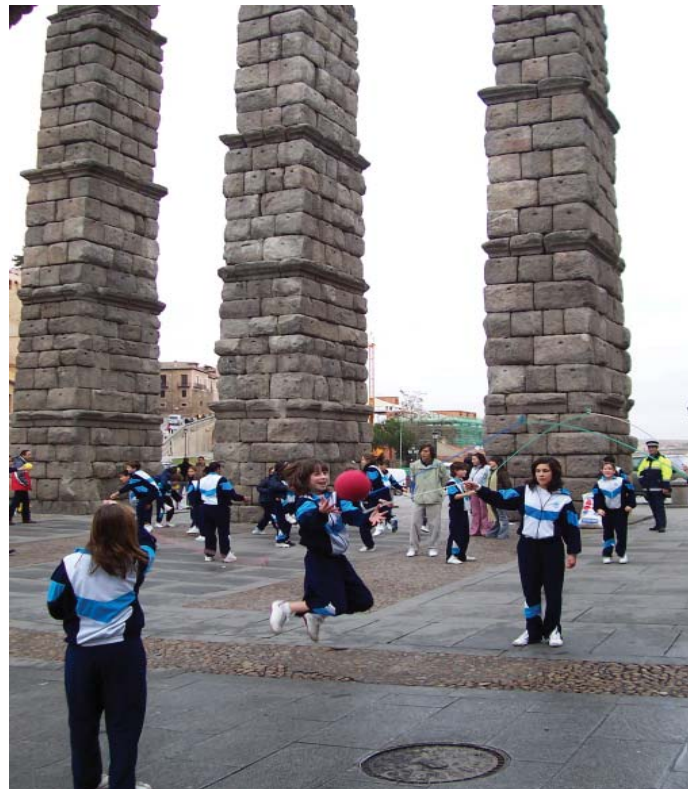
Figura 3. Los niños, con sus juegos, hacen realidad el lema: calles para caminar, calles para jugar, calles para todos.

Implicarse en un Programa como “ De mi Escuela para mi Ciudad ” requiere esfuerzo y sobre todo, mucha ilusión y confianza en que, entre todos, y sobre todo escuchando lo que los niños tienen que decir con total seriedad, podemos mejorar nuestro entorno, nuestro barrio, nuestra ciudad, para que sea un espacio respetuoso y amable con quienes la habitan.