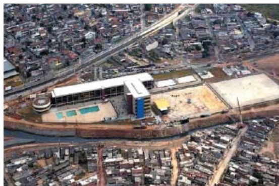
Figura 3. Foto aérea CEU JAMBEIRO.

A degradação urbana é motivada por inúmeras causas econômicas, políticas e sociais, tendo, como produto, lutas sociais em que, de um lado, estão os legitimados pelo poder e, de outro, os excluídos.