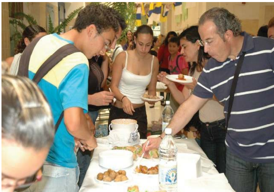
Fotografía 3. Promoción de una alimentación sana (2007).