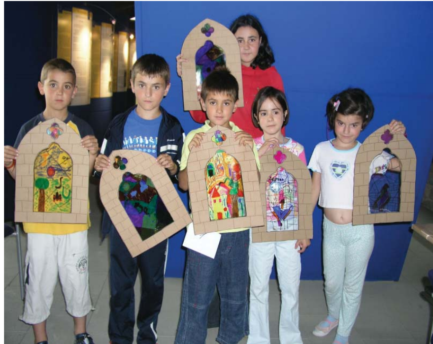
Fotografía 4. Taller de vidrieras.

De acuerdo con las informaciones que las instituciones escolares nos ofrecen, la visita a la Catedral Vieja es uno de los destinos educativos mejor valorados y más solicitados por los alumnos.