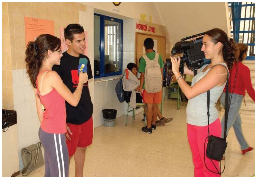
Fotografía 4. Trabajo de filmación en El Rotulador (2007).

Es un proyecto de televisión escolar único en Canarias, diseñado en el curso escolar 2003-2004 por la necesidad de la comunidad escolar de contar con un programa televisivo escolar para informar de los problemas, las situaciones y los proyectos de la enseñanza secundaria en La Aldea. Comprende, básicamente, una serie de trabajos escolares televisados a la comunidad escolar, cuyos contenidos son previamente seleccionados por alumnado y profesorado del centro bajo la coordinación del profesor coordinador del proyecto. El formato del mismo presenta una primera parte donde un grupo de alumnos hace un recorrido por las aulas y departamentos en busca de noticias y trabajos educativos previamente preparados y una segunda parte que se filma fuera del centro en un lugar o personaje de interés etnográfico, histórico o social, en base a un trabajo previo de investigación y diseño del alumnado.