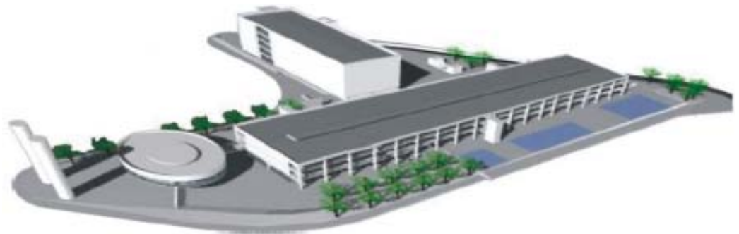
Figura 6. Projeto arquitetônico CEU - Alexandre Delijaicov, André Takiya e Wanderley Ariza.

O Centro Educacional Unificado foi o principal projeto da Secretaria Municipal de Educação, carinhosamente chamado de “CEU”. Integra no mesmo espaço físico, equipamentos de diversos órgãos da administração municipal: Secretarias da Educação, de Cultura e de Esporte, e ainda conta com a presença efetiva das Secretarias Municipais de Assistência Social, Saúde, Transporte e Infra Estrutura Urbana, Segurança Urbana e das Subprefeituras, vivenciando a intersectorialidade, demonstrando como o poder público, de forma integrada, pode aproximar-se das comunidades locais compreendendo melhor suas necessidades permitindo otimizar os recursos públicos ao atender as demandas apresentadas integradamente.