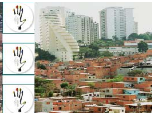
Figura 4. Favela Paraisópolis localizada num dos mais luxuosos bairros de São Paulo.