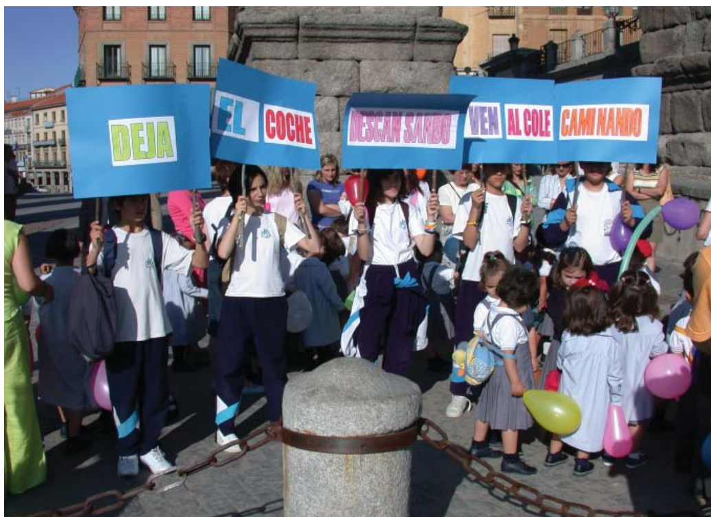
Fotografía 1. Un día sin coches.

Las cuatro propuestas premiadas fueron, poco a poco y en distinta medida, haciéndose realidad, y aunque algunas no pasaron de un plano simbólico, otras se materializaron y fueron asumidas por la ciudad.