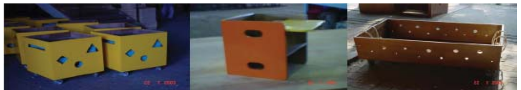
Figura 7. Móveis especialmente desenhados e confeccionados para as creches a partir de sugestões dadas pelas professoras: caixas para guardar brinquedos, cadeirão que vira banco ou mesa, carrinho para as professoras levarem os bebês para passear, cabiam até seis bebês.

O CEU funcionava como todas as outras Unidades Educacionais da Rede Municipal de Ensino, como um espaço de educação inclusiva, de formação permanente e de humanização das relações sociais. Sua concepção exigia a construção processual do Projeto Político Pedagógico permitindo a todos atualizar informações e contextualizar suas próprias experiências, de modo a reconhecer, considerar e trabalhar com as diferenças e desigualdades nas diversas formas em que se apresentam em nosso cotidiano.