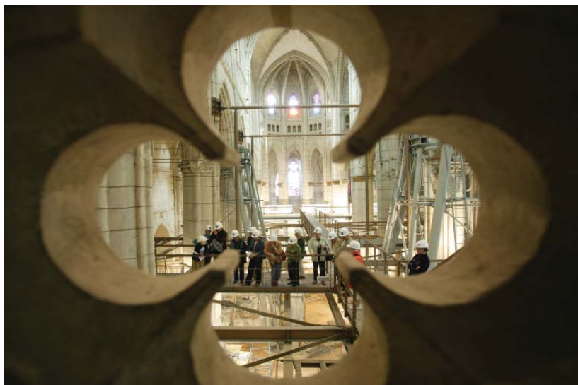
Fotografía 5. Una perspectiva del templo.

Nadie como Mario Vargas Llosa ha sintetizado el alcance del proyecto: “Una obra monumental en lo técnico y en lo arquitectónico, pero también por abrir el templo a la sociedad civil, recuperar las funciones artísticas, culturales, científicas y educativas de las catedrales. La restauración de la Catedral de Santa María es el nexo de unión de las ilusiones de muchos ciudadanos por un gran proyecto común”.