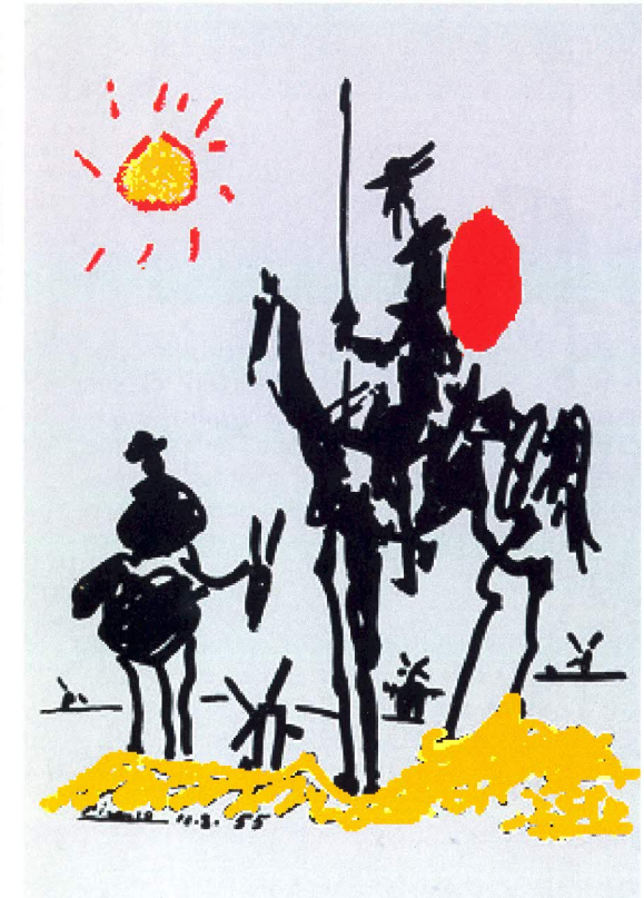
Don Quijote y Sancho, Pablo Picasso, 1955. Litografía, 51cmx41cm