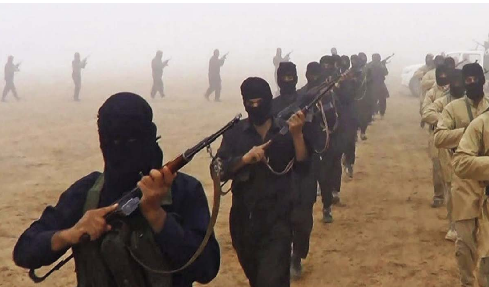
Fig. 12. Miembros del Daesh en Siria realizan una demostración de fuerza (25/08/2015).

En Siria la Primavera Árabe y la represión aplicada por el gobierno desembocaron en una guerra civil que enfrentó a los defensores del status quo y los descontentos con el régimen de Damasco, y en la que pronto entraron los grupos yihadistas. Primero fue Al Qaeda, que constituyó una filial bautizada como Frente al Nusra en 2011. Los primeros combatientes de Al Nusra procedían de Irak, donde operaba una franquicia de Al Qaeda que había ido variando de nombre desde que se organizara para resistir a las tropas de Estados Unidos en 2003. Primero se llamó Organización para el Monoteísmo y la Yihad, luego se bautizó como Al Qaeda en el País de los Dos Ríos; en 2006, pasaron a ser el Estado Islámico de Irak. La decisión del líder de este grupo, Abu Bakr al Bagdadí, de pasar a combatir a Siria, donde ya operaba el Frente Al Nusra, en contra de la opinión de la dirección de Al Qaeda, provocó la ruptura entre las dos organizaciones. El grupo de Al Bagdadí, que había integrado en sus filas a numerosos militares del ejército de Sadam Hussein, se reconvirtió en el Estado Islámico de Irak y Levante (Daesh) a partir de 2013 y luego abrevió a Estado Islámico. Los éxitos