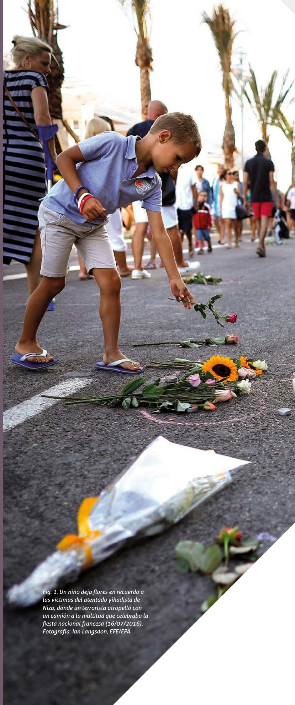
Fig. 1. Un niño deja flores en recuerdo a las víctimas del atentado yihadista de Niza, donde un terrorista atropelló con un camión a la multitud que celebraba la fiesta nacional francesa (16/07/2016).

NIPO Mº Educación y Formación Profesional: 847-20-075-8