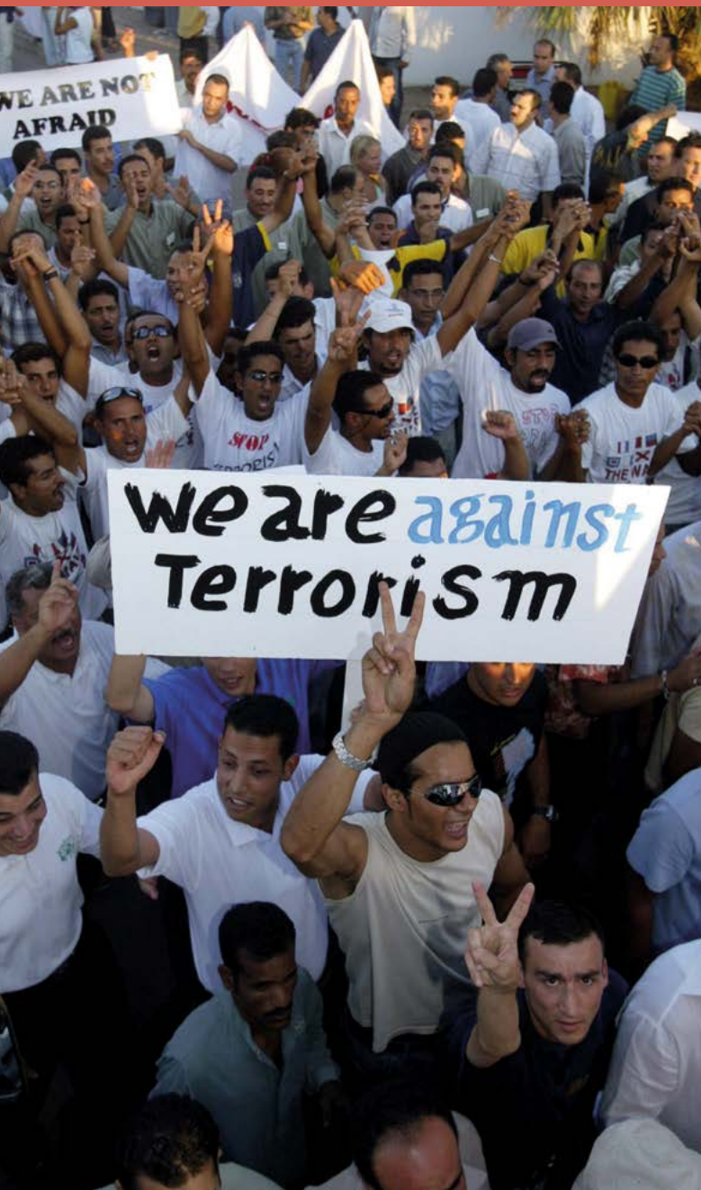
Fig. 13. Cientos de trabajadores se manifiestan a las puertas del Hotel Ghazala Gardens en Sharm el Sheij, Egipto, protestando contra el terrorismo un día después de la serie de ataques con bomba en este complejo turístico que mató al menos a 90 personas e hirió a más de 150 (24/07/2005).

A partir del caso de Tomás Fraga, generar debate e intercambio de opiniones en la clase sobre los efectos del terrorismo y el odio que debió inculcarse a quien fue capaz de cometer tal acción, amparado en la excusa de la supuesta liberación de su pueblo y de su fe. Contraponemos de esta forma el odio que alimenta todo terrorismo frente a la renuncia que hacen las víctimas a tomar venganza y confiar en la impartición de una justicia con todas las garantías. En definitiva, ahí reside la capacidad de resistencia de las democracias que la acción terrorista trata de combatir.