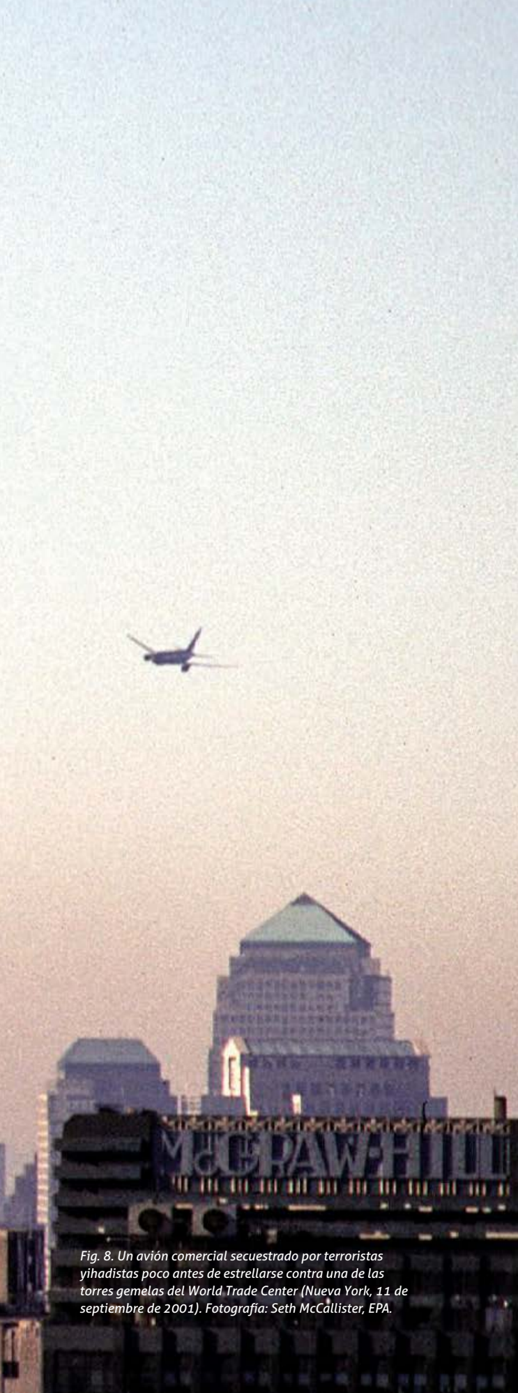
Fig. 8. Un avión comercial secuestrado por terroristas yihadistas poco antes de estrellarse contra una de las torres gemelas del World Trade Center (Nueva York, 11 de septiembre de 2001).