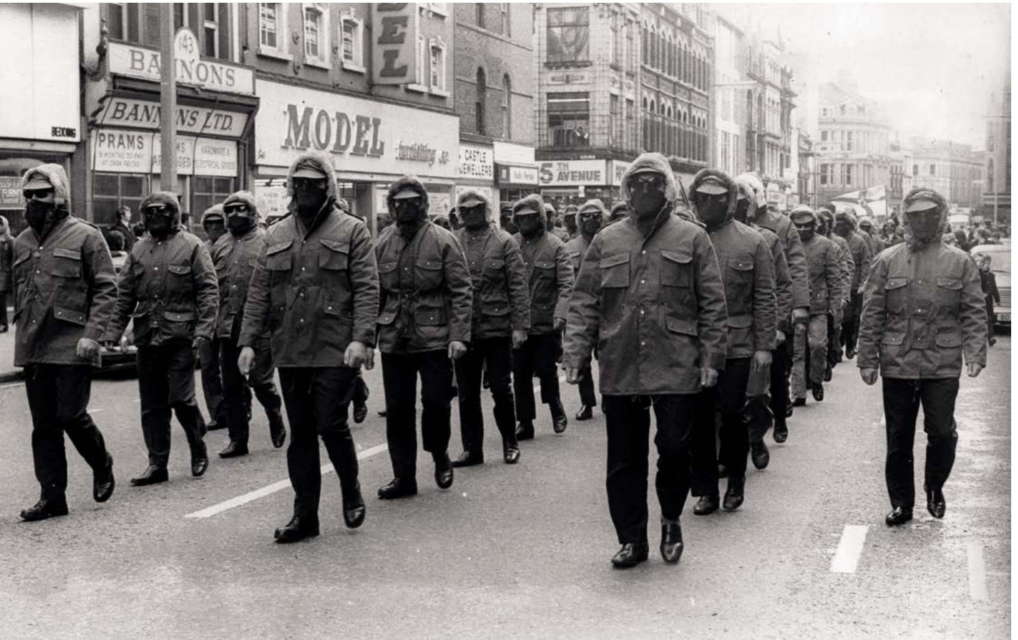
Fig. 4. El año más sangriento del terrorismo en Irlanda del Norte fue 1972, cuando cerca de 500 personas fueron asesinadas, la mayoría de ellas a manos del IRA Provisional.

Se estima que en el mundo cada mes se registran una media de 900 atentados, según datos del Jane's Terrorism and Insurgency Centre . Reinares (2015) afirma que nueve de cada 10 atentados a nivel mundial se producen actualmente en Asia Meridional, Oriente Medio y la mitad septentrional de África. A pesar de sus muchas diferencias en el fondo y en la forma, también se podría afirmar que grupos aparentemente tan dispares como las FARC, Al Qaeda, Daesh, el IRA, ETA o Boko Haram tienen ciertas características comunes. Así, en todos ellos se presenta un pensamiento fanatizado que lleva a combatir y eliminar al diferente, construido este como un enemigo.