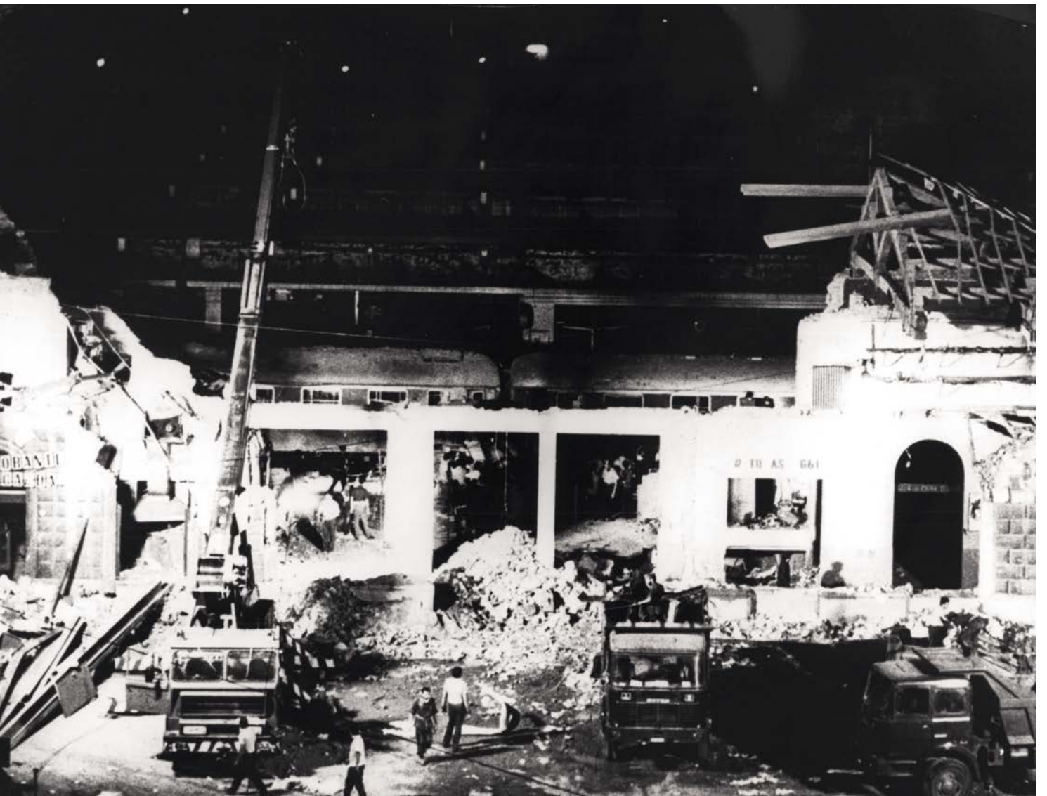
Fig. 3. Vista general de la estación central de trenes de Bolonia, devastada por una explosión terrorista.

Los atentados originan costes materiales y de seguridad.