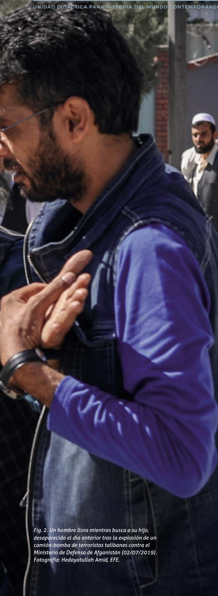
Fig. 2. Un hombre llora mientras busca a su hijo, desaparecido el día anterior tras la explosión de un camión-bomba de terroristas talibanes contra el Ministerio de Defensa de Afganistán (02/07/2019).