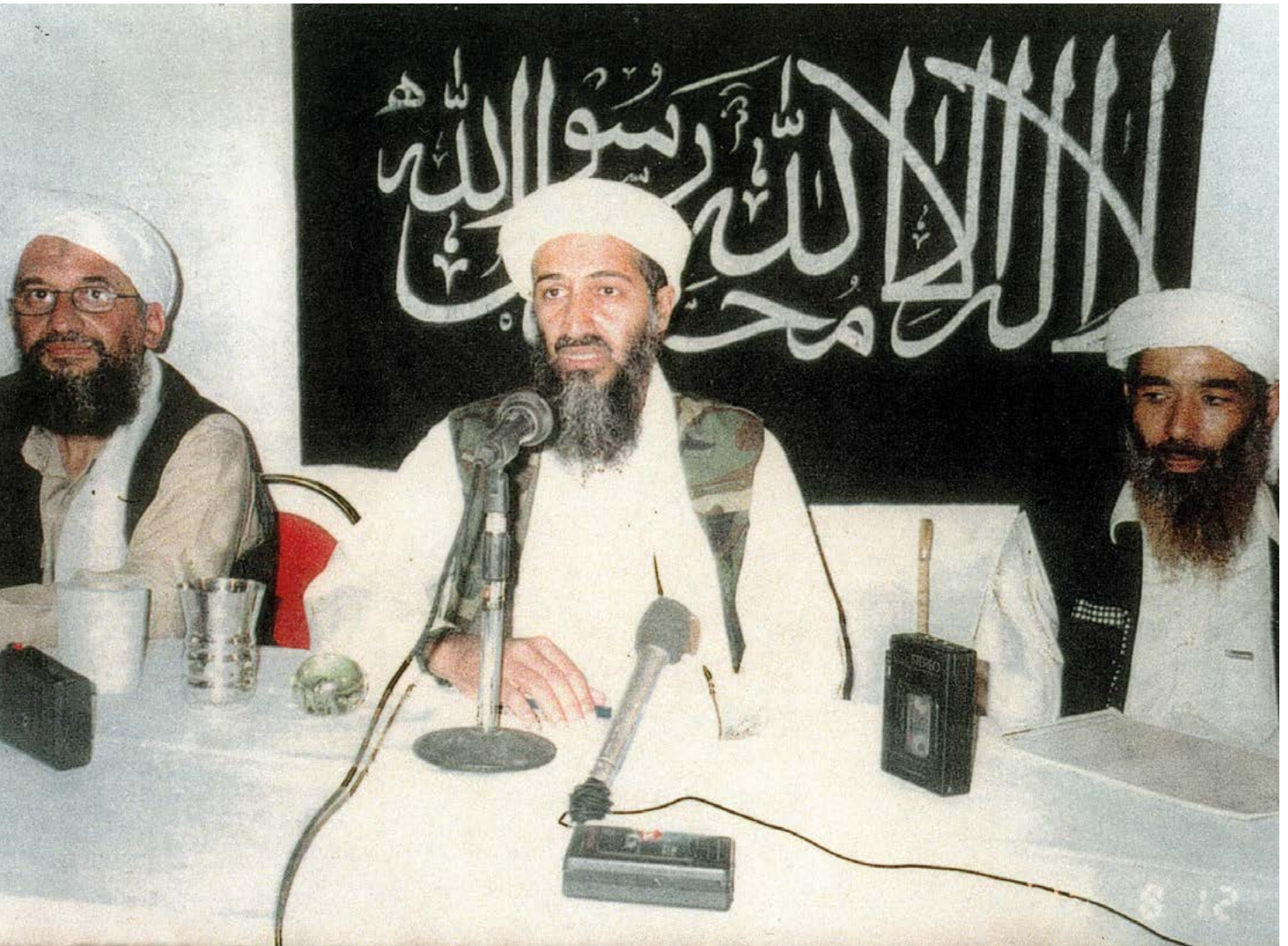
Fig. 9. El saudí Osama Bin Laden posa en el centro de la imagen, acompañado por otros líderes de Al Qaeda: Ayman Al Zawahiri (izquierda) y Mohammed Atef (derecha).

tivación religiosa, se trasladaron a Afganistán para combatir a los ocupantes. Al cabo de una década, en 1989, la URSS se retiró derrotada del país asiático.