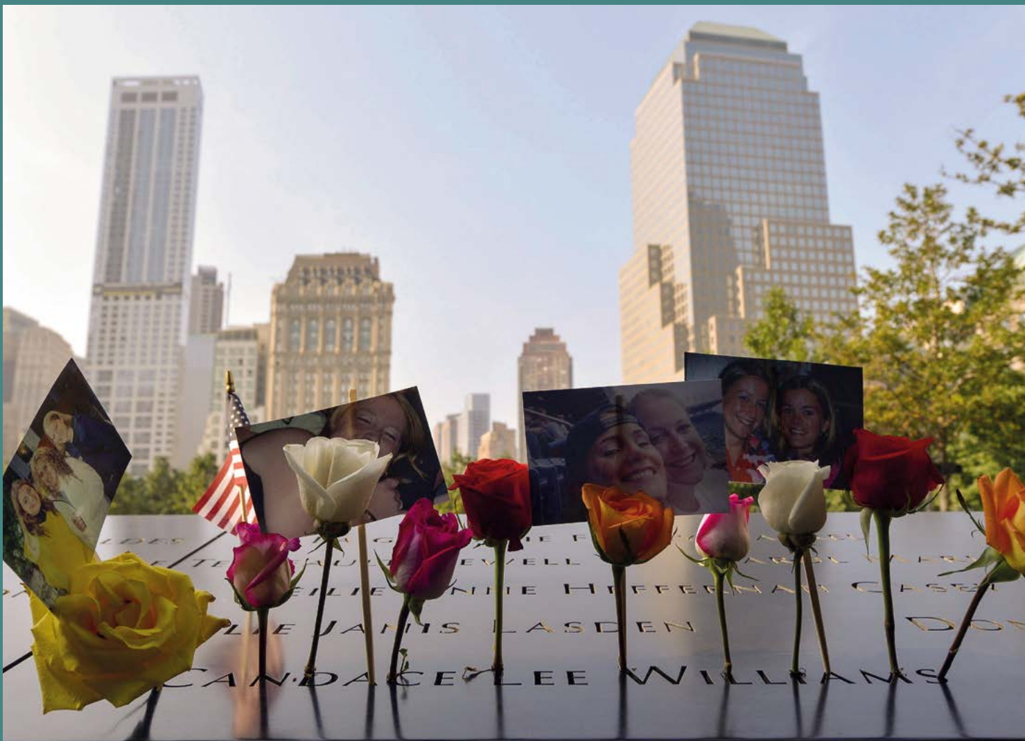
Fig. 10. Flores y fotografías dejadas en honor a las víctimas del 11-S en un aniversario de estos atentados.

Finalizará la actividad pidiendo al grupo que manifieste su impresión sobre el sufrimiento experimentado por las víctimas de este atentado. El profesor puede dinamizar el debate introduciendo preguntas de este tipo: A pesar de que los atentados son distintos por sus contextos sociopolíticos y lugares en que se producen, ¿consideras que el sufrimiento es diferente? ¿Son iguales todas las víctimas?