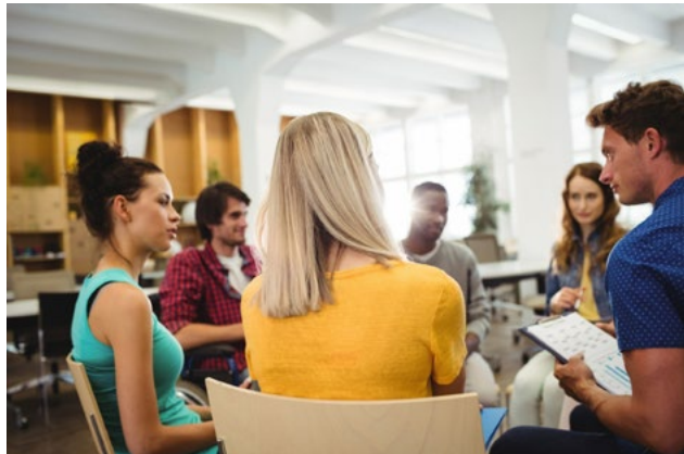
Ilustración 3: Jóvenes debatiendo.

Autora: @peoplecreation en www.freepik.es