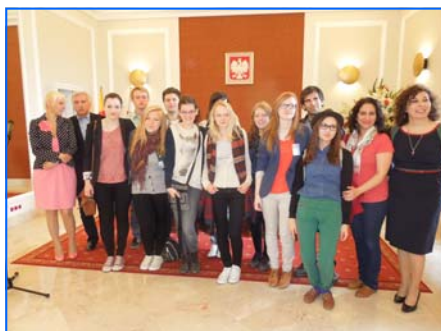
Recepción en el Ayuntamiento de Varsovia

Todas las tardes, menos el miércoles 25, su única tarde de descanso, asistieron a las representaciones teatrales que comenzaban a las 15.00. Cada día, con excepción de las jornadas de Inauguración y Clausura, los grupos participantes y estudiantes de español de Varsovia pudieron disfrutar de tres o cuatro obras de teatro de una duración de 50 minutos cada una. El público se mostró muy participativo en todo momento: aplaudió, rió a carcajadas y demostró que apreciaba la labor de sus compañeros.