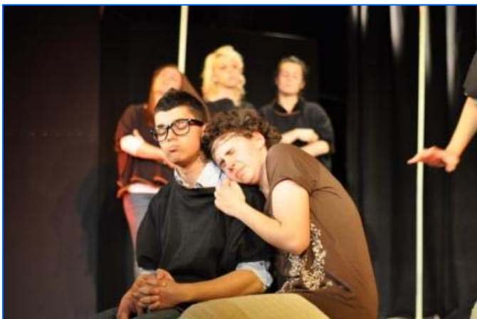
Actuación de Plovdiv, Bulgaria