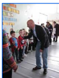
Imágenes del concurso