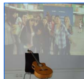
Video de presentación de una de las SSBB de español

El Embajador de España en Polonia, D. Francisco Fernández Fábregas, también nos honró con unas palabras e hizo entrega de sus becas a los 56 alumnos seleccionados de los siguientes centros: I LO de Bydgoszcz, VI LO de Cracovia, Gimnazjum nr 3 de Gdańsk, XV LO de Gdańsk, III LO de Gdańsk, II LO de Katowice, XXXII LO de Łódź, Gimnazjum nr 19 de Lublin, IX LO de Lublin, IV LO de Radom, XIV LO y Gimnazjum nr 32 de Szczecin, XXII LO y XXXIV LO de Varsovia, IV LO Dwujęzyczne y Gimnazjum nr 10 de Wrocław, III LO de Białystok, XVII LO-ZSO nr 4 de Poznań.