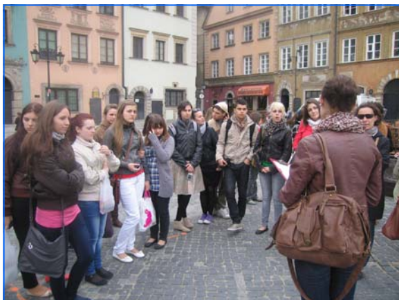
Visita cultural por la ciudad vieja de Varsovia