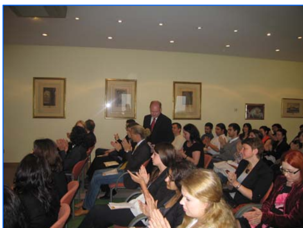
Profesores y alumnos de SSBB de español en la entrega de premios en la Embajada de España en Polonia

Durante esta reunión, la Consejera de Educación hizo balance del curso escolar y, tras la entrega de premios, tuvo lugar la puesta en común de diversos aspectos del Programa de Secciones Bilingües durante el presente curso escolar. Durante esta fase de la reunión, los profesores participaron de forma activa dando su opinión de cara a la mejora de los distintos programas y evaluando los resultados del curso actual.