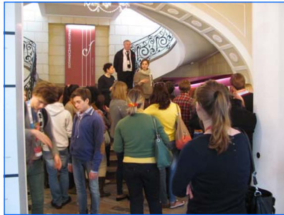
Visita al Museo Chopin de Varsovia

Todos los grupos visitaron el Museo del Levantamiento de Varsovia, el Museo de Frederic Chopin y el Centro de Ciencias Copérnico. Además, 4 grupos participaron en una visita guiada por el Teatro Municipal y en un encuentro con su director.