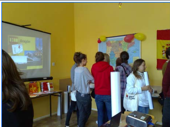
Los alumnos del Liceo I de Bydgoszcz visitan la exposición de materiales relacionados con España