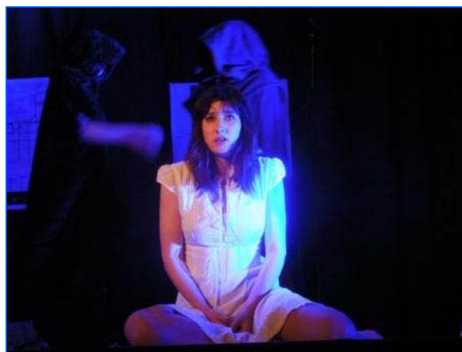
Actuación de Nitra, Eslovaquia