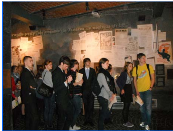
Un grupo de alumnos durante su visita al Museo del Levantamiento de Varsovia

Por la mañana se realizó una reunión de trabajo en el liceo Miguel de Cervantes de Varsovia. En esta reunión estuvieron representados el Ministerio de Educación Nacional polaco, la Central de Exámenes polaca y la Consejería de Educación de España en Polonia, además de los directores y profesores de los centros educativos. Durante la misma, se trataron temas de interés para las Secciones Bilingües de español.