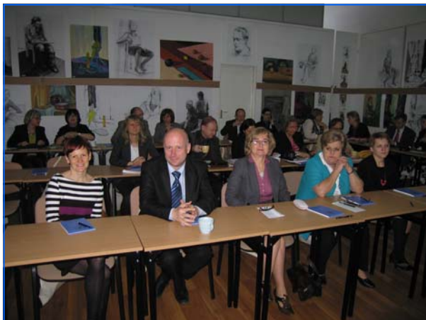
Reunión de directores y coordinadores de los centros educativos con SB en el Liceo Cervantes de Varsovia