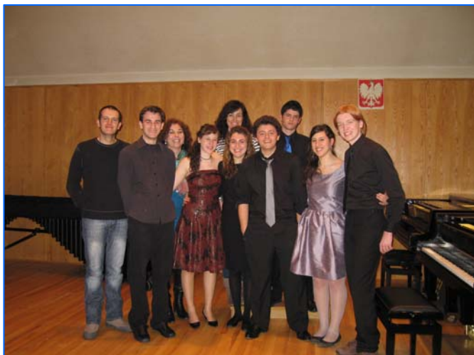
Imagen de los protagonistas del intercambio junto a la Consejera de Educación de España en Polonia.

El Conservatorio Profesional de Música “Jacinto Guerrero” de Toledo realizó en febrero un intercambio con el centro integrado musical “Karol Szymanowski” de Varsovia. Un grupo formado por 7 alumnos y 2 profesores se desplazaron a la citada ciudad para poner de manifiesto los postulados y objetivos musicales-culturales del proyecto europeo Comenius “ Music: an open door to Europe ”, que engloba centros de enseñanza de Polonia, España, Alemania, República Checa y Portugal.