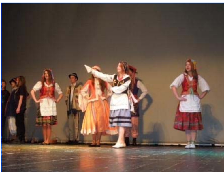
Imágenes de actuaciones de la inauguración y clausura del Festival y de algunas de las monitoras del Festival