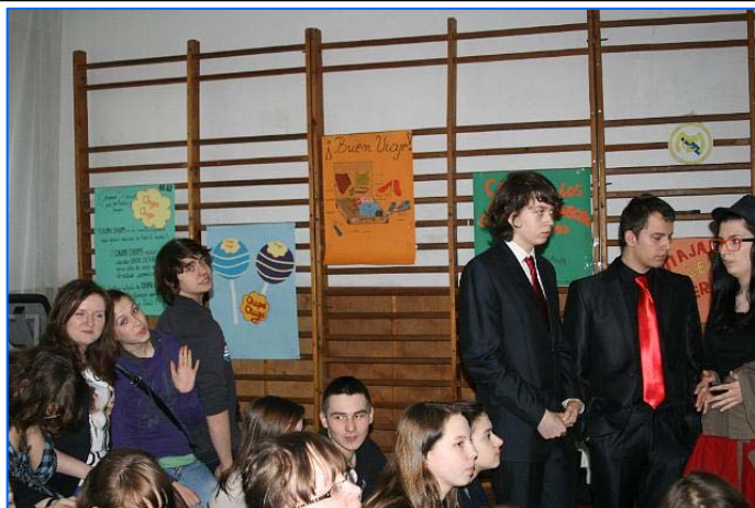
Los alumnos del Liceo I Tadeusz Kościuszko en Włodawa durante la actividad

El sábado 21 de abril de 2012 se celebró en el Liceo I de Bydgoszcz el “Día de puertas abiertas”, dedicado a futuros estudiantes que han querido acercarse hasta nuestro centro educativo para familiarizarse con las instalaciones y con el funcionamiento de la Sección Bilingüe de español.