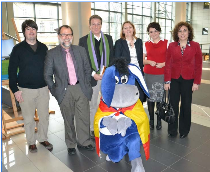
La Consejera de Educación, el Director y Jefe de Estudios del Instituto Cervantes de Varsovia, y los profesores y organizadores de la actividad junto a USiolek, el símbolo y la mascota de la universidad, que paseaba entre la gente vestido con la bandera española.