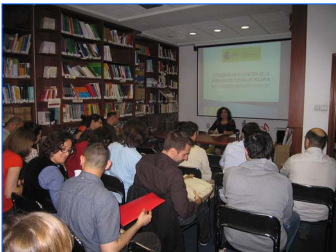
Reunión de profesores de SSBB en el Centro de Recursos de la Consejería de Educación

La reunión de profesores españoles de las Secciones Bilingües de español en Polonia comenzó el 1 de junio a las 10:30 en las instalaciones de la Consejería de Educación. Posteriormente, a partir de las 12:00, todos los asistentes se trasladaron al salón de Actos de la Embajada de España y la última parte de esta sesión de trabajo se desarrolló de nuevo en las instalaciones de la Consejería de Educación una vez finalizada la entrega de premios.