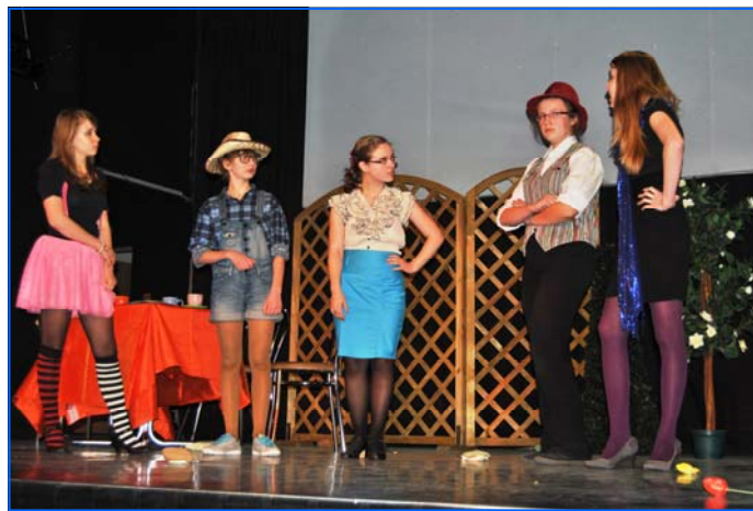
Mejor Dominio de la Lengua Española: Gimnazjum 19 de Lublin