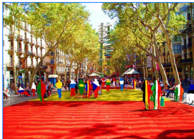
1º premio en la fase nacional de concurso en Polonia: "Otros países en España" de ANGELA BŁASZCZYK

El día 1 de junio se concedieron también en la Embajada de España en Polonia los premios y certificados correspondientes al III concurso internacional de fotomontaje.