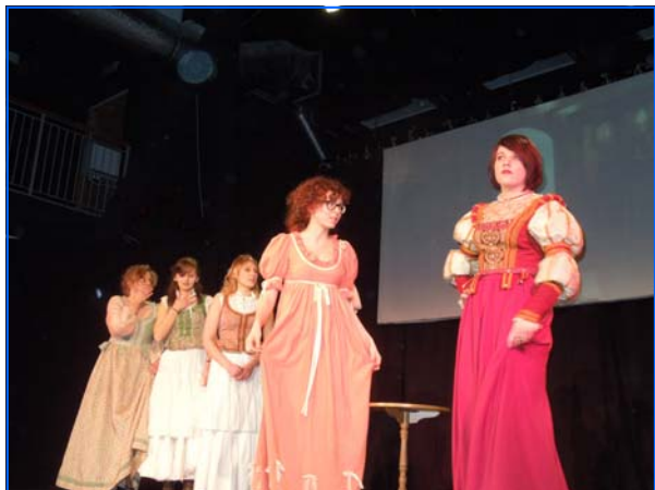
Actuación de la mejor actriz, Weronika Smotryś, de rojo