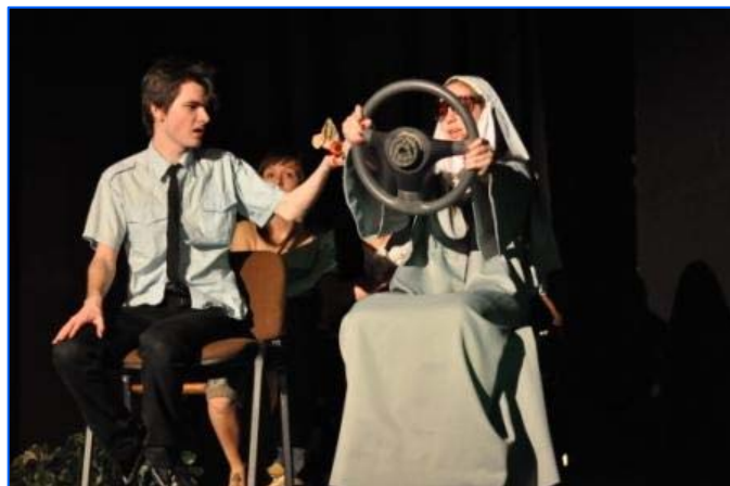
Actuación de Szeged, Hungría