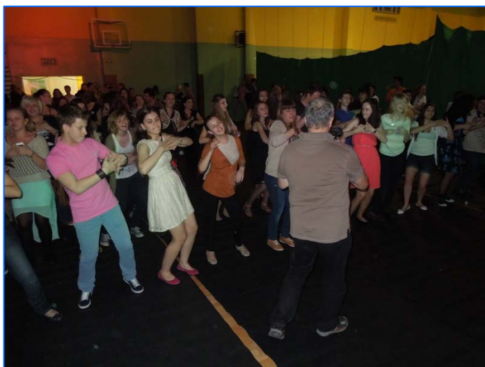
Fiesta de despedida en el Liceo Cervantes de Varsovia

http://www.festivaleuropeodeteatroenespañol.es/