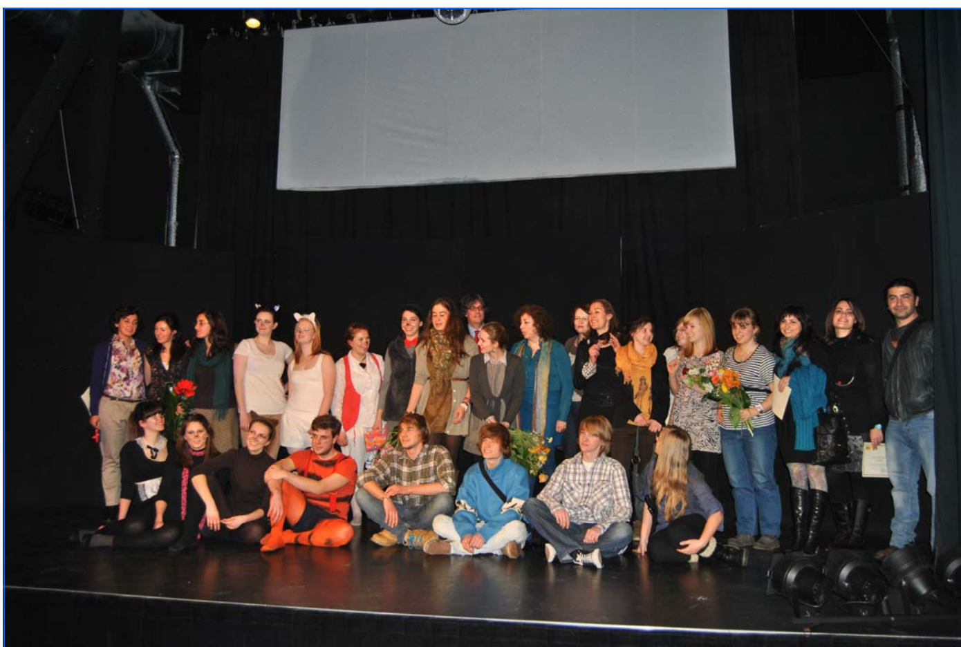
Imagen de algunos grupos participantes en el concurso junto a la Consejera de Educación, Asesoras técnicas, miembros del jurado y profesores