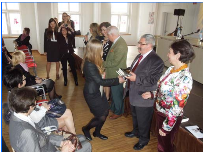
Entrega de diploma a una alumna de la SB de Katowice mientras la directora de su liceo inmortaliza la escena.

A la celebración del XX Aniversario de la creación de las Secciones Bilingües de español asistieron los directores de los centros de Polonia con SB de español y los profesores y profesoras que coordinan el programa en cada centro.