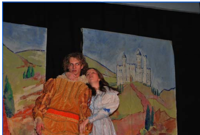
Actuación del grupo de teatro ganador de la SB de Poznań

Durante los días 27 y 28 de febrero tuvo lugar el VII Concurso de Teatro Escolar en Español organizado por la Consejería de Educación de Polonia. Los grupos de teatro participantes en esta edición mostraron un gran entusiasmo y un nivel muy alto en cuanto a interpretación y escenificación, viviéndose momentos de gran intensidad dramática. Se representaron once obras de muy diferente temática y época, con increíbles adaptaciones de autores clásicos o versiones muy actuales de otros contemporáneos, y cuyos ingredientes centrales fueron los líos amorosos y el humor.