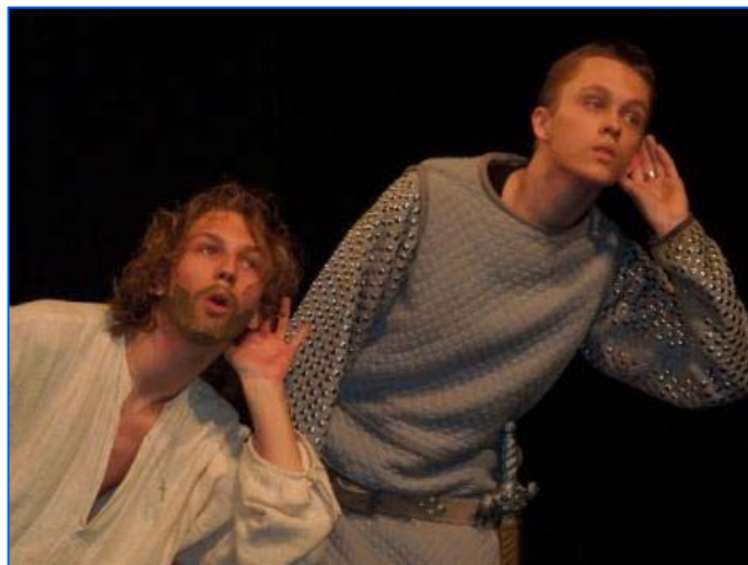
Actuación de Poznań, Polonia