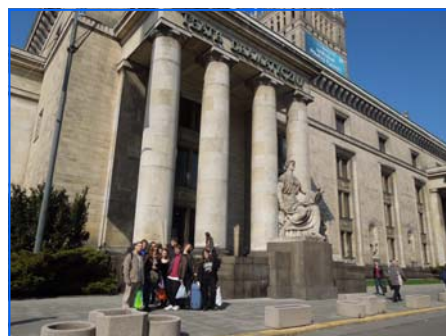
El grupo de teatro de Poznań antes de su actuación en el Teatr Dramatyczny

http://www.festivaleuropeodeteatroenespañol.es/