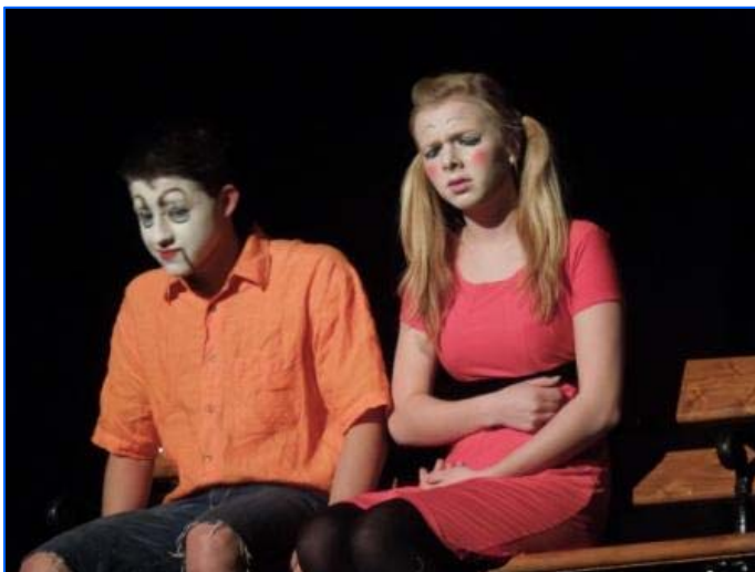
Actuación de Praga, República Checa