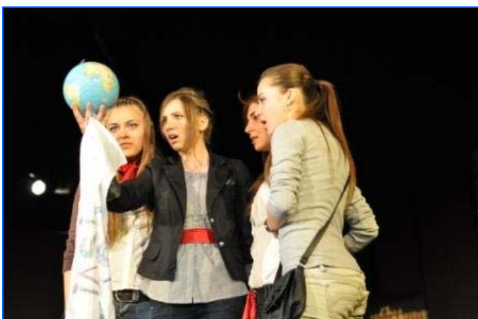
Actuación de Iasi, Rumania