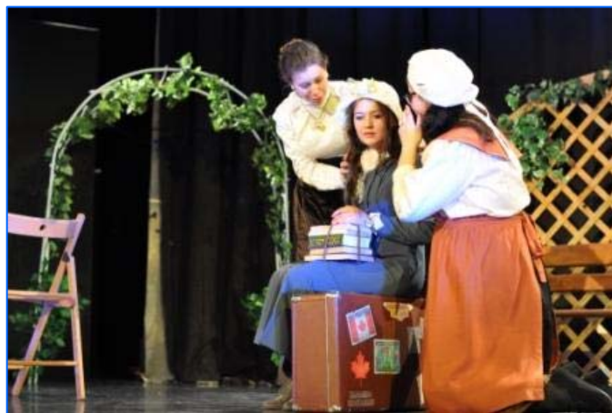
Actuación del Colegio Rosalía de Castro de Moscú, Rusia