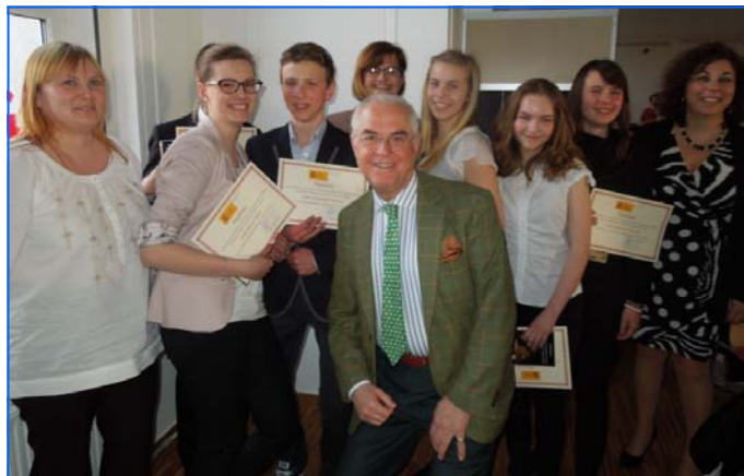
El Embajador de España y la Consejera de Educación con la representación del liceo y gimnazjum con Sección Bilingüe de Szczecin. Después de la entrega de diplomas

El día 23 de marzo, a las 15.00, se celebró el XX Aniversario de la creación de las Secciones Bilingües de español en Polonia en las instalaciones del Instituto Cervantes de Varsovia.