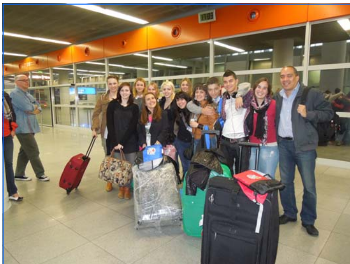
Llegada a Varsovia del grupo de teatro de Plovdiv

Las obras de teatro que se representaron y los grupos participantes fueron las siguientes: